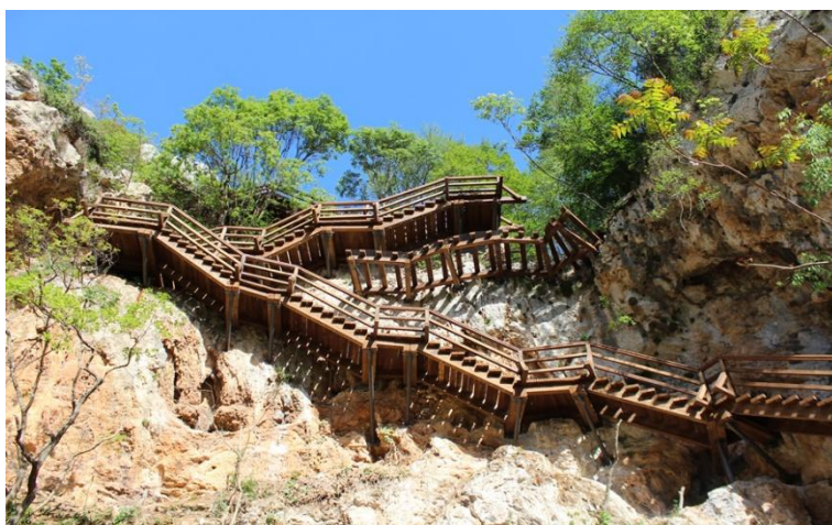
Slika 4. Staza Stinice – Roški slap – Oziđana pećina

Nacionalni park Krka u Hrvatskoj poznat je po svojim slapovima, te se smatra jednim od najljepših na svijetu, privlačeći desetke tisuća posjetitelja godišnje. Nova, 6 kilometara duga staza koja ide kroz Krku dio je višenamjenskog projekta integracije EU Natura 2000 ( EU Natura 2000 Integration Project ). 28 Poučno-pješačka staza Stinice – Roški slap – Oziđana pećina u Nacionalnom parku Krka otvorena je 2012. godine. Staza je realizirana u sklopu projekta Održivog upravljanja posjetiteljima NP Krka, radi smanjenja pritiska posjetitelja na Skradinski buk i poticanja razvoja ruralnih gospodarstava uzvodnog dijela parka. Petogodišnji projekt bio je financiran sa zajmom Svjetske banke u iznosu od 20 milijuna eura, od čega je više od šest milijuna kuna utrošeno za stazu Stinice – Roški slap – Oziđana pećina. NP Krka u 2011. godini posjetilo je 683.739 posjetitelja od čega je tek njih 1.6 % posjetilo Roški Slap što jasno pokazuje kolika je važnost otvorene staze za razvoj ruralnog turizma kroz disperziju broja posjetitelja na više različitih lokacija. Staza pomaže turiste usmjeriti prema nekim drugim vrijednim lokalitetima u parku od 100 četvornih kilometara, kao što je prapovijesna špilja. Opremljena je edukativnim panelima s detaljnim informacijama o biljnim i životinjskim svojstama specifičnima za područje NP "Krka", geološkim fenomenima kao i o kulturno-povijesnim lokalitetima koji se nalaze uz stazu. 29