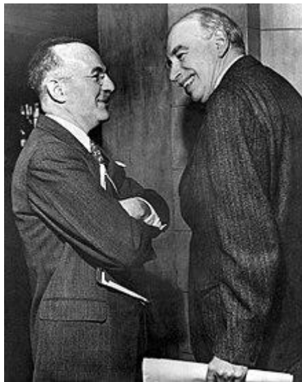
Slika 1. Harry Dexter White i John Maynard Keynes, osnivači Svjetske banke i Međunarodnog monetarnog fonda

Osnovana 1944. godine na Konferenciji Bretton Woods, Međunarodna banka za obnovu i razvoj, uskoro nazvana Svjetska banka, proširila se na blisko povezanu skupinu od pet razvojnih institucija. Iako je mnogo zemalja bilo zastupljeno na konferenciji Bretton Woods, Sjedinjene Američke Države i Velika Britanija bile su najmoćnije države u nazočnosti i dominirale su pregovorima.