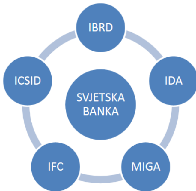
Slika 1. Struktura Svjetske banke