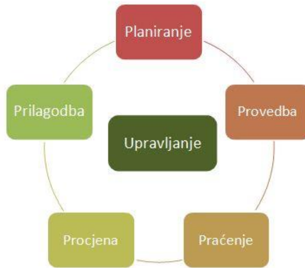
Slika 2. Proces prilagodljivog (adaptivnog) upravljanja.