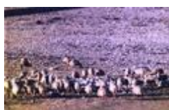
Slika 17. Paška janjetina