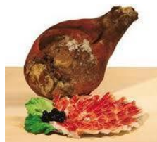
Slika 9. Dalmatinski pršut