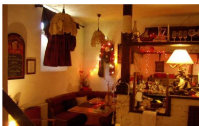
Slika 24. Konoba Dvori Matanovi