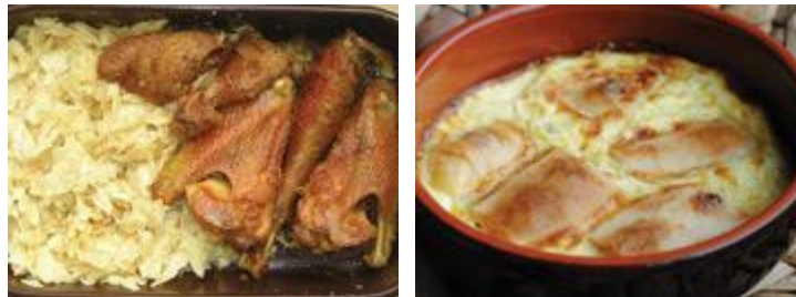
Slika 22. Purica s mlincima i štrukli