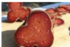
Slika 7.Slavonski kulen/slavonski kulin