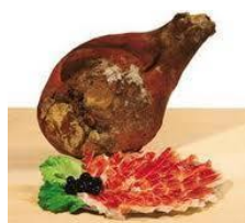
Slika 9. Dalmatinski pršut