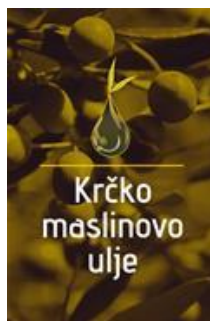
Slika 19. Krčko maslinovo ulje