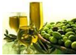
Slika 3. Ekstra djevičansko maslinovo ulje Cres