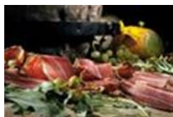
Slika 6. Istarski pršut