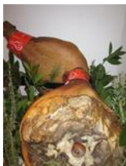
Slika 11.Krčki pršut