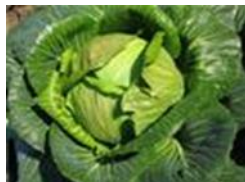
Slika 5. Varaždinsko zelje