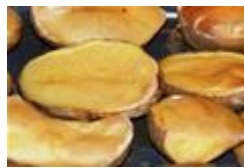
Slika 12.Lički krumpir