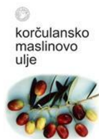
Slika 16. Korčulansko maslinovo ulje