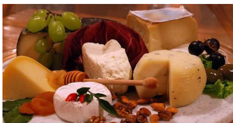
Slika 20. Jela iz hrvatske gastronomske kuhinje