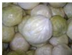
Slika 4. Ogulinski kiseli kupus/Ogulinsko kiselo zelje