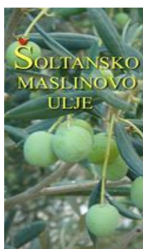
Slika 18.Šoltansko maslinovo ulje