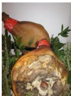
Slika 11.Krčki pršut