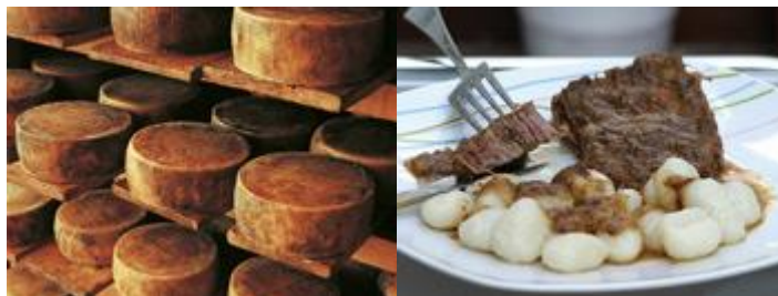
Slika 21. Paški sir i Dalmatinska pašticada