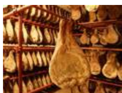
Slika 10.Drniški pršut