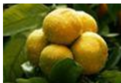
Slika 2. Neretvanska mandarina