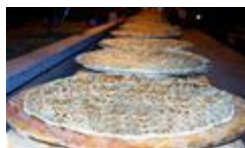
Slika 14.Poljički soparnik