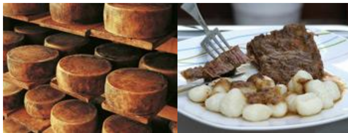
Slika 21. Paški sir i Dalmatinska pašticada