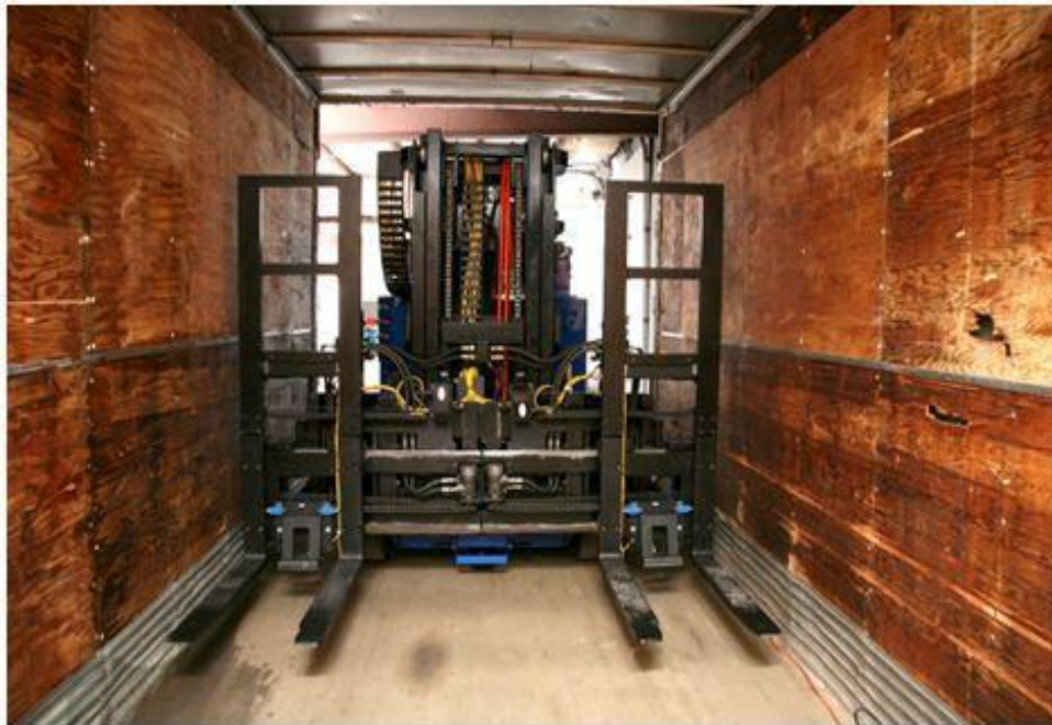
Slika 19. AGV viličar sa dvostrukim parom vilica