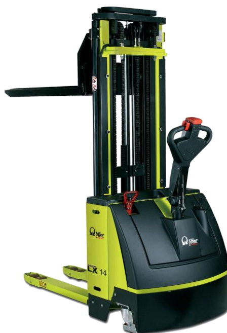
Slika 7. Visokopodizni paletni viličar