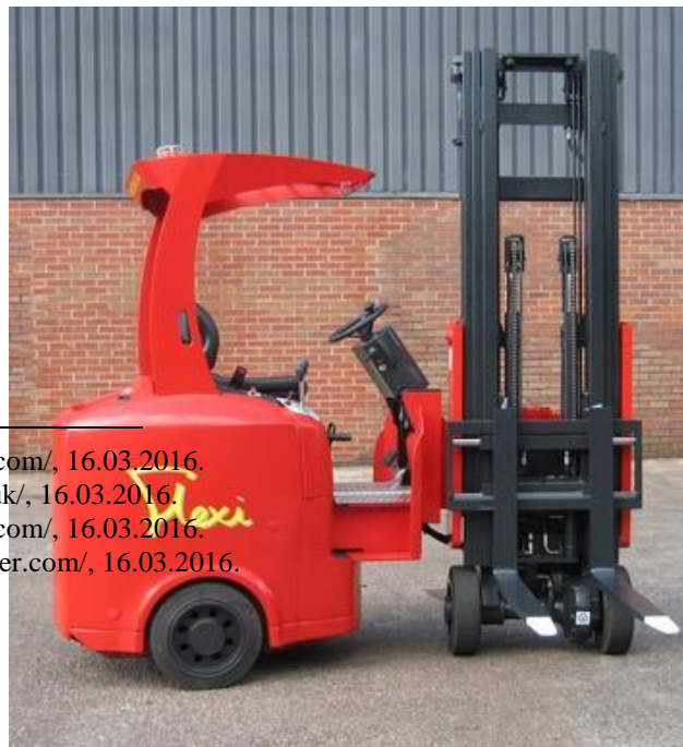
Slika 13. Viličar sa zakretnom prednjom osovinom

Viličari sa zakretnom prednjom osovinom (eng. VNA articulatedtruck) izgledom su slični čeonim viličarima uz dodatak zakretne prednje osovine (slika 13.). Prednost ovog tipa viličara je mogućnost zakreta prednje osovine koja se očituje prilikom manevriranja u prostorima s vrlo malo mjesta. Također radi zakreta prednje osovine znatno je olakšan utovar i istovar tereta. Pogonski agregati su podjednako zastupljeni kako u istosmjernoj tako i u izmjeničnoj izvedbi. Danas postoje izvedbe s baterijama s vodikovim ćelijama koje imaju mogućnost brzog punjenja. Ovaj tip viličara se koristi u zatvorenim skladištima s uskim prolazima širine od 1.75 metara. Prostor koji je ušteden korištenjem ovog tipa viličara daje mogućnost povećanja kapaciteta do 50%. Uz dodatnu opremu i nadogradnju ovaj tip viličara se može koristiti na otvorenim skladištima. Također i neke nove izvedbe u serijskoj proizvodnji su zamišljene za rad na otvorenom. 19