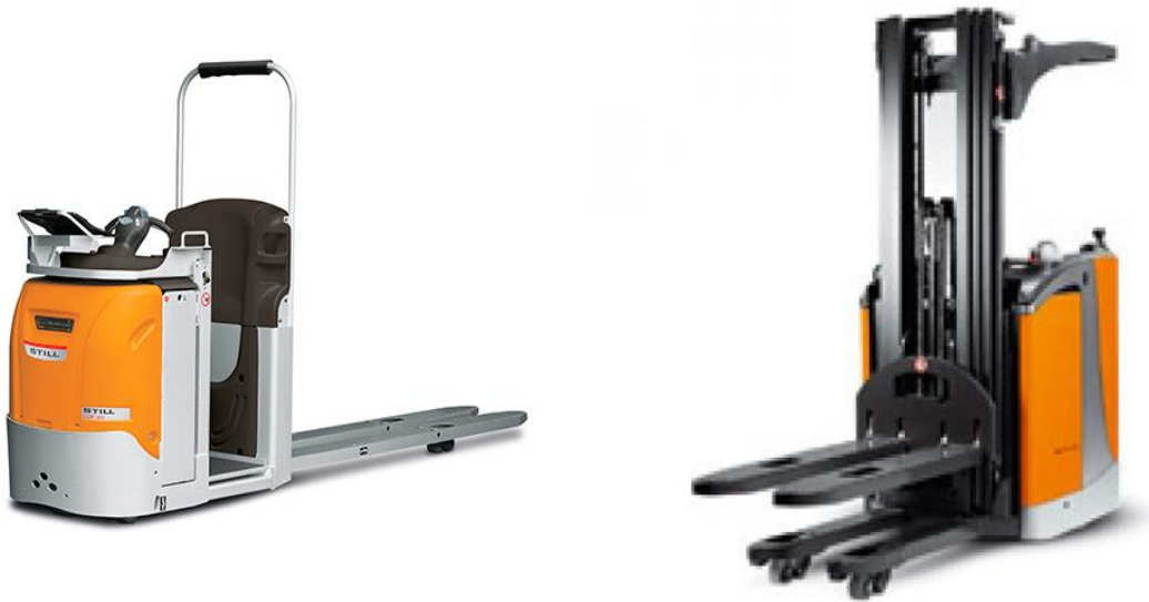
Slika 9. Horizontalni i vertikalni viličari komisioneri