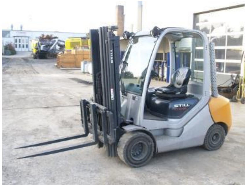
Slika 5. Čeoni viličar

Izvor: http://www.njuskalo.hr/ceoni-vilicari , 15.03.2016.