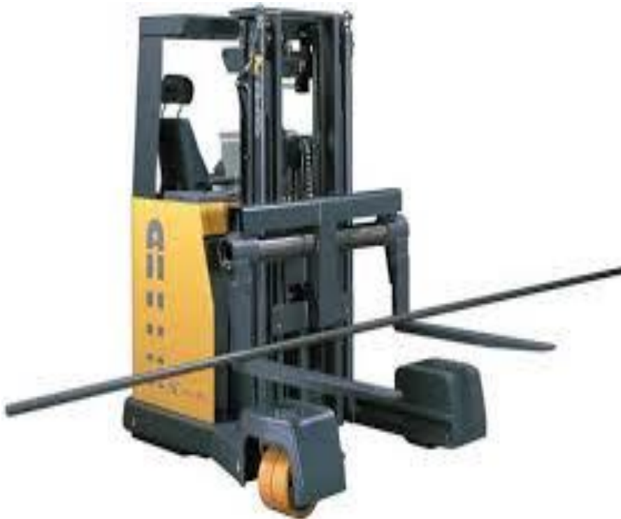
Slika 10. Četverostrani viličar