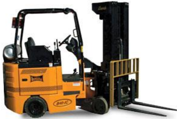
Slika 14. Viličar sa zakretnim jarbolom