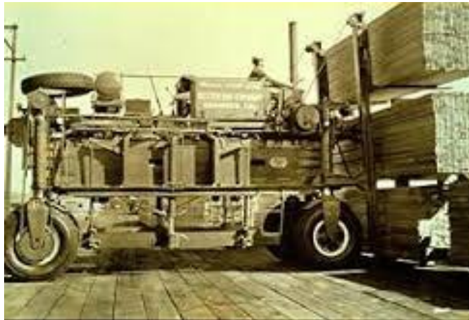
Slika 1. Drveni vagoni