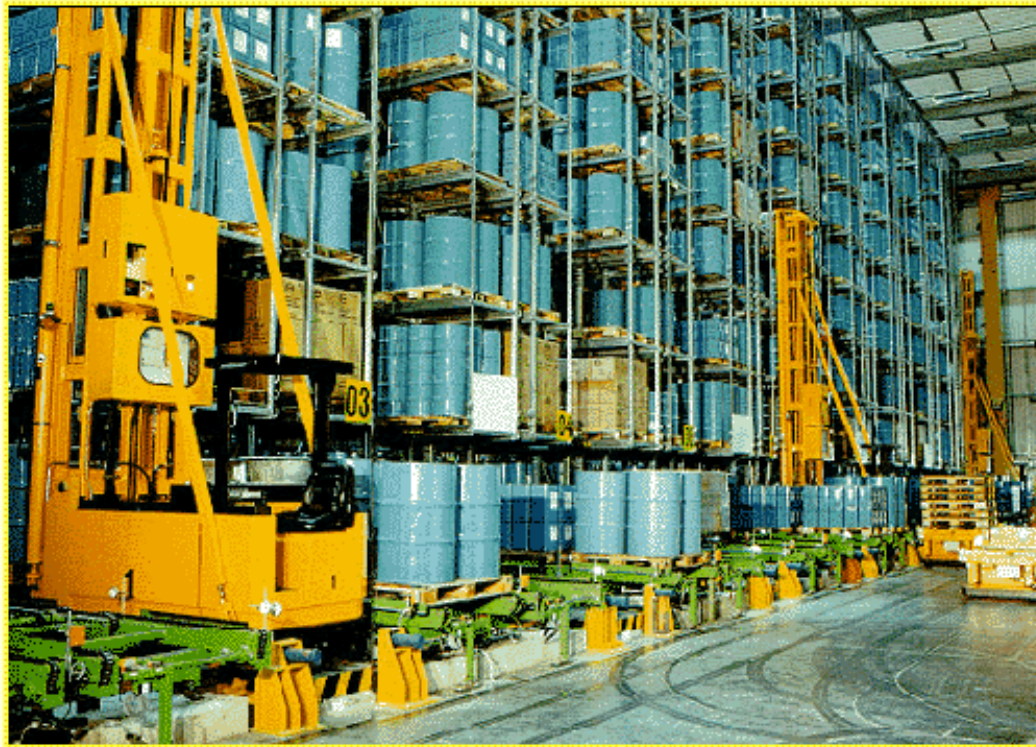
Slika 18. AGV viličari u skladištima

Izvor: http://www.pmh-co.com/ , 17.03.2016.