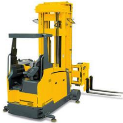
Slika 12. Viličar sa zakretnim vilicama