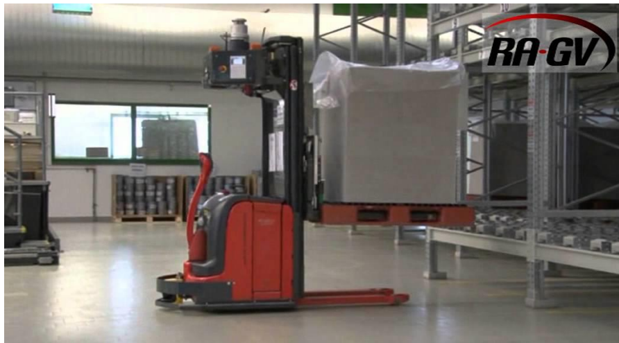
Slika 17. Automatski vođeni viličar