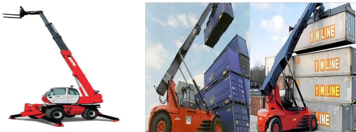
Slika 11. Teleskopski i portalni viličari