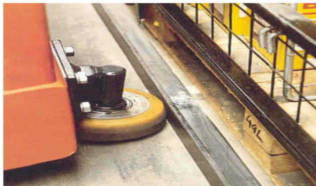
Slika 15. Valjak pomoću kojih su vođeni viličari