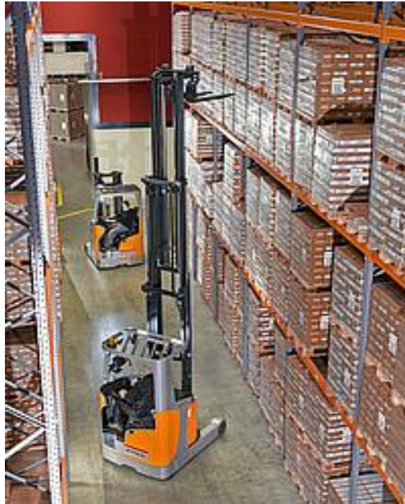
Slika 8. Regalni viličar