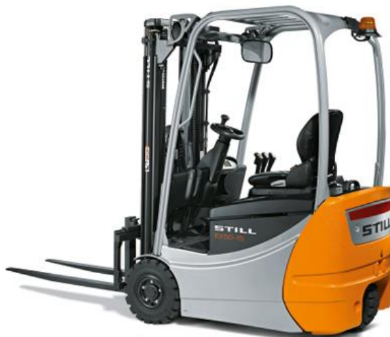
Slika 3. Suvremeni viličar