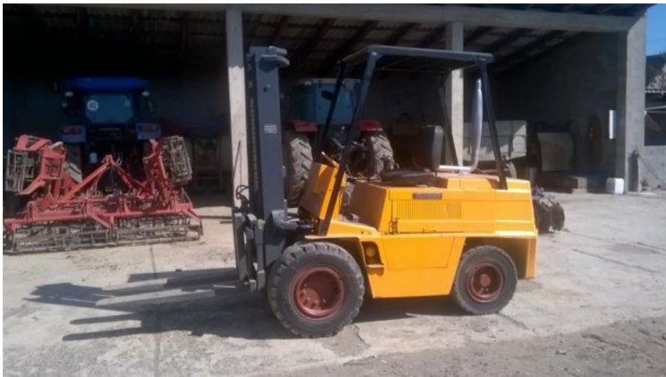
Slika 2. Viličar iz 1960-tih