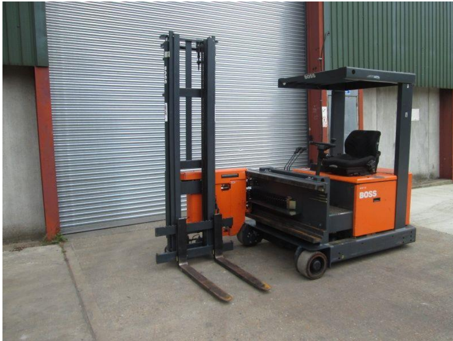
Slika 4. Bočni viličar