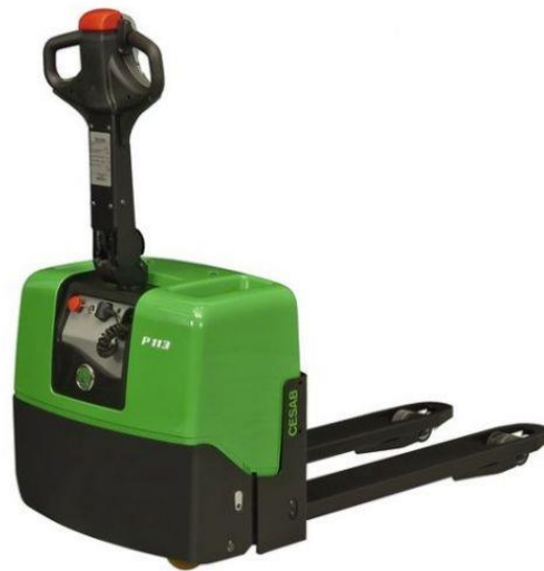
Slika 6. Paletni viličar