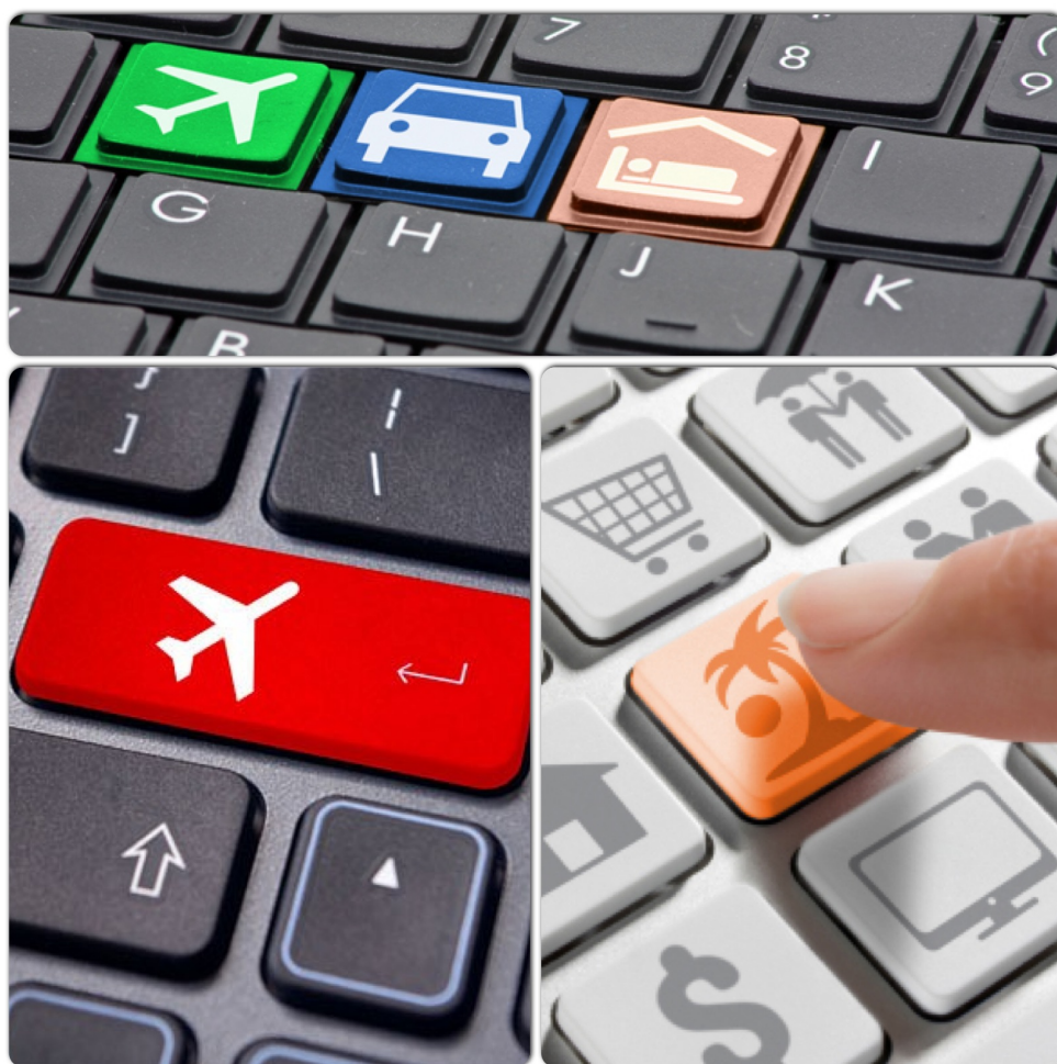
Slika 1. Inovacije na području upravljanja informacijama

prednostima koje ima ovaj način organizacije putovanja kreiranjem sadržajno i cjenovno prihvatljivih proizvoda te plasmanom kojim se jamči pouzdana informacija vezano za proizvode i usluge, na način da se ciljno tržište upozna s pogodnostima i specifičnostima proizvoda, uz dostupnost proizvoda ili njegovih komponenata na učinkovit način, uočene su prednosti koje proizlaze iz primjene suvremenih informacijskih i komunikacijskih tehnologija. One se odnose na obostrane koristi, u odnosu na posrednike i u odnosu na potencijalne turiste.