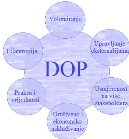
Slika 1. Glavne karakteristike DOP-a.