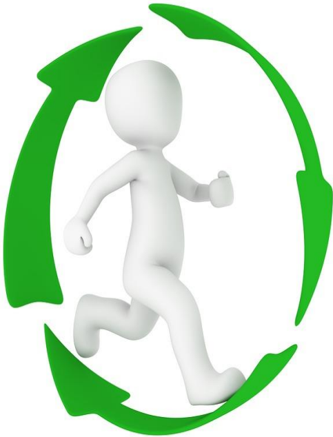
Slika 8: Recikliranje smeća

Aktivnost se sastoji u pokazivanju učenicima odvojeno sakupljanju različitih vrsta otpada iz kućanstva: