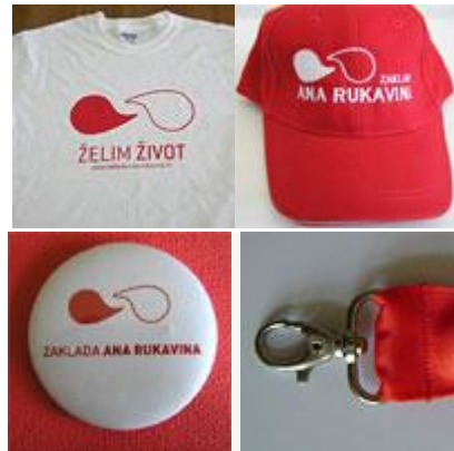
Slika 7. Promotivni artikli i materijali Zaklade Ana Rukavina