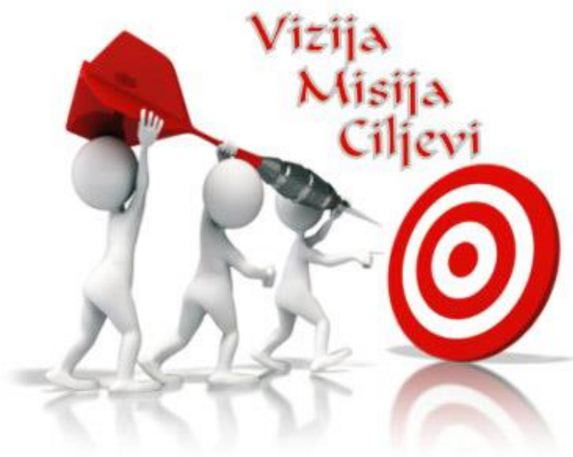
Slika 4. Misija, vizija, ciljevi