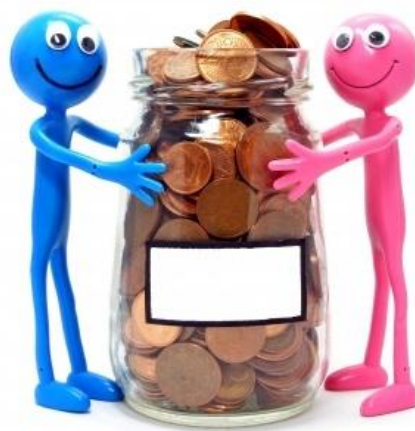
Slika 2. Gospodarska djelatnost udruge

Neprofitna organizacija koja obavlja gospodarsku djelatnost obvezna je voditi dvojno knjigovodstvo, a na kraju poslovne godine, uz financijske izvještaje propisane Pravilnikom o izvještavanju u neprofitnom sektoru i Registru neprofitnih organizacija koje predaje u FINA-u, dostavlja Poreznoj upravi obračun poreza na dobit na obrascu u PD-Prijava poreza na dobit, te uz prijavu prilaže bruto bilancu sa vidljivom analitičkom razradom osnovnih računa i sastavljen Račun dobiti i gubitka.