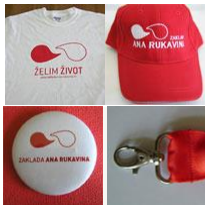
Slika 7. Promotivni artikli i materijali Zaklade Ana Rukavina