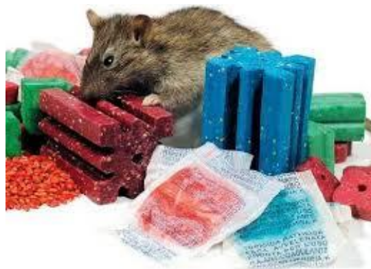
Slika 2. Meke ili mamaci za glodavce