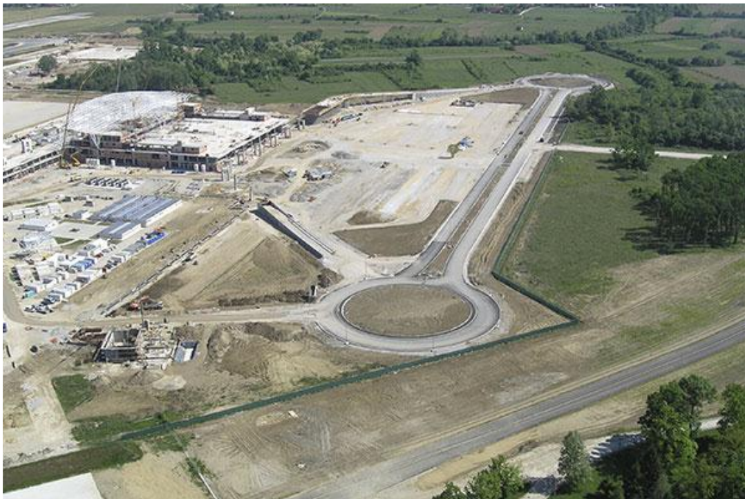
Slika 1. Izgled luke izvana