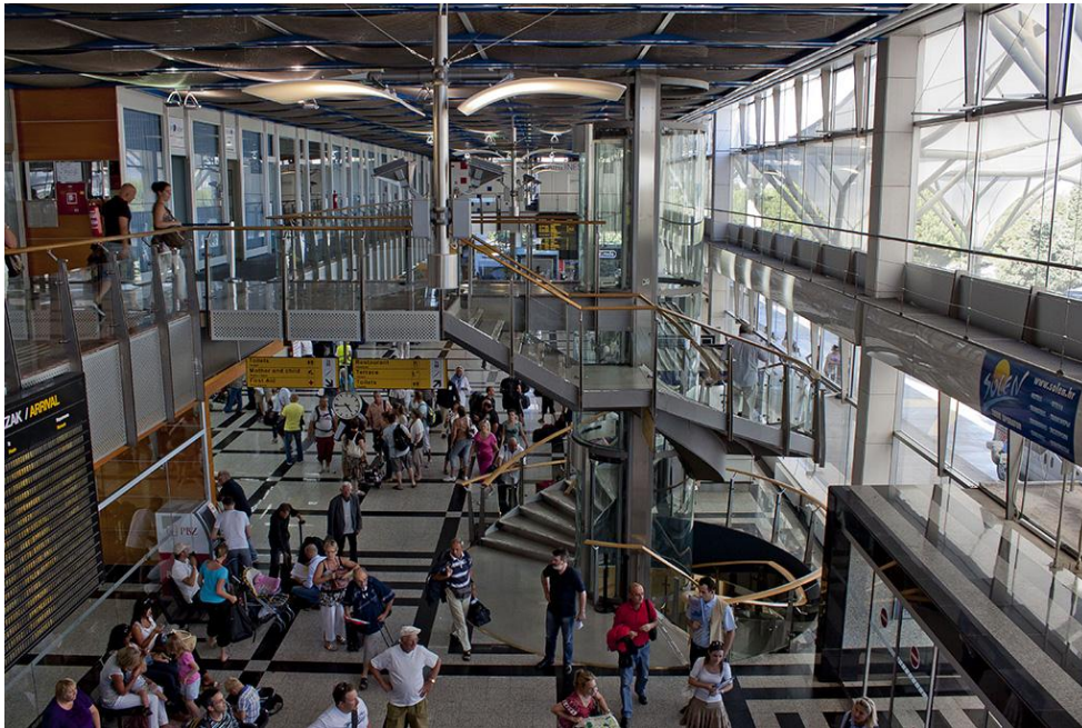
Slika 2. Zračna luka Split iznutra