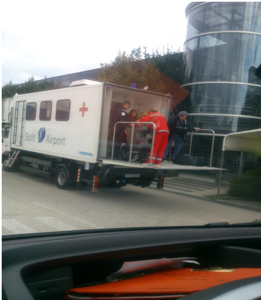
Slika 9. Ambu-lift vozilo

mnogo djelatnika koji su raspoređeni na različitim lokacijama i ne čine nekakvu mrežu ljudi koji moraju raditi usklađeno i prilikom njihovog rada najčešće su u blizini jedan drugog.