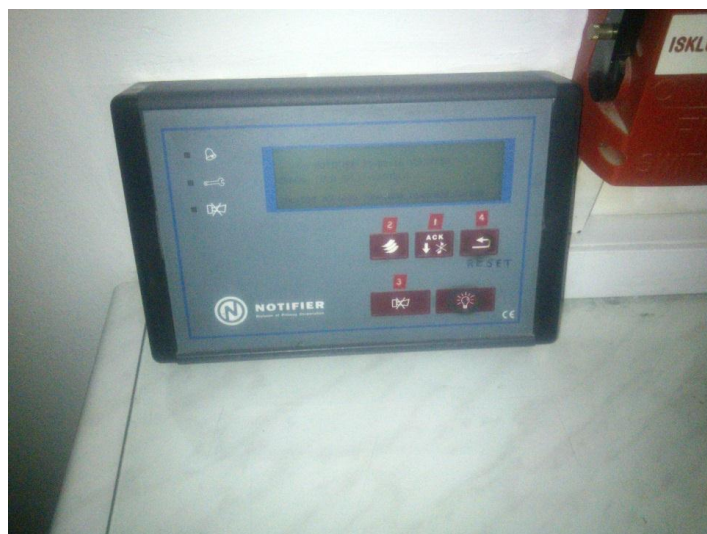
Slika 7. Automatski dojavljivač Notifier 2000

Nakon završetka gašenja, te po sanaciji i pregledu objekta, mrežni napon moguće je uključiti samo po zahtjevu zapovjednika gašenja i to od strane dež. električara na sklopci na GRP. Prije nego se sustav hoće vratiti u punu funkciju, po potrebi izvršiti čišćenje automatskih javljača od strane nadležnog servisa.