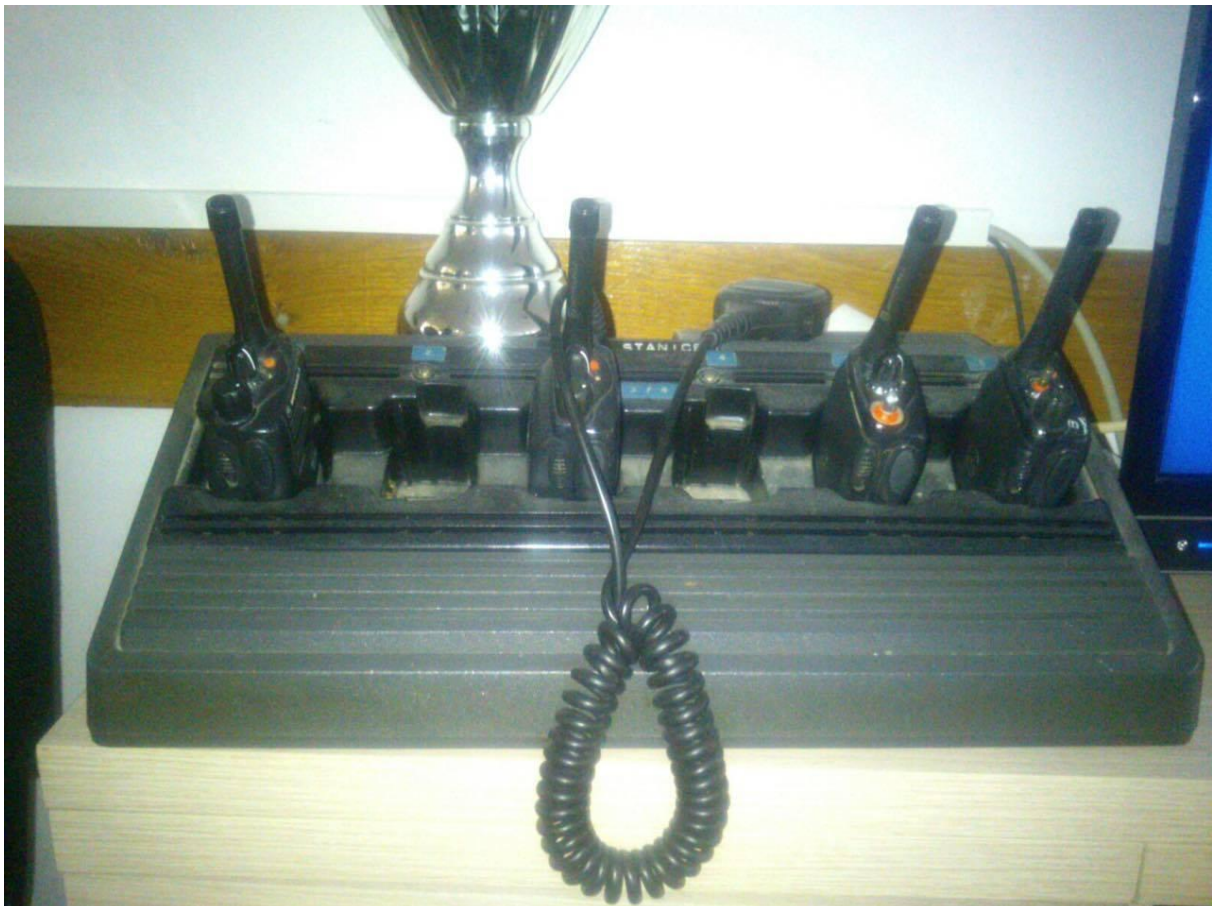
Slika 5. Motorole tijekom punjenja u VP

Zbog topografije (zakrivljenosti), terena i nepostojanja odgovarajućeg repetitora znaju se pojaviti problemi u uspostavljanju i održavanju radio veze između vatrogasne postaje i pojedinih prijenosnih i mobilnih radio stanica. U takvim situacijama treba koristiti mogućnost indirektna komunikacije preko tornja HKZP-a kao najviše točke na području ZLS. Zbog konstrukcije putničke zgrade i prostora ispod nove stajanke u nekim dijelovima istih nije moguće uspostaviti i održavati radio vezu, a to je posebice izraženo u podrumu putničke zgrade. Za uspostavu veze u takvim situacijama treba koristiti telefonsku vezu.