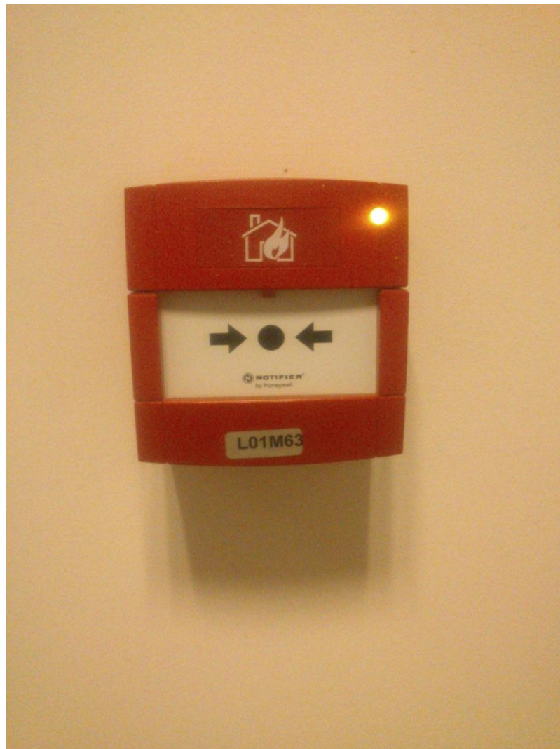
Slika 6. Ručni dojavljivač požara