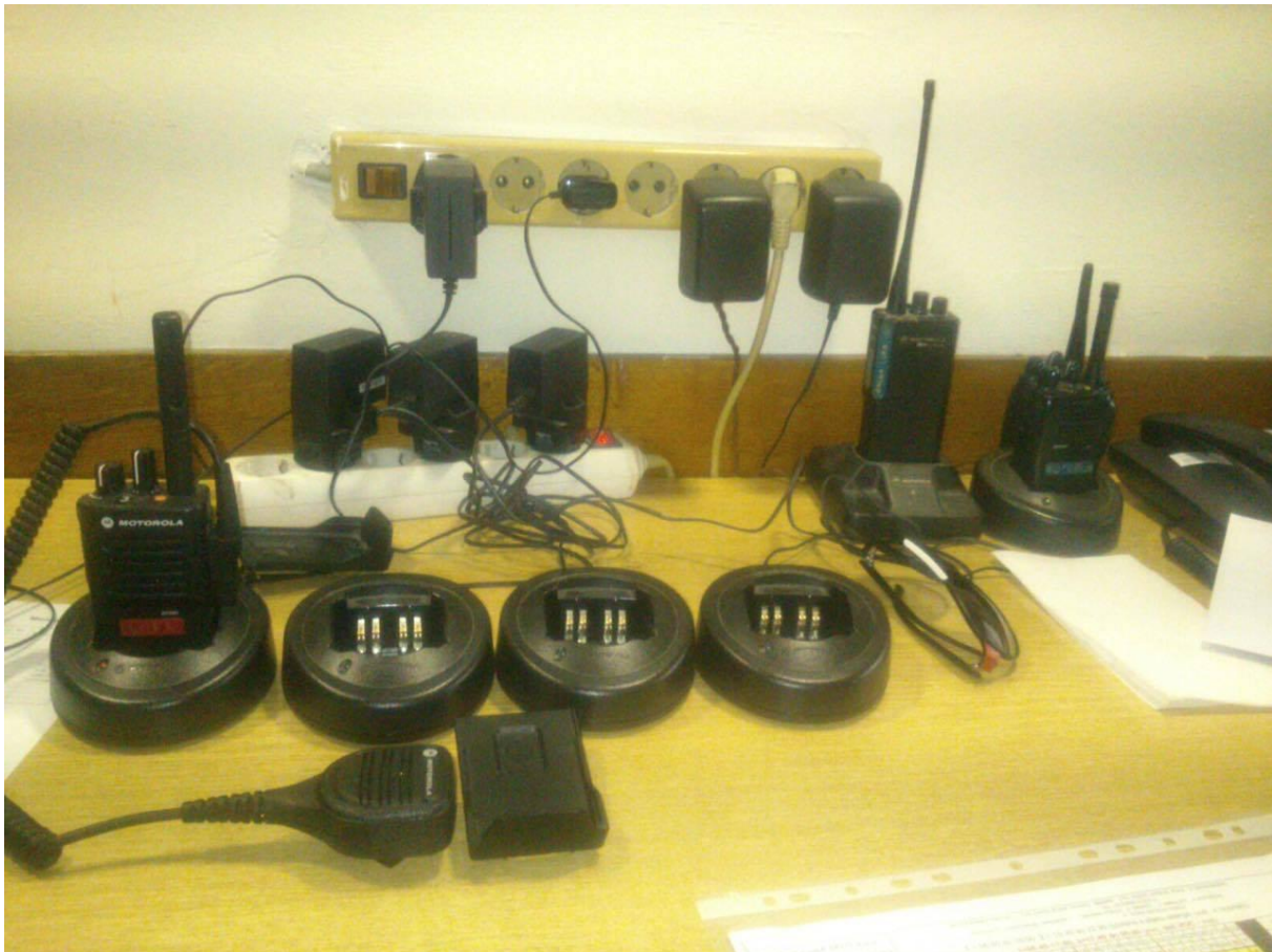
Slika 8. Motorole hitne pomoći

Hitna pomoć na Zračnoj luci komunicira pomoću prijenosnih radiostanica Motorola GP 340 i GP 344 na kanalu broj 1. Komunikacija se vrši i telefonskim putem pomoću skraćenog broja.