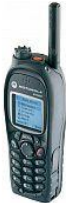
Slika 4. Motorola MTH 800

Vrste uređaja koji se koriste su tetra uređaji. Oni se dijele na prijenosnu MH 800 i neprijenosu MTH 5400 koja se nalazi u vozilima.