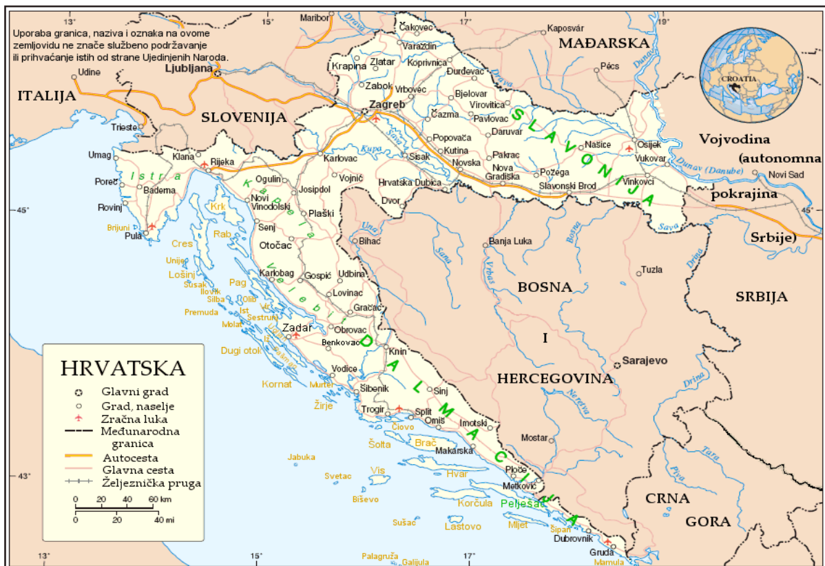
Slika 6. Prikaz državnog područja i granica Republike Hrvatske sa susjednim državama

Temelji se na karti Kartografskoga odsjeka Ujedinjenih Naroda, broj (No.) 3740 izmjena (Rev.) 5. iz 2006.