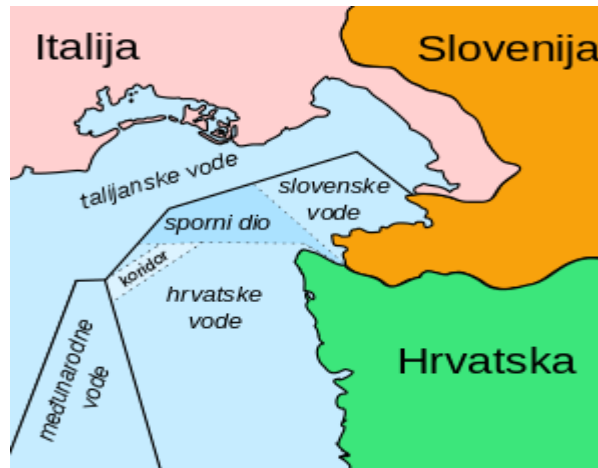
Slika 3. Prikaz graničnog spora između Republike Hrvatske i Slovenije

Ovdje je najbitnije navesti da to samostalno određivanje granice mora biti uređeno obostranim i slobodnim sporazumom, odnosno dogovorom.