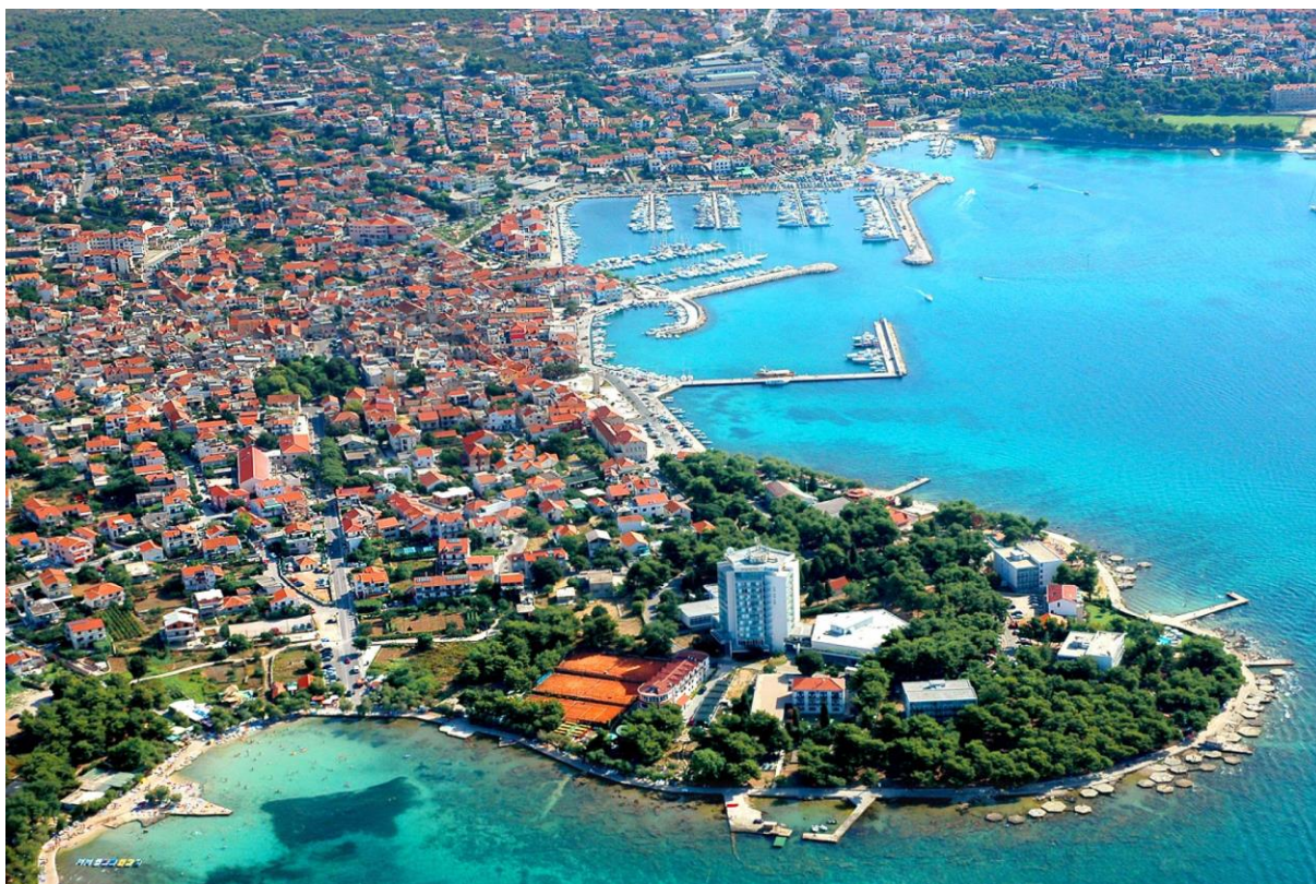
Slika 1: Panorama grada Vodice