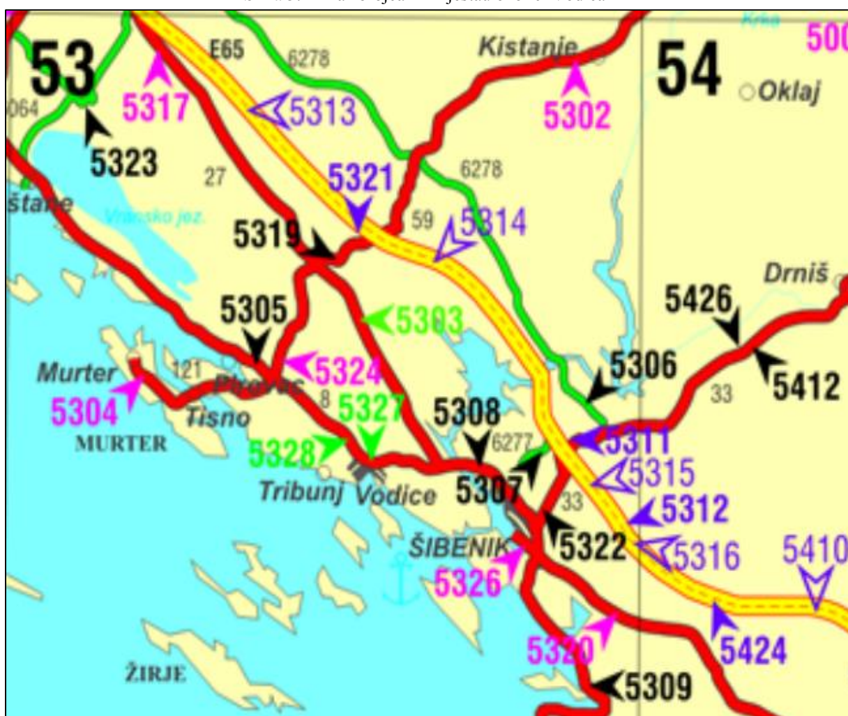
Slika 5: Prikaz brojčanih mjesta u okolini Vodice