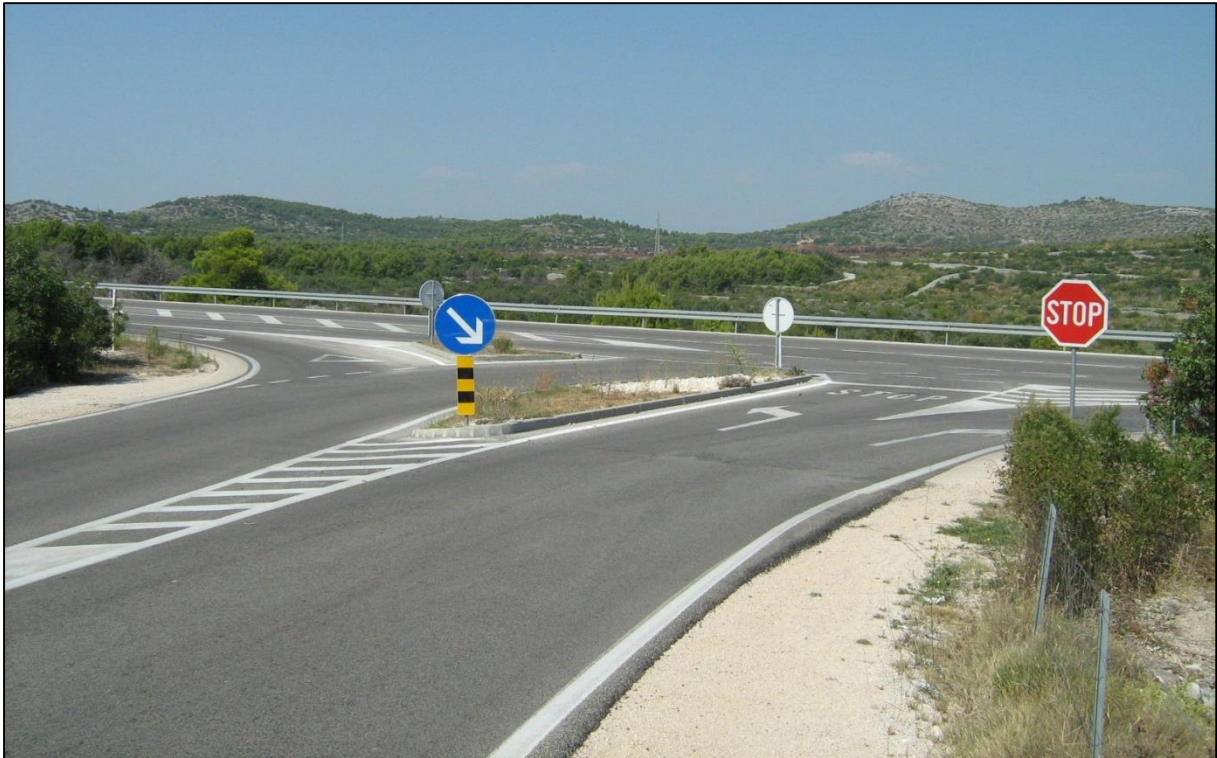
Slika 8: prikaz trokrakog raskrižja