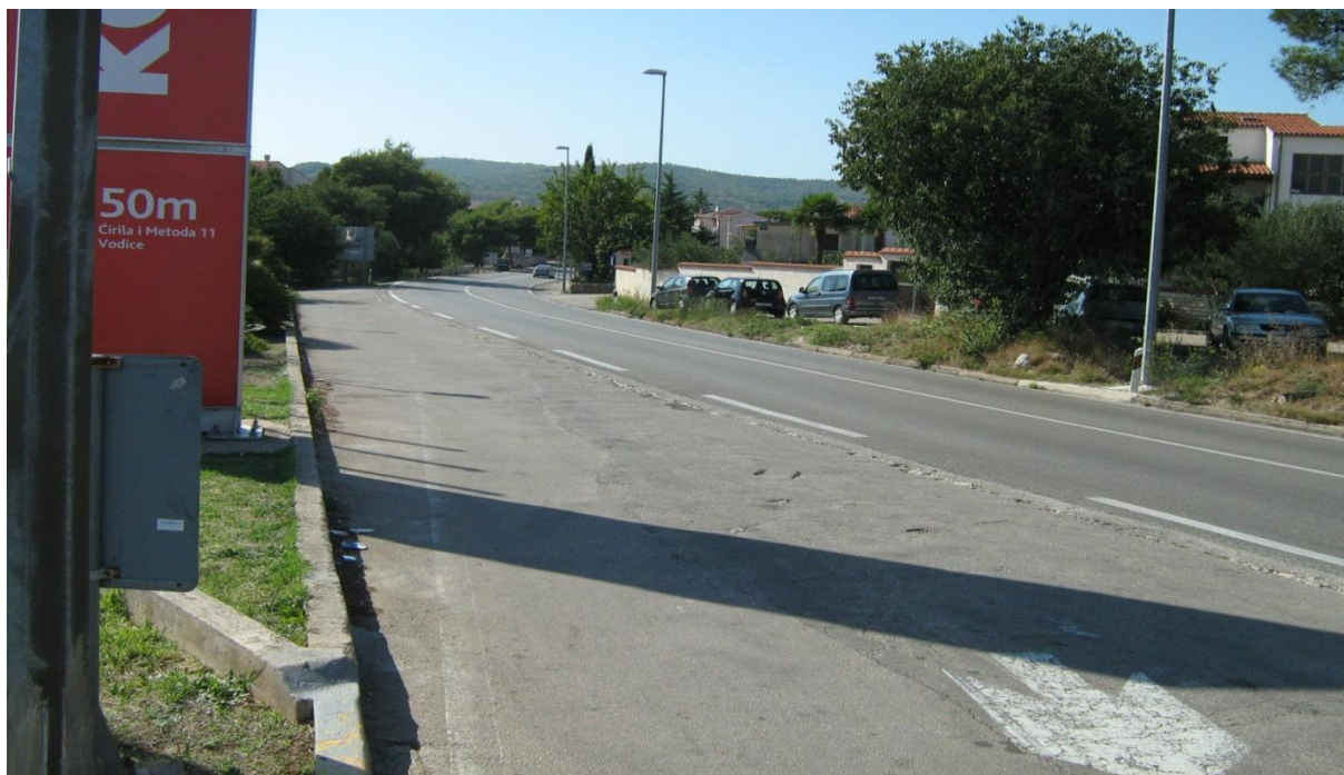
Slika 3: Sadašnja trasa državne ceste 8 kroz Vodice (kod benzinske crpke)