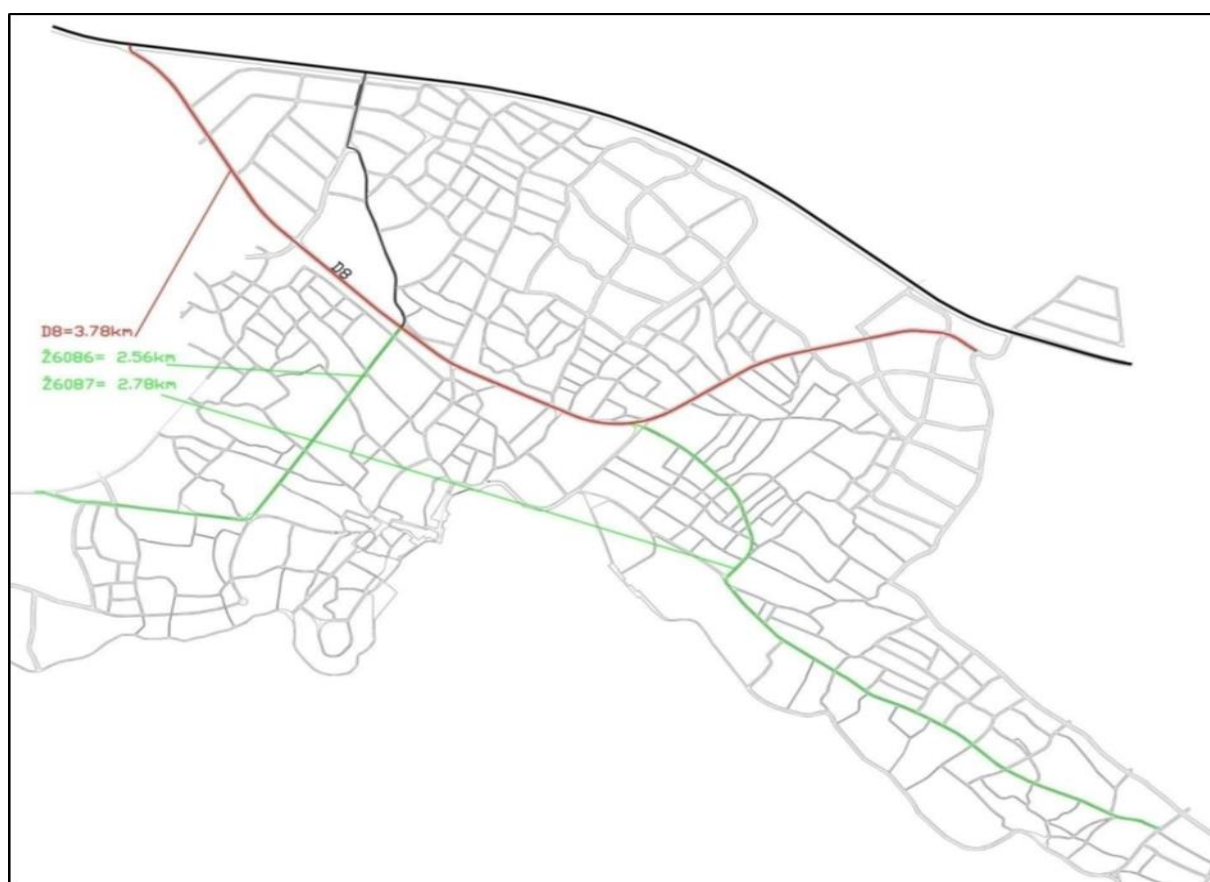
Slika 4: Prometna mreža naselja Vodice