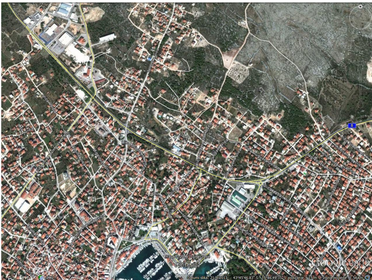
Slika 2: sadašnja trasa državne ceste 8 kroz Vodice

Grad Vodice se nalazi 12 km sjeverozapadno od Šibenika, sjedišta Šibensko-kninske županije. Grad se nalazi unutar značajnijih županijskih i državnih tranzitnih koridora, te zbog toga tranzitni promet uvelike opterećuje cjelokupni gradski prometni sustav. Kroz naselje prolaze Državna cesta 8, te županijske ceste ŽC6086 (Ulica Lasana Ante Kabalere –Put Vatroslava Lisinskog – Srma I) i ŽC6087 (Ulica Put Gaćeleza – Prve Primorske Čete – Gurgurev Ante Kukure). Državna cesta 8 još se naziva „Jadranska magistrala“, ona se proteže kroz cijeli Hrvatski jadransko od granice sa Slovenijom (GP Pasjak) do granice s Crnom Gorom (GP Karasovići). Cesta je izgrađena tijekom 1950-tih i 1960-tih godina. Od važnijih cesta koje prolaze kroz područje grada su autocesta A1 (čvor Pirovac), državna cesta 27, županijska cesta 6071. Za vrijeme izgradnje državna cesta 8 prolazila je periferijom naselja. Kako se naselje širilo, cesta danas prolazi kroz samo naselje (slika 2 i 3, cesta je označena žutom bojom).