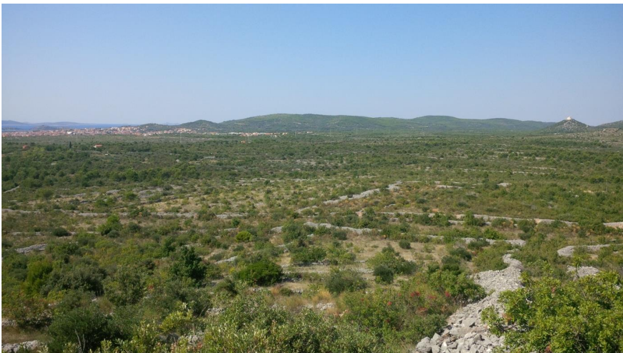
Slika 6: prikaz terena obilaznice

Tlo na terenu obilaznice je uglavnom vrlo stjenovito, vrlo mrvičaste strukture, crvenkasto smeđe boje, no ima i koluvijalnih nanosa te ispranih, svijetlih tla. Na većem dijelu trase prevladavaju kamenjari, antropogena tla u kršu i antropogena tla fliških i krških sinklinala i koluvija. Područje obilaznice ima vrlo slabu hidrogeološku mrežu što je posljedica geološke građe. Zbog široke raširenosti karbonatskih naslaga, oborine koje padnu vrlo brzo ulaze u podzemlje. Podzemnim pukotinskim sustavima otječu uglavnom prema moru na jugu i rijeci Krki na jugoistoku. Od vodenih površina na području obilaznice, osim rijeke Krke koja se pojavljuje u istočnom dijelu područja nalazi se povremeni tok koji protječe smjerom sjever-jug i utječe u more između Tribunja i Vodica. Na istaraživanom području nalazi se još nekoliko mjesta gdje se voda zadržavala, kao što su Srimarske lokve, te jedna između stanova Jurica i Čokića.