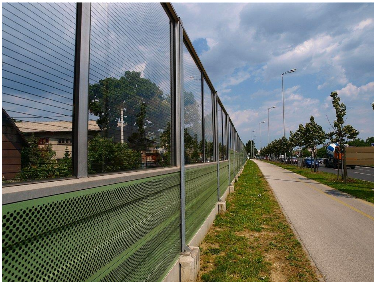
Slika 9: primjer bukobrana