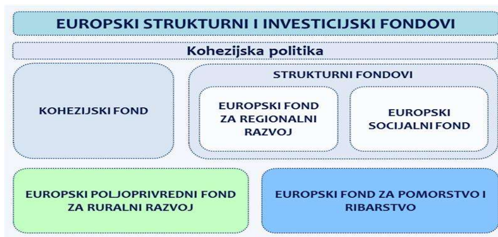
Slika 1: Europski strukturni i investicijski fondovi

U financijskom razdoblju 2014.-2020. Republici Hrvatskoj je iz Europskih strukturnih i investicijskih (ESI) fondova bilo dostupno ukupno 10,731 milijardi eura. Od tog iznosa, 8,452 milijarde eura bilo je namijenjeno ciljevima kohezijske politike, 2,026 milijarde eura za poljoprivredu i ruralni razvoj te 253 milijuna eura za razvoj ribarstva.