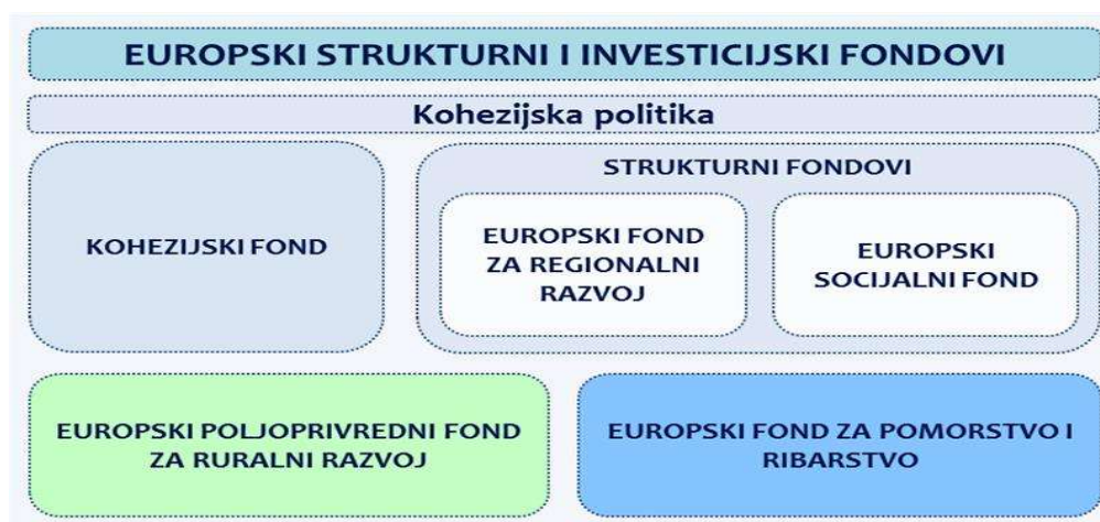
Slika 1: Europski strukturni i investicijski fondovi

U financijskom razdoblju 2014.-2020. Republici Hrvatskoj je iz Europskih strukturnih i investicijskih (ESI) fondova bilo dostupno ukupno 10,731 milijardi eura. Od tog iznosa, 8,452 milijarde eura bilo je namijenjeno ciljevima kohezijske politike, 2,026 milijarde eura za poljoprivredu i ruralni razvoj te 253 milijuna eura za razvoj ribarstva.