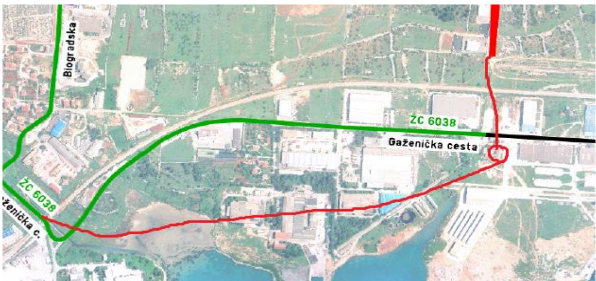
Slika 20: Položaj nove ceste u Luci Gaženica

Izvor: Autorica rada prema Hrvatske ceste d.o.o.