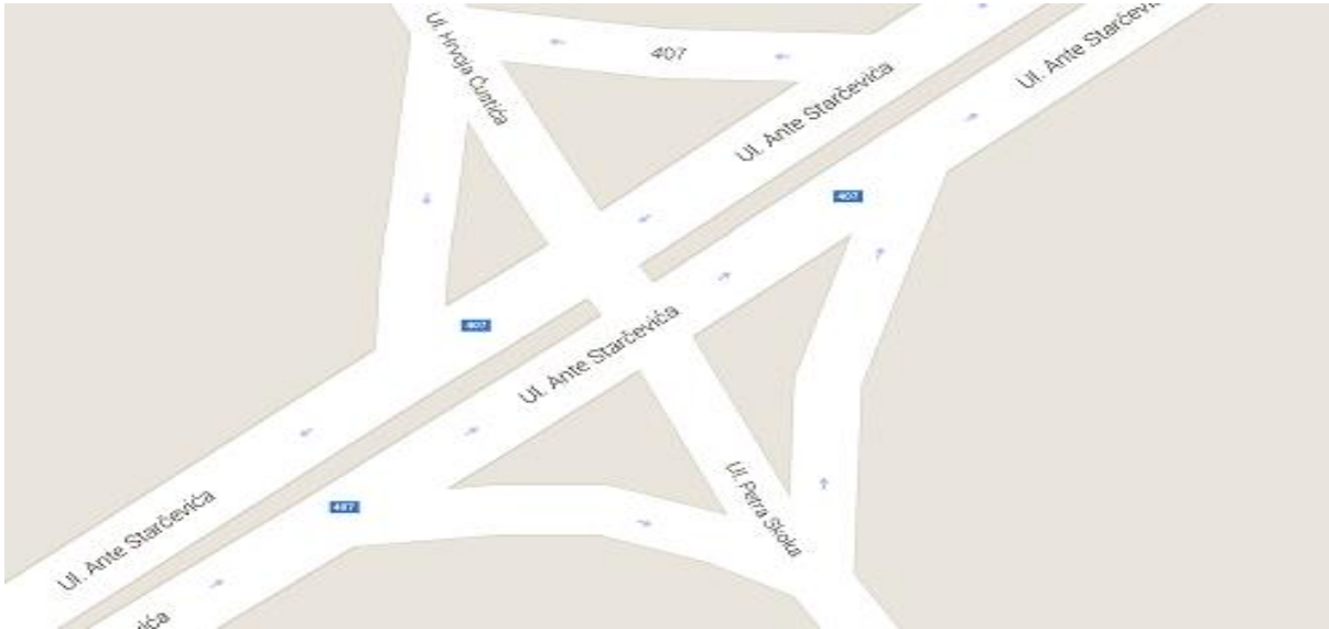
Slika 5: Raskrižje Starčevićeve sa gradskom ulicom Petra Skoka i Hrvoja Ćustića