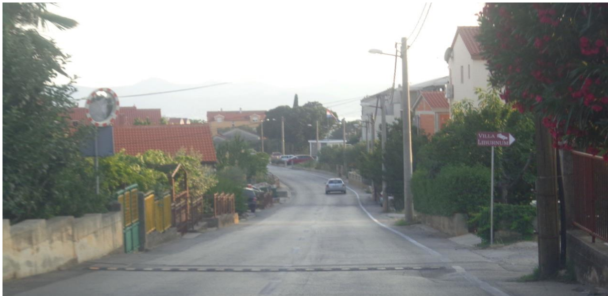
Slika 9: Put Plovanije

Put Plovanije ima postavljenu rasvjetu samo s jedne strane, i dva smjera od kojih svaki ima po jednu prometnu traku (slika 9). Horizontalna signalizacija je slabo vidljiva.