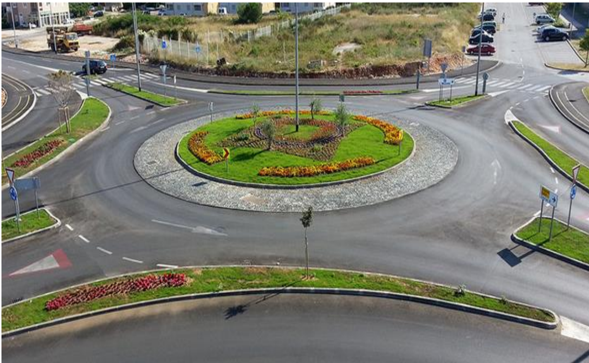
Slika 22: Kružno raskrižje na novoj prometnici