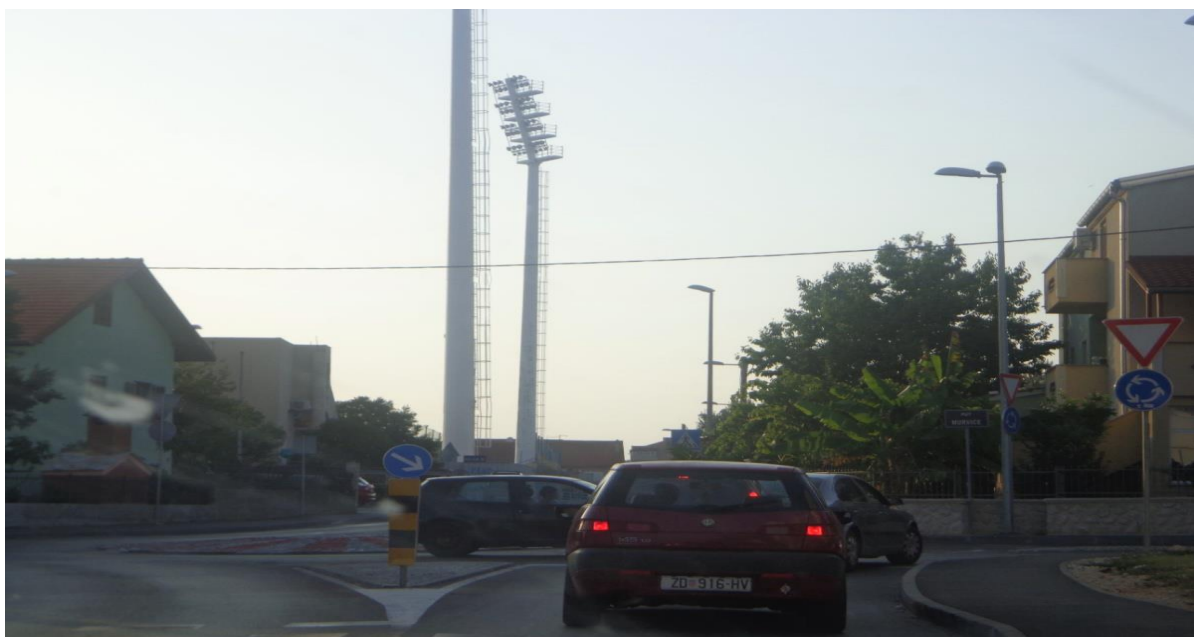
Slika 17: Raskrižje Ćustićeve s Put Murvice (rasterećenje ulice dr. Franje Tuđmana)

Iz priložene slike se vidi da je usmjeravanje prometa odvojeno u više prometnih trakova, odnosno ne izgleda kao raskrižje koje je nedovoljno za veći grad poput Zadra. U ulica dr. Franje Tuđmana je zbog velikog kapaciteta prometa koji gravitira na ovu gradsku prometnicu stanje je takvo. ŽC 6015 (Benka Benkovića, Oreškovićeve, Stadionska, Ćustićeva), sabire promet iz pristupnih ulica te pomaže rasterećenju ulice dr. Franje Tuđmana sa kojom je paralelna, i odvozi ga prema D407 na ulicu Ante Starčevića (slika 17).