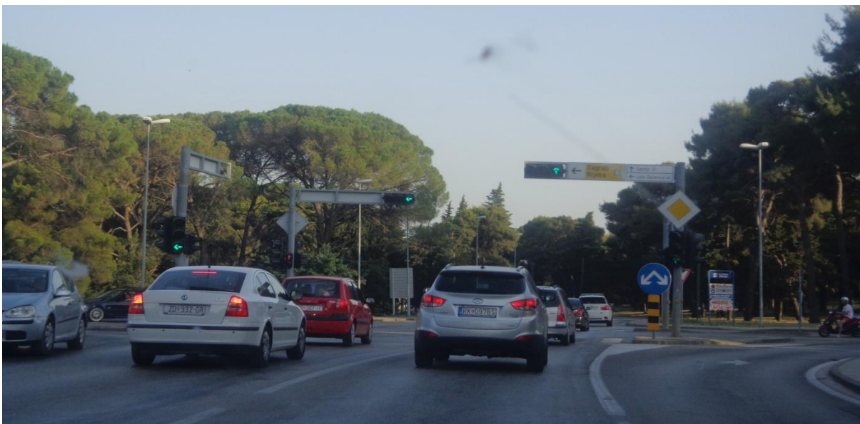
Slika 12: Ulica Hrvatskog Sabora

Ulica Hrvatskog Sabora (označena je kao D306) križa se sa ulicom Ante Starčevića i Zagrebačkom ulicom, a počinje na raskrižju sa Putom Nina te ulicom Matije Gupca koja dolazi iz turističke zone grada. Ona je najduža ulica u gradu Zadru sa svojih 4,5 km. Jednosmjerna je ulica sa dva prometna traka. S objiju strana prometnice nalazi se zelena površina s drvoredom te nogostupi. Prometnica posjeduje autobusna ugibališta. Rasvjetna tijela su postavljena obostrano duž cijele ulice (slika 12).