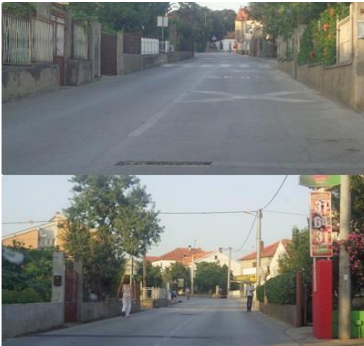
Slika 11: Put Stanova