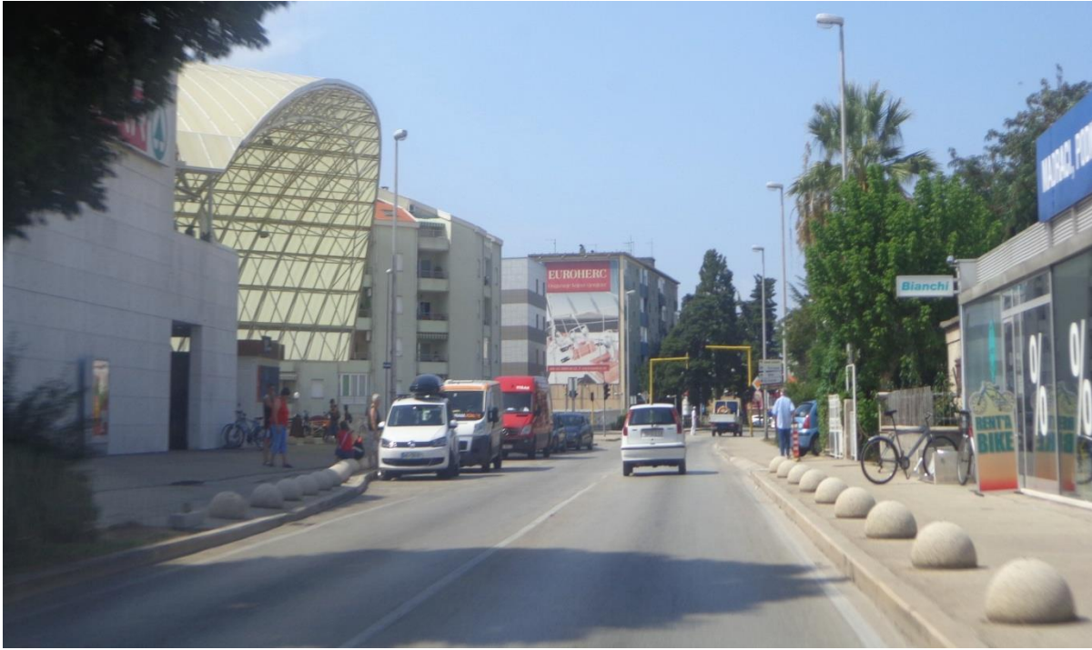
Slika 14: Ulica dr.Franje Tuđmana

Murvice, spaja se na Starčevićevu, nadovezuje se sa Biogradskom cestom te takom sabire gradski i prigradski promet te ga usmjerava na izvangradske prometnice preko D8.