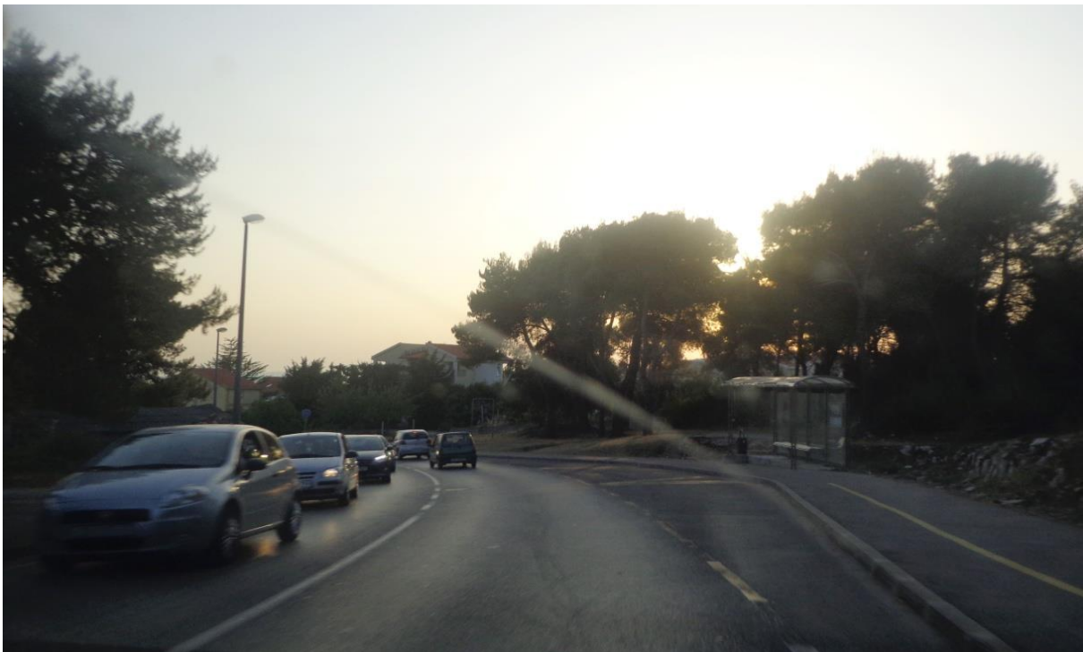
Slika 8: Ulica Matije Gupca

Ulica Matije Gupca (slika 8) je pristup iz turističke zone Borik prema D306 odnosno izlazu, prema centru preko Obale Kneza Trpimira (jednosmjerna), te prema ŽC 6015 (Put Nina, Tuđmanova) prema centru i prema D407. Svaki smjer ima jedan prometni trak. S obje strane prometnice nalaze se nogostupi, ulica posjeduje obilježenu biciklističku stazu, a ugibalište autobusne postaje ne ometa ostatak prometa jer se nalazi iza raskrižja.