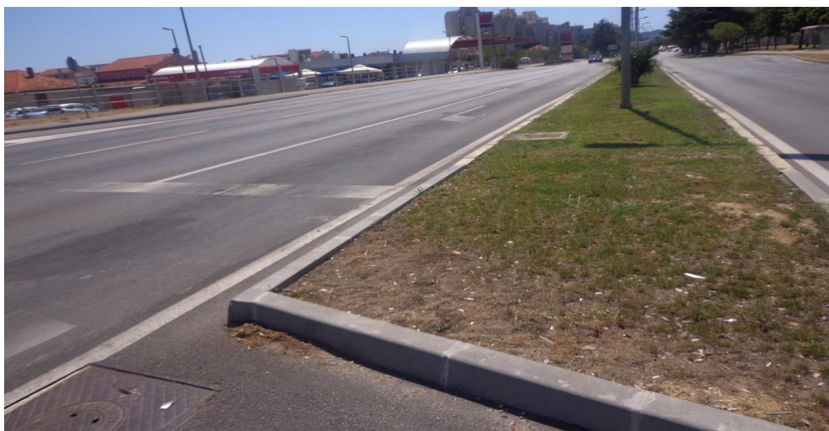
Slika 7: Lijevo skretanje sa Starčevićeve

Lijeva skretanja na Starčevićевой odvojena su prometnim trakovima za skretanje u lijevo, te se prolaz regulira prema lijevim skretanjima na zelenom valu, odnosno odvojeno od prometa iz suprotnog smjera, što prikazuje sljedeća slika (slika 7).