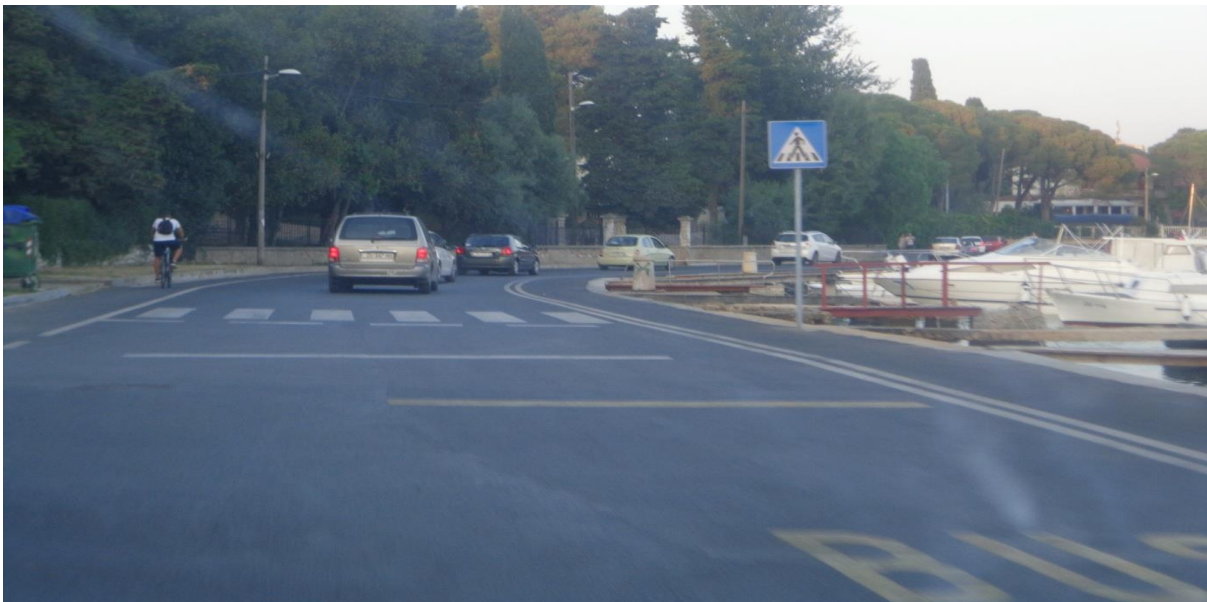
Slika 13: Obala Kneza Trpimira

Obala Kneza Trpimira jednosmjerna je ulica koja se proteže od križanja sa Obalom Kneza Domagoja do križanja sa Ulicom Ivana Meštovića. Ona promet iz turističke zone te stambenih četvrti Diklo, Puntamika, Borik, Špada i Maraska Park vodi ka centru i Tuđmanovoj ulici. Horizontalnom i vertikalnom signalizacijom je prometnica dobro opremljena. Novouređena je ulica koja ne posjeduje nogostupe ni autobusna ugibališta već se autobusi zaustavljaju uz krajnji desni rub koji je pravilno obilježen žutom horizontalnom signalizacijom (slika 13) i prometnim znakom.