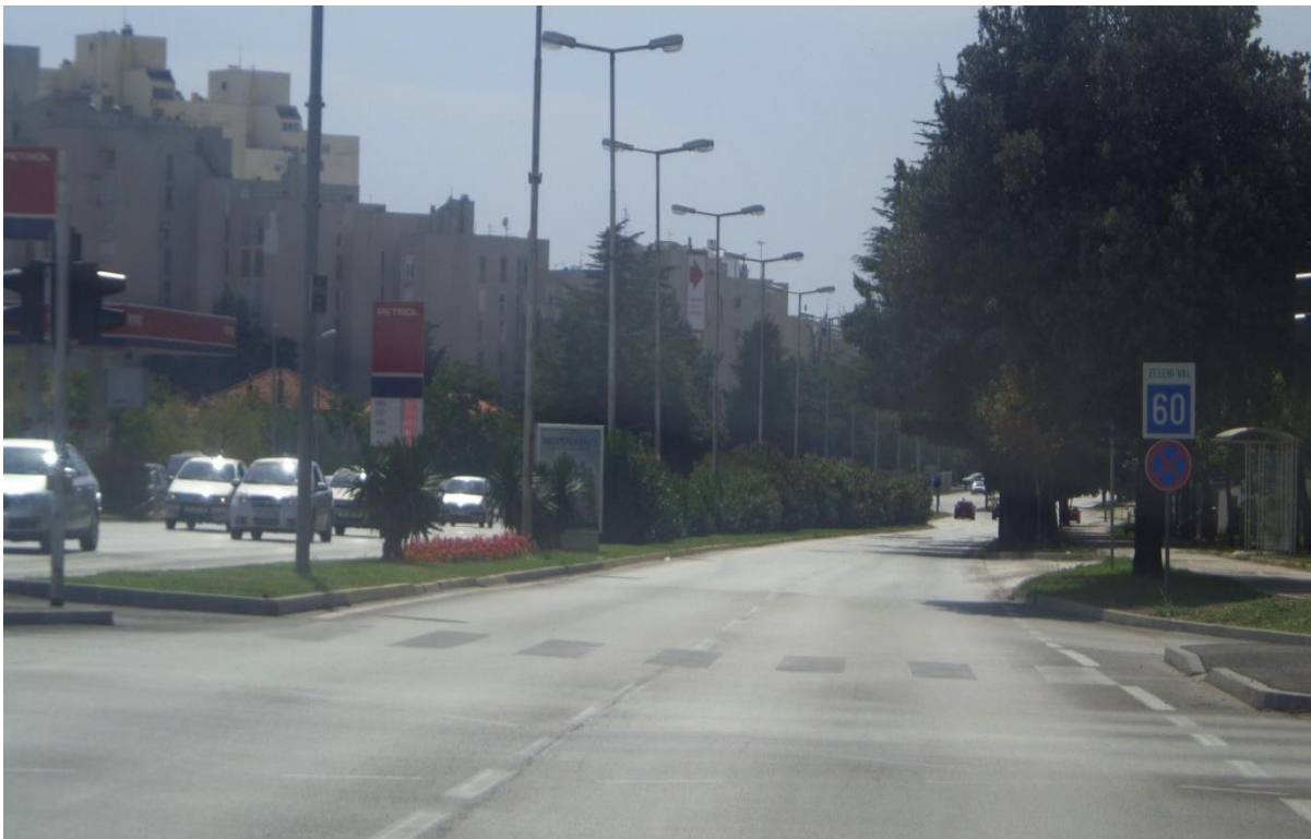
Slika 4: Ulica Ante Starčevića

Ulica Ante Starčevića (označena je kao D407) je gradska avenija u Gradu Zadru, koja je zajedno sa Zagrebačkom ulicom opremljena „zelenim valom“, odnosno semaforiziranim raskrižjima koja su regulirana automatskim vođenjem prometa. Zeleni val, odnosno prolaznost raskrižjima projektirana je na brzinu od 60 km/h (slika 4). Duljine je 2,2 km.