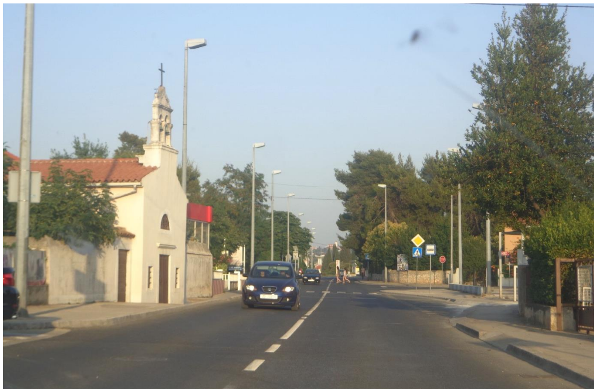
Slika 18: Ulica Franka Lisice