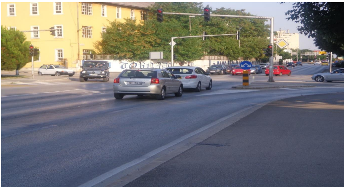
Slika 16: Raskrižje Tuđmanove s Put Murvice

Na slici 16 je prikazano raskrižje na kojem je stupanj zasićenja veći od 1, traje oko 6 sati kroz cijelu godinu radnim danima (u oba smjera), te u ljetnim mjesecima se to trajanje zasićenja penje i na 9-11 sati.