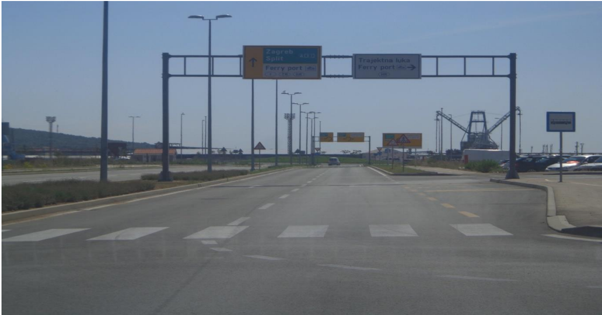
Slika 19: Nova brza gradska cesta u Luci Gaženica