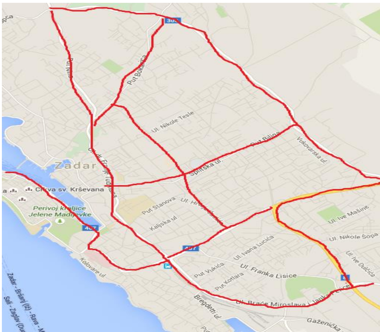
Slika 2: Skica ulica primarne mreže Grada Zadra