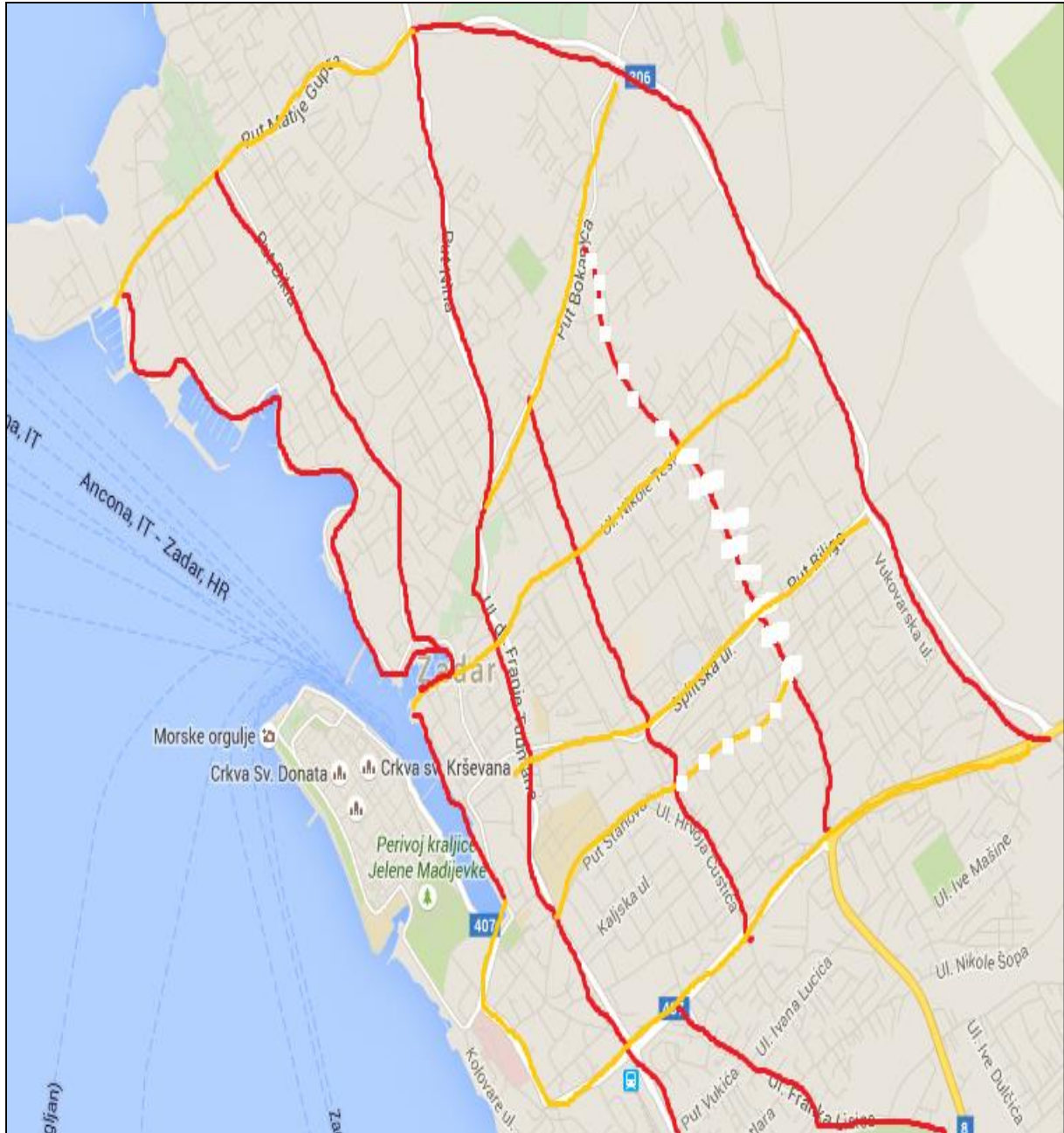
Slika 1: Skica prostorne podjele ulica grada Zadra (uzdužne i poprečne ulice)