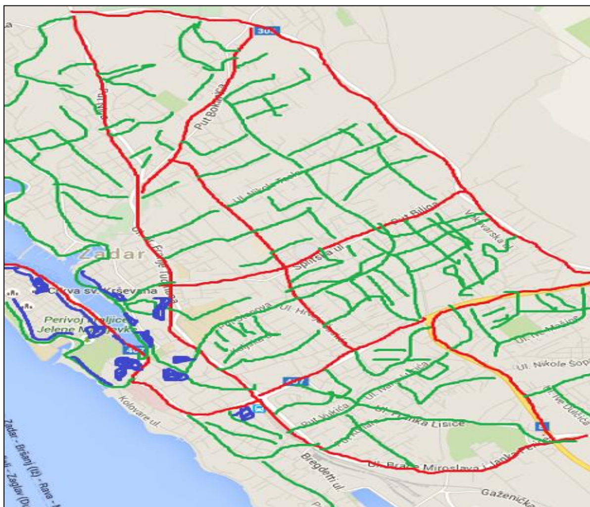
Slika 3: Skica sekundarne gradske mreže u Gradu Zadru sa primarnom mrežom