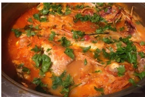
Slika 3. Brudet

Primorska Hrvatska, koja uključuje Istru, Kvarner i Dalmaciju, ima osebujnu mediteransku kuhinju. Regiju karakterizira blaga klima i obilje plodova mora, povrća i maslinovog ulja koji čine temelj prehrane. Međutim, unutar same primorske Hrvatske postoje značajne razlike u kulinarskim tradicijama između obalnog, otočnog i zagorskog područja Dalmacije (Barbieri, 2007). Zbog svoje povijesne povezanosti s Mediteranom, kuhinja hrvatskog priobalja bila je pod velikim utjecajem talijanske i venecijanske kulinarske tradicije. Mlečani su ostavili neizbrisiv trag u kuhinji Istre i Dalmacije, donijevši sa sobom tehnike pripreme plodova mora, korištenje maslinova ulja, vina i začina poput ružmarina i lovora. Povijesne veze s Grčkom također postoje, posebice u Dalmaciji, gdje su masline, smokve i vino od davnina bili glavni sastojci prehrane, a jadranska obala bila je glavna trgovačka ruta koja je dopuštala uvoz začina i drugih egzotičnih namirnica (Barbieri, 2007). Primorska Dalmacija, koja se proteže od Zadra do Dubrovnika, ima prepoznatljivu mediteransku kuhinju s naglaskom na svježim plodovima mora, ribi i povrću. Riba se često priprema na roštilju, kuhana ili poširana u vodi s minimalnim začinjavanjem, uz dodatak maslinova ulja, češnjaka i peršina. Brudet (Slika 3.) je vrlo poznato dalmatinsko riblje jelo od nekoliko vrsta ribe, kuhano u umaku od rajčice, vina i začina. Poslužuje se s palentom kao jedno je od najtipičnijih jela primorske Dalmacije (Barbieri, 2007).