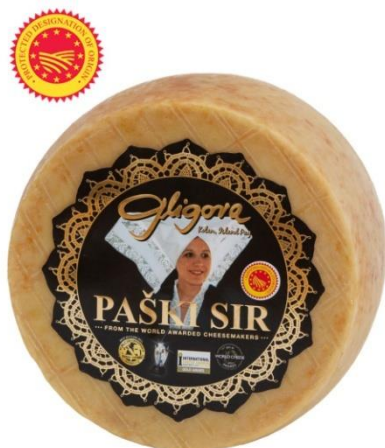
Slika 6. Paški sir