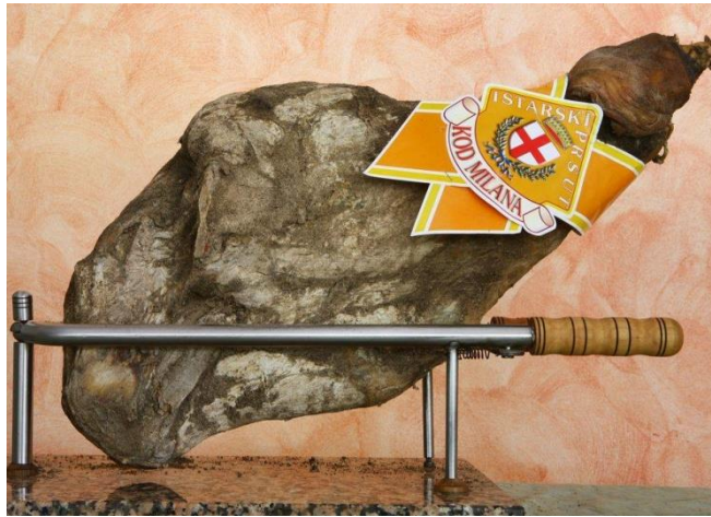
Slika 5. Istarski pršut

Istarski pršut , koji je zaštićen oznakom ZOI, još je jedan primjer proizvoda koji igra važnu ulogu u očuvanju tradicionalnih metoda proizvodnje. Ovaj pršut se suši na zraku, bez dimljenja, i karakterizira ga poseban okus koji se dobiva dugotrajnim sušenjem na bura vjetru. Istarski pršut je nezaobilazan dio istarske gastronomske ponude i redovito se promovira na lokalnim sajmovima i festivalima (Vitez, 2020).