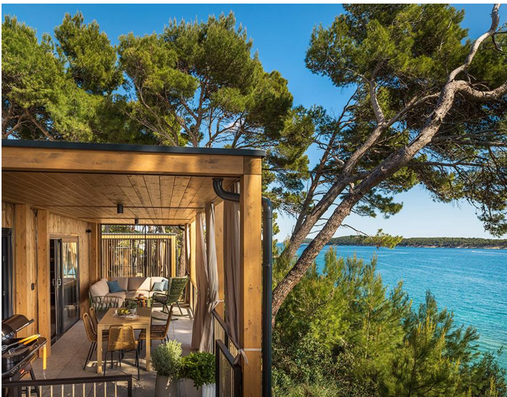
Slika 5. Padova Premium Camping