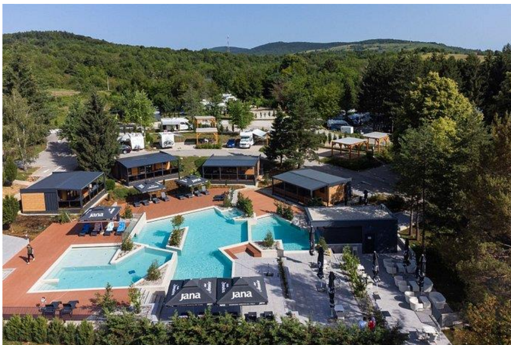
Slika 7. Plitvice Holiday Resort