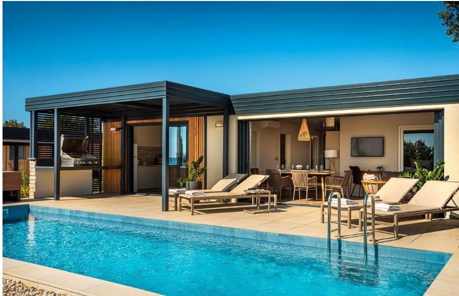
Slika 11. Istra Premium Camping Resort

glamping u mobilnim kućicama te Sunset Glamping Village namijenjeno za glamping unutar šatora. (Valamar camping, 2024)