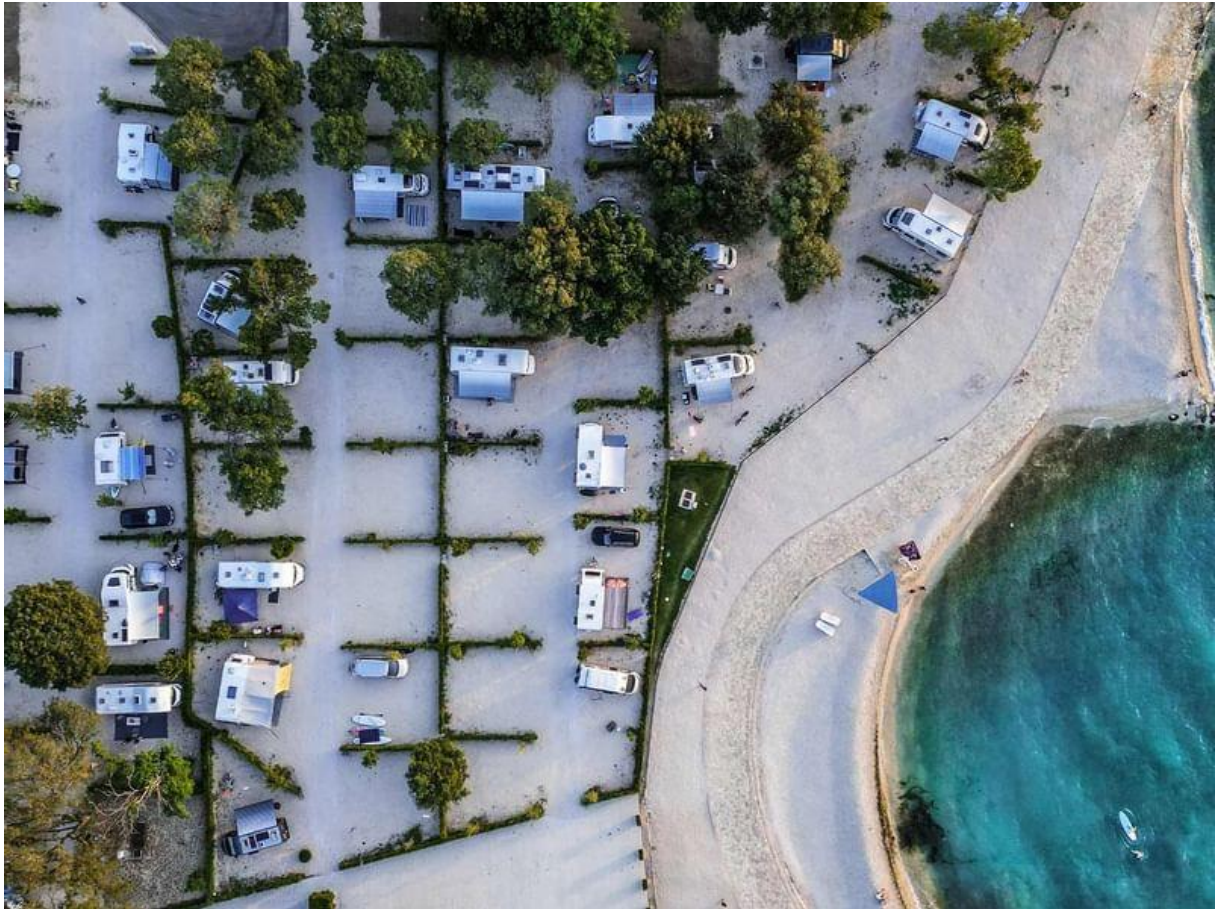
Slika 8. Falkensteiner Premium Camping Zadar

Kada govorimo o bavljenju sportom i rekreacijom, ili samo o provođenju kvalitetnog slobodnog vremena, Falkensteiner kamp ime jako dobru i veliku ponudu. Korisnicima usluga su tako u ponudi: otvoreni bazen, otvoreni grijani bazen, otvoreni dječji bazen, vodeni park, wellness, sauna, masaže, razne animacije za djecu i odrasle, dječja igrališta, teniski tereni i škola tenisa, odbojka na pijesku, stolni tenis, fitness, najam bicikli, najam čamaca i ronjenje. Od ostalih ponuda tu su prostor za društvene aktivnosti, disko, plaža za osobe s invaliditetom, plaža za pse, ambulanta, bankomati i ostalo. (Camping, 2024)