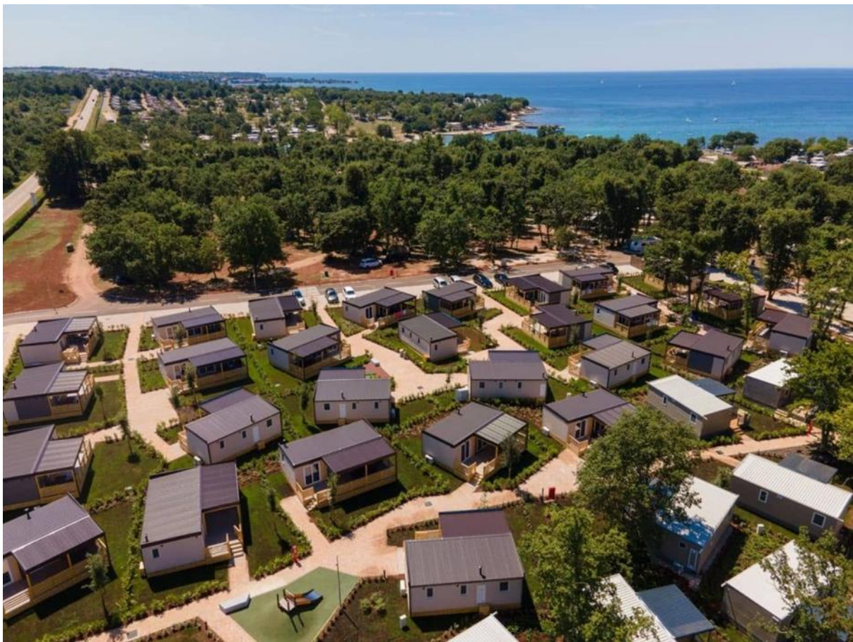
Slika 2. Kamp park Umag

Riječ “kamp” ima latinsko porijeklo (campus) i označava otvoren prostor. Izraz se pojavljuje u više jezika kao na primjer engleski (camp), njemački (kamp), francuski (camp), talijanski (campo), španjolski (campana) i drugi. U hrvatskom jeziku riječ kamp doslovno je prevedena kao logor ili logorovati, provoditi vrijeme u prirodi, pod vedrim nebom. Prema Encyclopedia Britannica, riječ “kamp” definirana je kao rekreacijsko - obrazovni smještaji koji spaja prirodu i život na otvorenom. (Bonifačić, 2011)