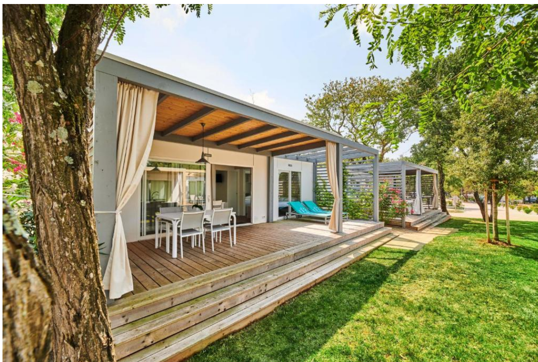
Slika 10. Kamp Stella Maris