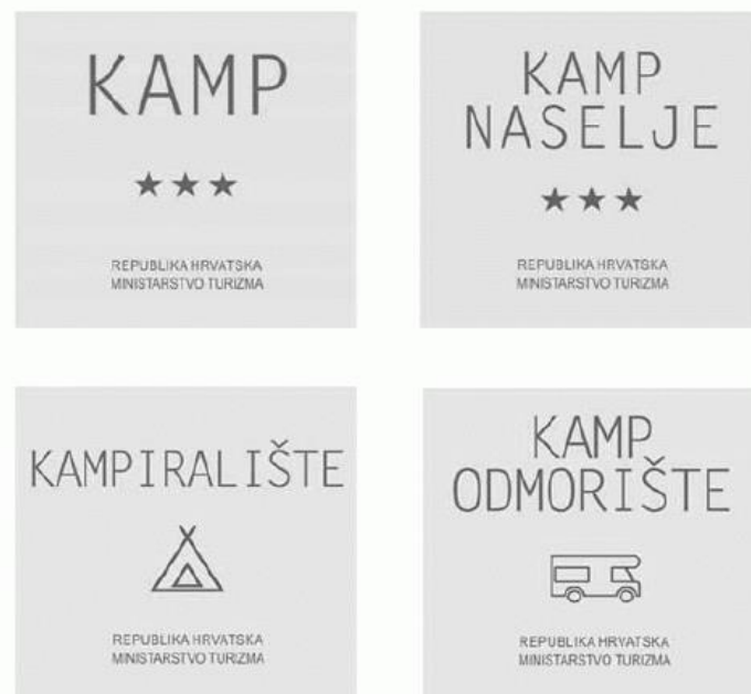
Slika 3. Klasifikacija kampova

Kod kategorizacije kampova i kamp naselja gledaju se karakteristike kao što su: uređenje, oprema, uređaji, usluge, održavanje i ostalo. Uz navedeno, za kamp naselja se još gledaju i Propisi za vrstu objekta koja se još nalazi u kamp naselju. Također, uz gore spomenute karakteristike, kampovi i kamp naselja za pojedinu kategoriju trebaju ispuniti propisani bodovni prag koji se odnosi na: ekologiju, sport i rekreaciju, animaciju te na ugostiteljske, trgovačke i ostale sadržaje. (NN, broj 138/06, čl. 14, st.2, 2024)