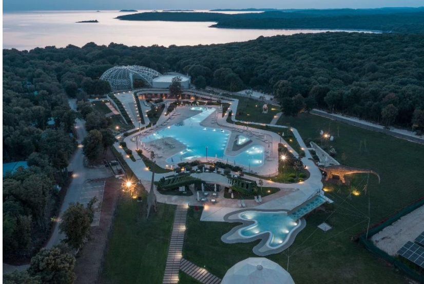
Slika 12. Mon Perin Caming

bazeni za djecu i odrasle, vodeni park na napuhavanje, wellness i sauna, frizerski salon, animacije za djecu i odrasle, mini golf, košarka, mali i veliki nogomet, jahanje, tenis i ostalo. (Mon Perin, 2024)