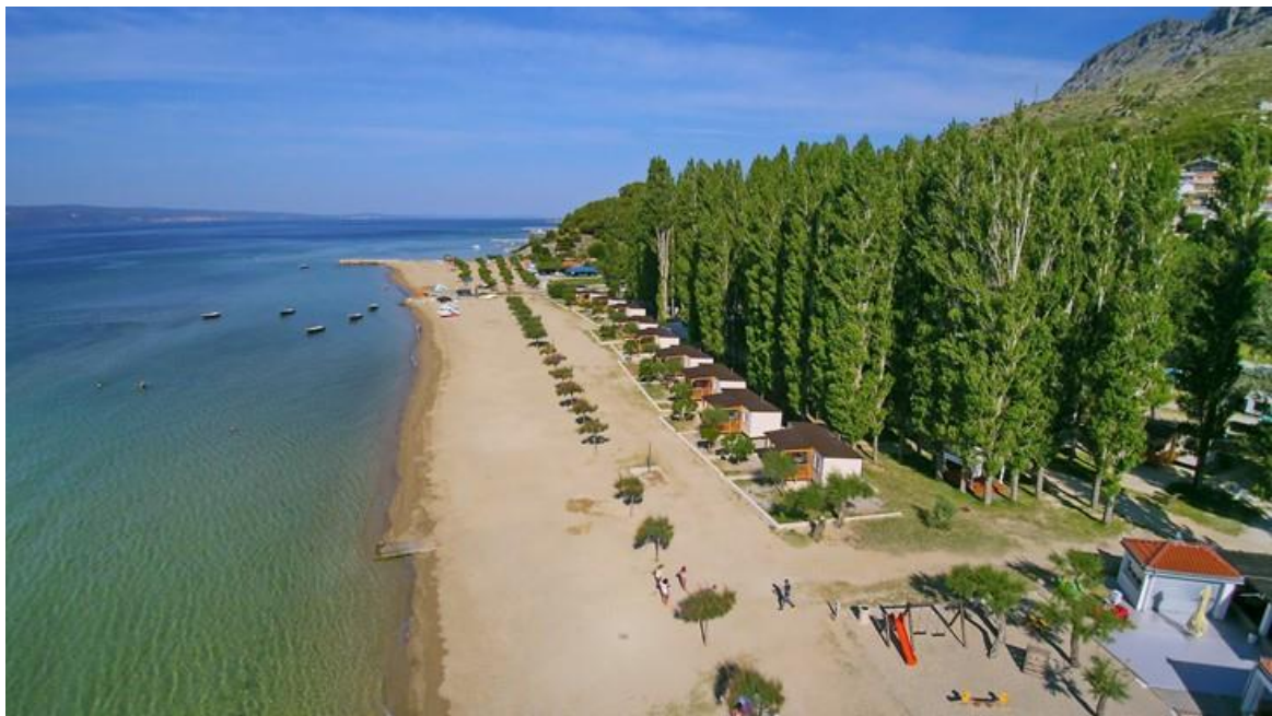
Slika 6. Galeb Camping