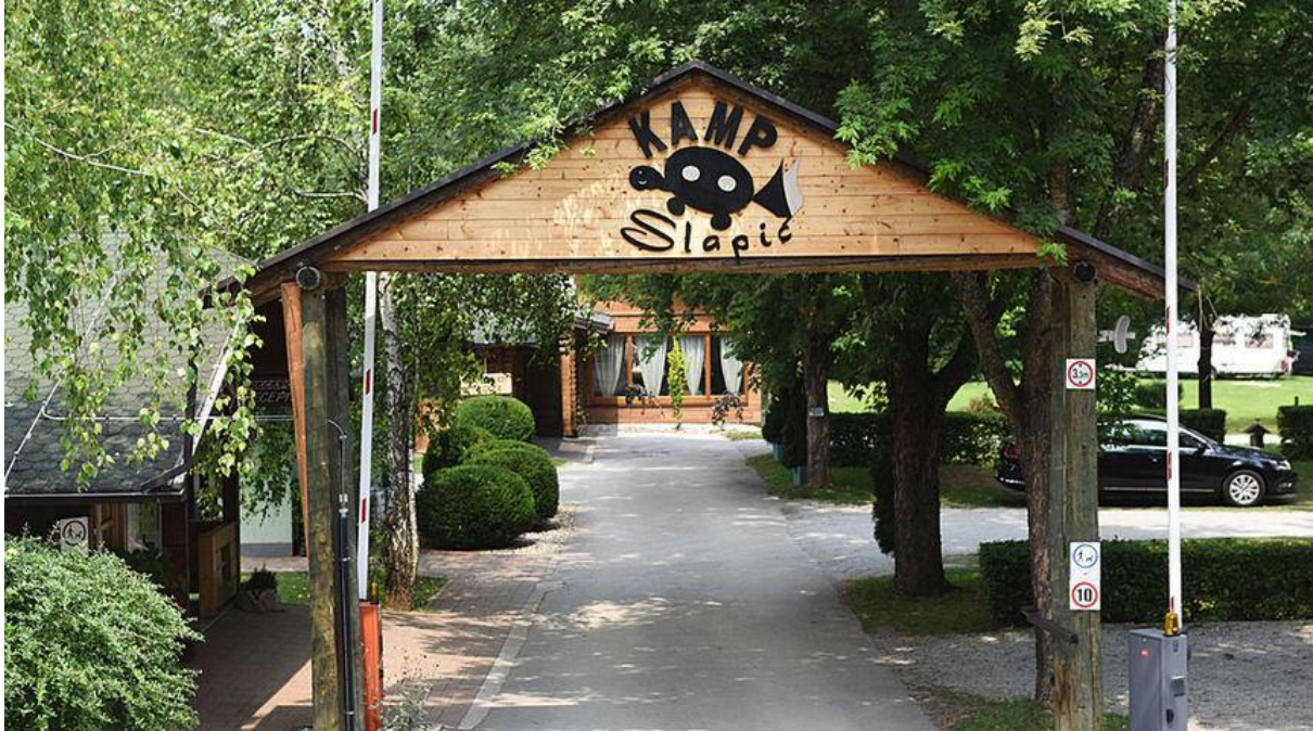
Slika 9. Kamp Slapić

perilicama posuđa, kupaonicama za invalide, perilicom i sušilicom rublja i ostalo. Od ostalog sadržaja, kamp gostima nudi restoran i fast food, bazen, dječje igralište, teren za nogomet, teniski teren, odbojku na pijesku, stolni tenis, jahanje, najam bicikla i ostalo. (Camping, 2024)