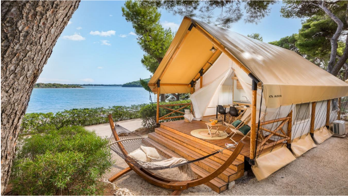
Slika 13. Arena One 99 Glamping