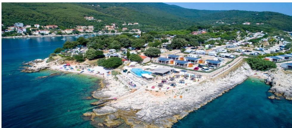
Slika 14. Marina Camping Resort

Rabac je malo naselje smješteno u istarskoj županiji. Jedini kamp u Rapcu je Marina Camping Resort. Kamp se nalazi 15 km od Labina, a njegovi aduti su netaknuta priroda, smještaj uz more i ronilački klub. Kamp krasi stjenovite plaže i plaže s oblucima. Rasprostire se na 5 ha, a kapacitet mu je 969 ljudi. Ima 235 parcele i 75 mobilne kućice. Kamp ima 1 super market i 1 mini trgovinu, otvoreni bazen za djecu i odrasle, animacije za djecu, dječje igralište, stolni tenis, najam bicikla i ronjenje. (Campinghr, 2024)