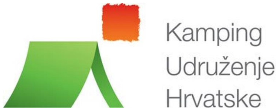
Slika 4. Logo kamping udruženja

Prema Pravilniku u kampovima u Republici Hrvatskoj, kamp se definira kao smještajni poslovni objekt u kojem posluje ugostitelj ili pravna osoba, ima svoje funkcionalne cjeline koje se sastoje od uređenog prostora na otvorenom, građevinama za smještaj gostiju i građevinama namijenjenim za druge potrebe gostiju. (Ministarstvo turizma i sporta RH, 2024)