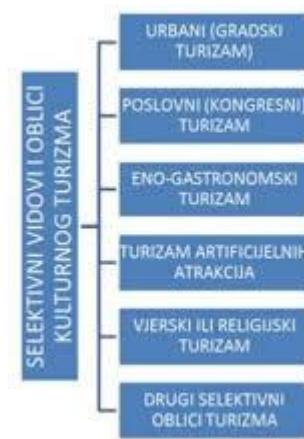
Slika 1. Selektivni oblici turizma

Vlatko Jadrešić 2001. godine dijeli selektivne vrste turizma na šest osnovnih skupina, a te skupine su: ekološki turizam, alternativni turizam, edukativno – komunikacijski turizam, ekskluzivni turizam, zabavno – rekreativni turizam i ostale vrste turizma. Zbog preklapanja određenih elemenata, ova podjela se može sagledati iz šire analize organizacijskih oblika i turističkih sadržaja. (Geić, 2011)