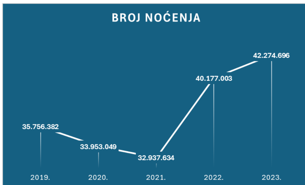
Graf 1. Broj noćenja u Njemačkim kampovima