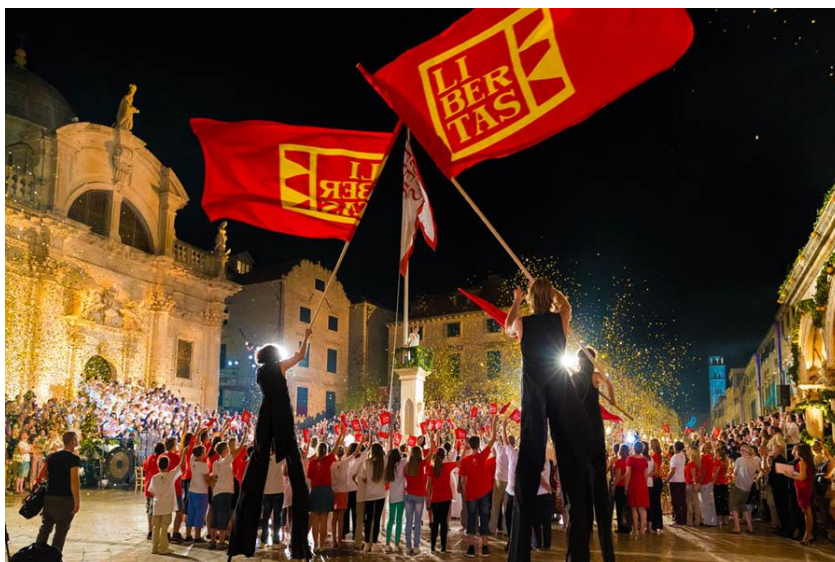
Slika 10. Otvaranje igara 2016. godine, Izvor: https://apoliticni.hr/krecu-dubrovacke-ljetne-igre/

U prvim godinama festival je bio više orijentiran na starija djela hrvatske i svjetske dramske književnosti (Marin Držić, Hanibal Lucić, Ivan Gundulić, Juraj Palmotić, Shakespeare, Sofoklo i dr.), ali su vrlo brzo u repertoar ušli i ostali dramatičari. Mnoge su se kazališne generacije okušale u postavljanju predstava posebno za dubrovačke pozornice na otvorenom, kao i u prilagodbama predstava za izvođenje na otvorenom. Najčešće su se izvodili Hamlet na Lovrijencu i Dundo Maroje na nekoliko pozornica u gradu. S dramskim su predstavama gostovali Old Vic Theatre Company iz Londona i Bristola, Royal National Theatre iz Londona, Narodni Divadlo iz Praga, La Mama iz New Yorka, Teatro Libero iz Rima, Piccolo Teatro iz Milana i dr. (Hrvatska enciklopedija, 2024).