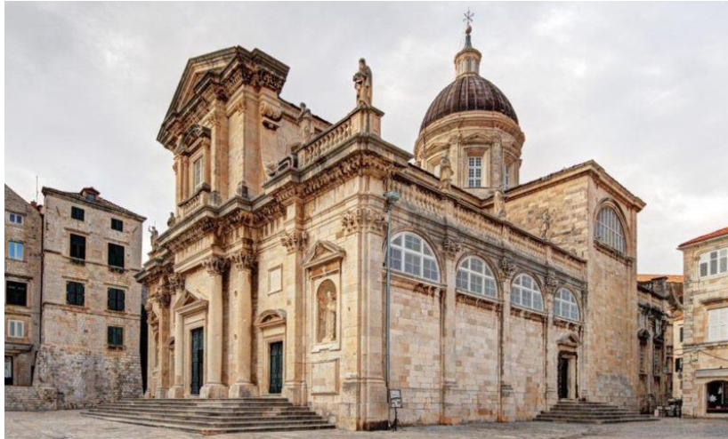
Slika 5. Dubrovačka katedrala, Izvor: https://tz.dubrovnik.hr/get/sakralni_objekti/5007/katedrala.html

Smještena na 37 metara visokoj litici neposredno izvan gradskih zidina, tvrđava Lovrijenac često se naziva „dubrovačkim Gibraltarom“. Ova građevina imala je presudnu ulogu u obrani grada od pomorskih napada. Tvrđava je svojim debelim zidinama i strateškim položajem bila simbol otpornosti i neovisnosti. Iznad ulaza na tvrđavu Lovrijenac je glasoviti natpis „Non bene pro toto venditur auro“ u prijevodu; „Sloboda se ne prodaje za svo blago svijeta“. Prvi službeni zapisi spominju tvrđavu 1301. godine iako se vjeruje da je gradnja počela i ranije (Turistička zajednica grada Dubrovnika, 2024.). Tvrđava Lovrijenac danas je popularna turistička atrakcija i mjesto kulturnih događaja, posebice tijekom Dubrovačkih ljetnih igara, kada se na njoj održavaju kazališne predstave i koncerti. S tvrđave se pruža prekrasan pogled na Jadransko more, gradske zidine i Stari grad, što je čini omiljenim mjestom za fotografiranje (Leksikon Marina Držića, 2024).