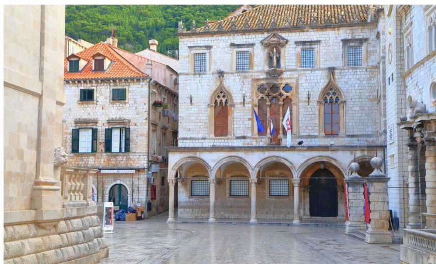
Slika 8. Palača Sponza (Danas Državni arhiv Dubrovnika), Izvor: https://kofer.info/palaca-sponza/

Posljednjih godina Dubrovnik je stekao dodatnu slavu kao mjesto snimanja raznih filmova i televizijskih serija. Najistaknutija od njih je HBO-ova Igra prijestolja, u kojoj je Dubrovnik korišten kao primarno mjesto snimanja fiktivnog grada King's Landing. Iznimna popularnost serije privukla je novi val turista koji žele posjetiti mjesta snimanja i doživjeti grad kroz objektiv serije. Grad nudi raznolika iskustva za posjetitelje kao što su pješačke ture. Nekoliko kompanija nudi pješačke ture koje posjetitelje vode kroz glavna mjesta snimanja u Dubrovniku. Vodiči često dijele priče iza kulisa, pokazuju usporedne fotografije iz serije te objašnjavaju kako su gradske znamenitosti pretvorene u kultne scene. Također nekoliko trgovina i izložbi je posvećeno seriji, nudeći tematske suvenire, memorabilije i detaljne izložbe u procesu snimanja. Dubrovnik je prihvatio svoju povezanost s „Igram prijestolja“, što ga čini nezaobilaznom destinacijom za obožavatelje te serije, a istovremeno nudi bogato povijesno i kulturno iskustvo. Iako je to donijelo gradu značajne ekonomske koristi, također je izazvalo zabrinutost zbog utjecaja masovnog turizma na povijesna mjesta grada (Dubrovnik Digest, 2013).