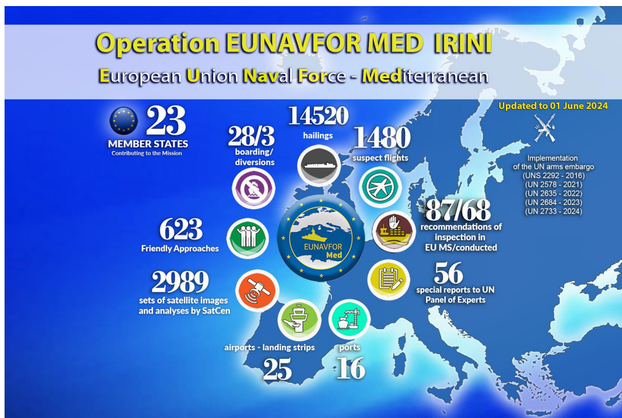
Slika 4. Operaciju EUNAVFOR MED IRINI