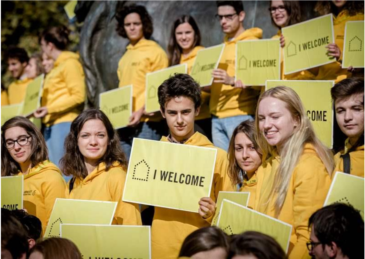
Slika 3. Volonteri organizacije Amnesty International prihvaćaju izbjeglice u Francuskoj