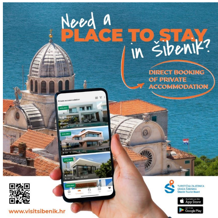
Slika 3. Promoviranje web stranice turističke zajednice grada Šibenika

Bez obzira na zastupljeniju online komunikaciju, i dalje postoji potreba za promidžbenim materijalima grada Šibenika na sajmovima i prezentacijama, zatim za potrebe predstavništava Hrvatske turističke zajednice u inozemstvu, diplomatskih predstavništava te info punktova. TZ grada Šibenika nastavlja s dotiskom plana grada i planova manjih turističkih mjesta, kalendara događanja, letaka, vrećica te ostalih promidžbenih materijala. (Program rada 2024, TZ Šibenik)