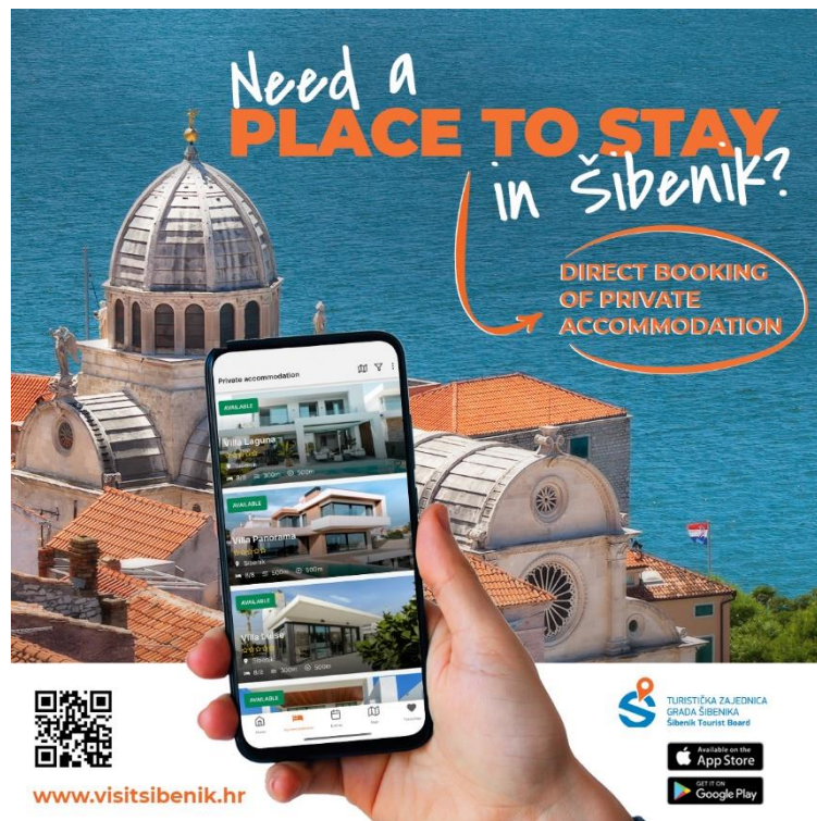
Slika 3. Promoviranje web stranice turističke zajednice grada Šibenika

Bez obzira na zastupljeniju online komunikaciju, i dalje postoji potreba za promidžbenim materijalima grada Šibenika na sajmovima i prezentacijama, zatim za potrebe predstavništava Hrvatske turističke zajednice u inozemstvu, diplomatskih predstavništava te info punktova. TZ grada Šibenika nastavlja s dotiskom plana grada i planova manjih turističkih mjesta, kalendara događanja, letaka, vrećica te ostalih promidžbenih materijala. (Program rada 2024, TZ Šibenik)