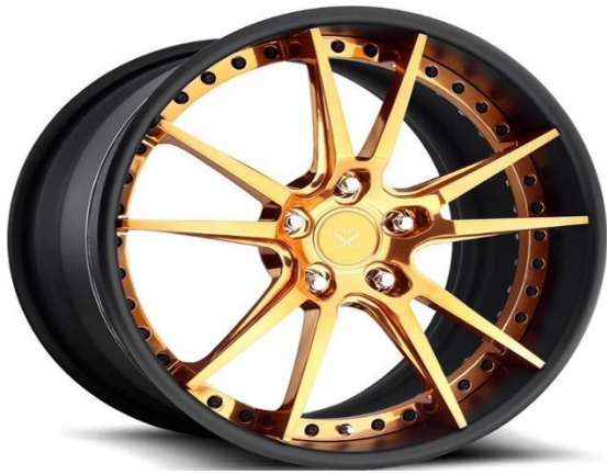
Slika 2. Aluminijski kotač

Unatoč raznim prednostima, aluminijski kotači ipak imaju i nekoliko nedostataka. Jedan od njih je viša cijena u usporedbi s čeličnim kotačima. Zbog kompleksnijeg proizvodnog procesa i skupljih materijala, za aluminijske kotače uglavnom je potrebno izdvojiti više novca, što može predstavljati značajan trošak prilikom kupovine novih kotača ili zamjene postojećih.