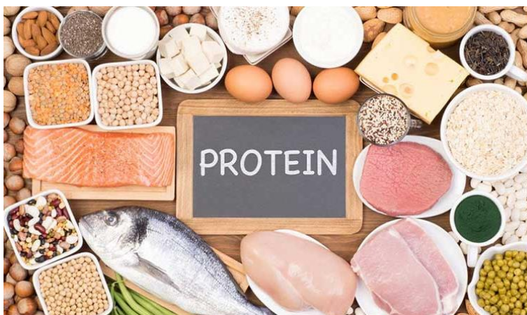
Slika 4. Namirnice bogate proteinima