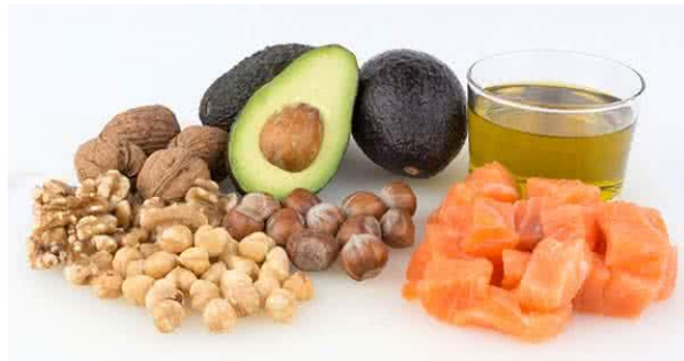
Slika 5. Namirnice bogate mastima

“Masti su bitne za normalan rad organizma, tim više što su u mastima otopljeni vitamini A, D, E i K. Također su gradivni elementi staničnih ovojnica, tkiva i mozga, a sudjeluju u sintezi antitijela. Masti su nakon ugljikohidrata drugi izvor energije, no kod vrhunskih sportaša koji trebaju "brzu energiju", taj se deponij slabo troši. Žene imaju veću rezervu masti u tijelu u usporedbi s muškarcima, što im omogućuje prednost u dugotrajnim aktivnostima zahvaljujući pojačanoj oksidaciji masti. Kao i u ostalim vrstama prehrane, nezasićene masne kiseline (linolna) bi trebale biti više zastupljene od zasićenih, a u kreiranju obroka bi se trebalo koristiti isključivo ulje biljnog porijekla (suncokretovo, maslinovo, laneno, kukuruzno, ulje iz sjemenki uljane repice). Životinjske masnoće se ne preporučuje (Vladović, 2023).