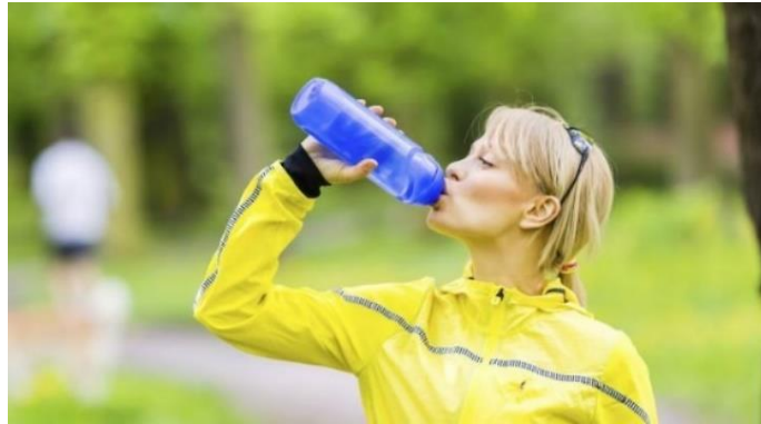
Slika 6. Hidracija sportaša

“Tjelesne tekućine i ravnoteža elektrolita esencijalni su segmenti optimalne fiziološke funkcije organizma. Tijekom tjelesne aktivnosti, fizičkog rada ili uslijed izloženosti povišenoj temperaturi, može se razviti izvjestan stupanj dehidracije, te dolazi do promjene omjera intracelularne i ekstracelularne tekućine” (Fitness.com, 2017).