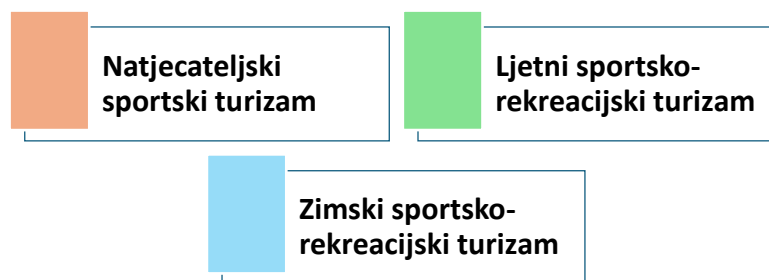
Slika 1. Vrste sportskog turizma

Prema: Bartoluci, M., i sur., Menedžment u sportu i turizmu. Kineziološki fakulteta, Ekonomski fakulteta, Zagreb, 2003.