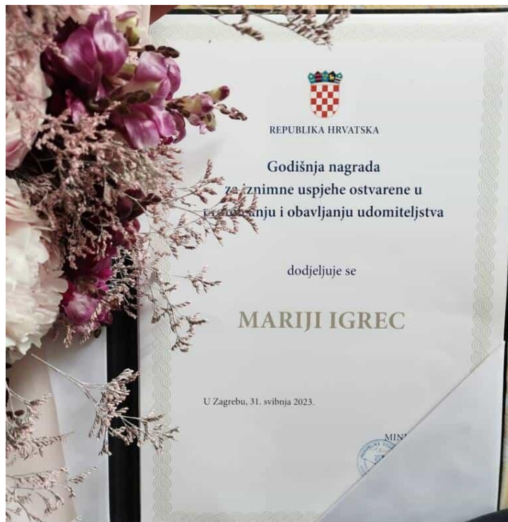
Slika 6. Godišnja nagrada za iznimne uspjehe ostvarene u promicanju i obavljanju udomiteljstva

osobno ime i potpis ministra te pečat Ministarstva, pri čemu visina Godišnje nagrade iznosi 663,00 eura, a visina Nagrade za životno djelo 1325,00 eura. 63