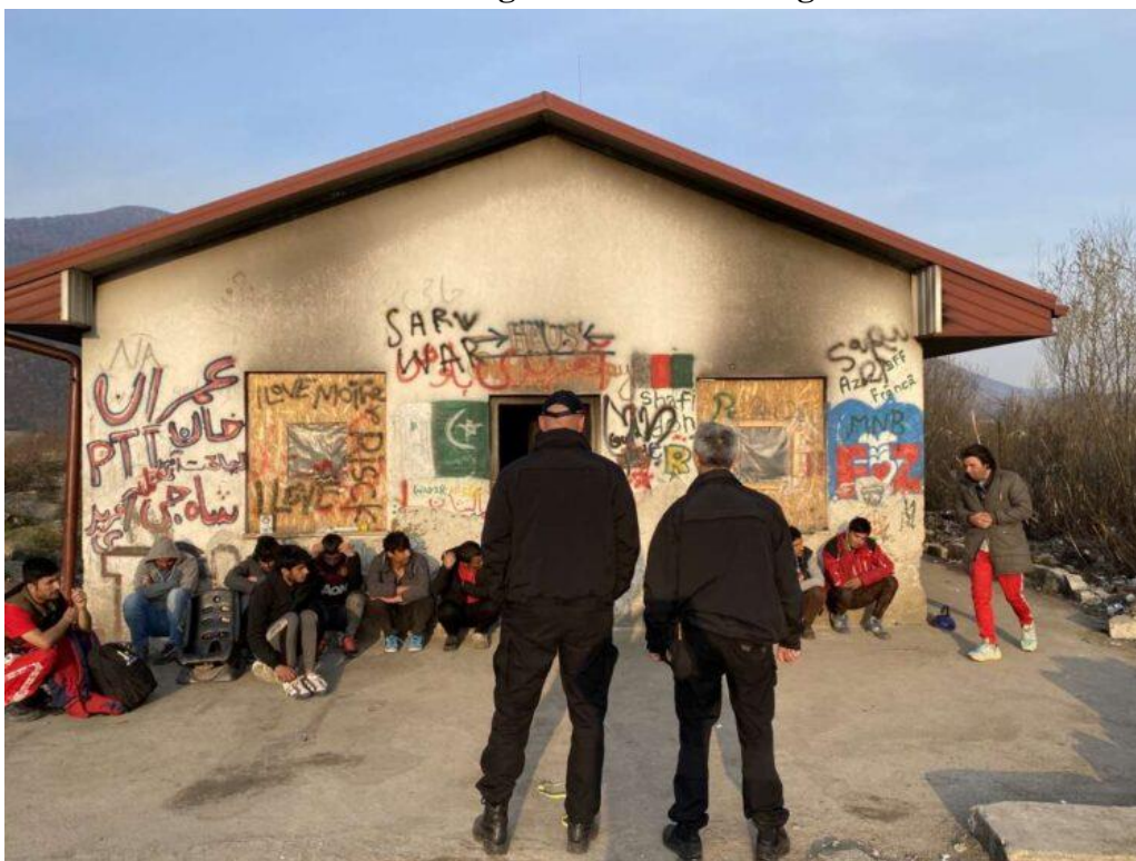
Slika 2. Prikaz ilegalno otkrivenih migranata