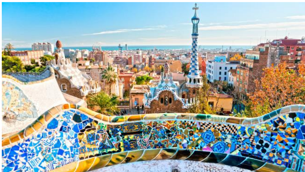
Slika 7. Barcelona