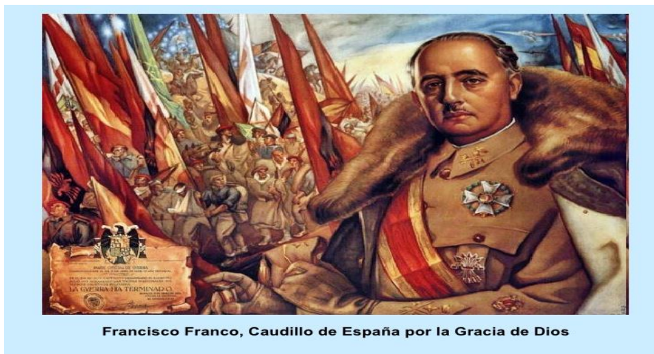
Slika 2. Caudillo Francisco Franco