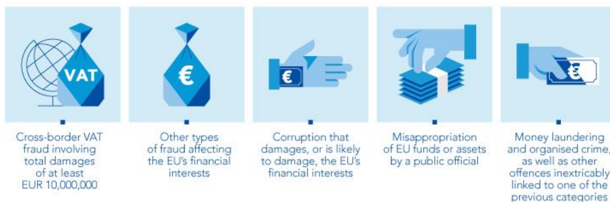
Slika 3. Kaznena djela pod ovlastima EPPO-a