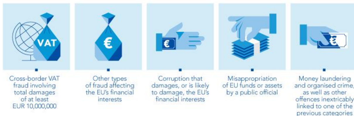
Slika 3. Kaznena djela pod ovlastima EPPO-a

Izvor: Misija i zadaće, dostupno na: https://www.eppo.europa.eu/hr/misija-i-zadace (27.07.2023.).