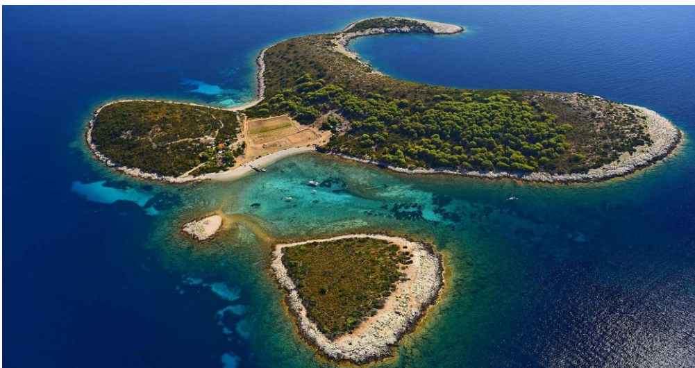
Slika 5. Viški Arhipelag.

„Projektom „Otoci u moru znanja“ namjerava se putem organizacije treninga za edukatore, prevoditelje aktivnosti udruga uključenih u projekte te putem osmišljavanja inovativnih i interaktivnih edukativnih sadržaja osposobiti udruge za provedbu niza aktivnosti kojima će se popularizirati STEM i organizirati različiti programi edukacije iz područja prirodoslovlja za djecu i mlade.“ (Geopark Viški Arhipelag, 2022, str. 12). Već su u 2022. godini započele aktivnosti ovog projekta kroz radionice koje su bile organizirane za djecu. U 2023. godini je planiran nastavak održavanja radionica za jačanje kapaciteta i organizacija terenske nastave za djecu iz OŠ Komiža te OŠ Vis. Ovim projektom se želi osigurati bolje korištenje informacijskih kao i komunikacijskih tehnologija, sa svrhom prenošenja prirodoslovnih znanja o morskom okolišu te popularizaciji sadržaja o biologiji, kemiji i fizici mora.