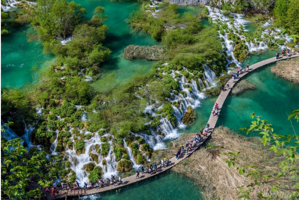
Slika 4. Nacionalni park Plitvička jezera.