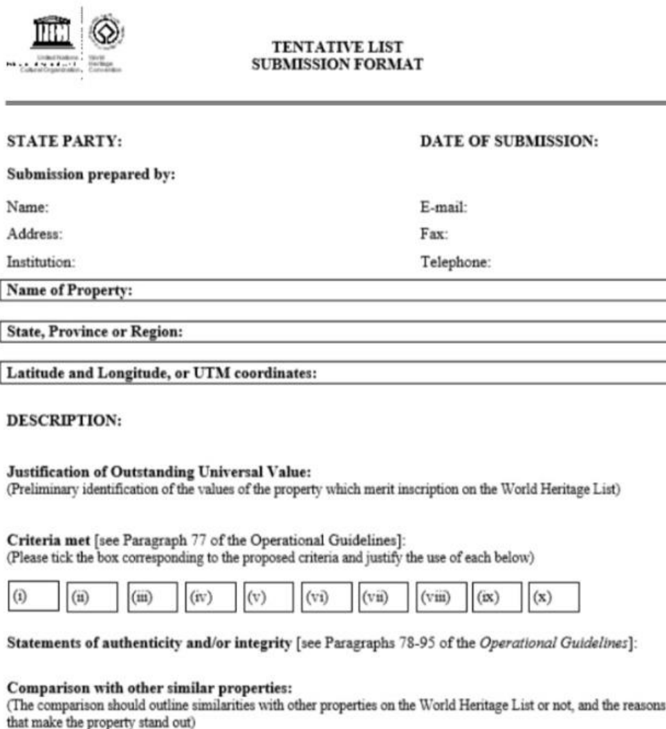
Slika 2. Dosje za podnošenje Tentativne liste.