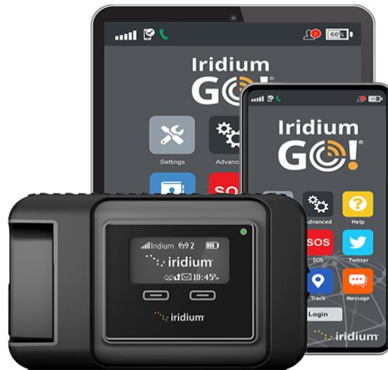
Slika 8. Iridium GO uređaj

blizini. Svaki uređaj u krugu od sto metara može se spojiti na ovu žarišnu točku i pristupiti World Wide Webu. Isto tako može podržati maksimalno pet istodobnih uređaja, a samim korisnicima omogućuje glasovne pozive, dijeljenje datoteka, korištenje usluga GPS praćenja, a poznato je kako i podržava SOS upozorenja. 14