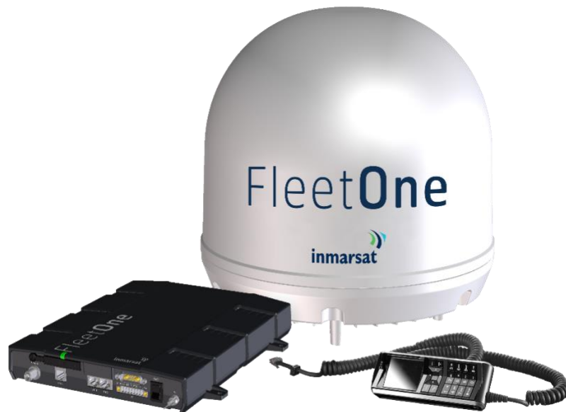
Slika 17. Inmarsat Fleet 77 sustav

radi na I-4 generaciji satelita, premda je u budućnosti u planu da se prebaci na najnoviju generaciju satelita I-6 koja se trebala početi lansirati tijekom 2020. 22