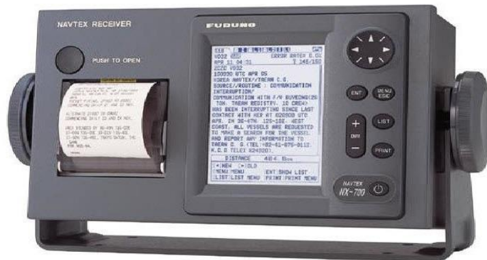
Slika 1. Navtex sustav