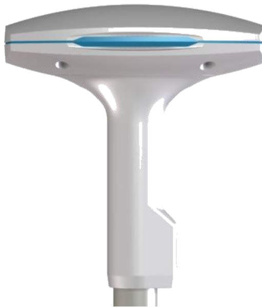
Slika 5. LT-1000 NRU navigacijska referentna jedinica

LT-1000 NRU je navigacijska referentna jedinica koja predstavlja pomorski senzor smjera na kojeg je ugrađen GNSS/GPS prijamnik tvrtke Lars Thrane A/S. Ovo je također napredna jedinica koja se sastoji od 12 preciznih senzora kao što su žiroskopi, akceleratori, barometri, itd. Sama jedinica uključuje i napredne tehnologije kao što su Kalmanovo filtriranje, izračun magnetske varijance na temelju Svjetskog magnetskog modela (WMN), kompenzacija tvrdog i mekog željeza, GPS, GPS i GLONASS ili GPS i Bei Don, EGNOS, WAAS. 11