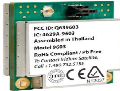
Slika 11. Iridium Certus 9810 modem