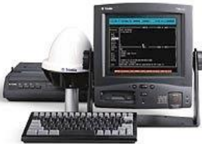
Slika 16. Inmarsat C sustav