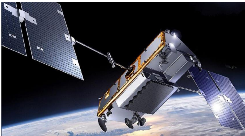
Slika 9. Iridium NEXT satelit