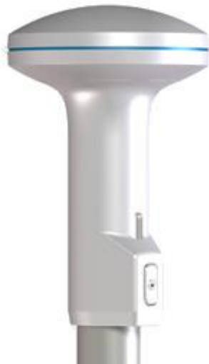
Slika 3. LT-300 GNSS prijamnik

LT-300 GNSS je prijamnik koji osigurava točnost položaja većeg od 2 metra te šalje navigacijske podatke kao što su datum i vrijeme, magnetske varijance, kurs nad Zemljom, položaj, brzina na tlu te tako plovilu omogućuje sigurnu i učinkovitu navigaciju. Prijamnik se velikom lakoćom može montirati na krovni nosač sa samo jednim kabelom koji sam po sebi podržava NMEA 1083, NMEA 2000 i napajanje. Dostupan je također i vanjski softver za održavanje, servisiranje i instalaciju. 9