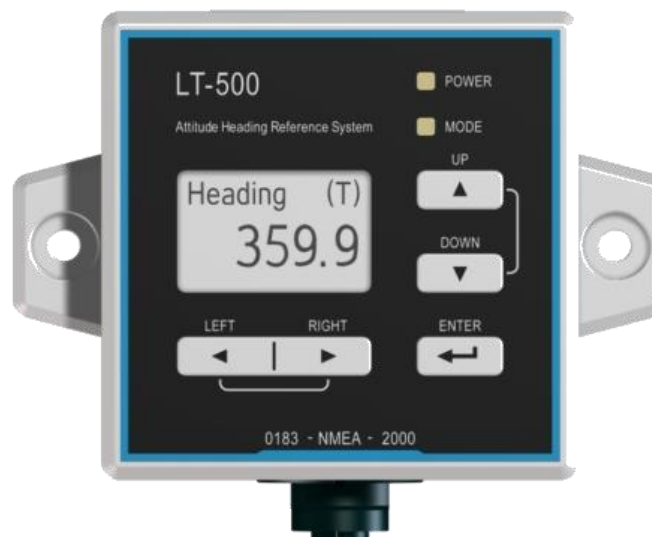
Slika 4. LT – 500 AHRS uređaj

Ovaj uređaj je napredna mala i kompaktna jedinica sa 11 jako preciznih senzora. Za proizvodnju je također zaslužna tvrtka Lars Thrane A/S čija je jedinica napravljena za navigaciju u pomorskom prometu. Kako ova jedinica koristi senzorske fuzije i Kalmanovo filtriranje tako korisniku daje pravi smjer, kotrljanje, nagib, tlak zraka i temperaturu u stvarnom vremenu s iznimno jakom rezolucijom. 10