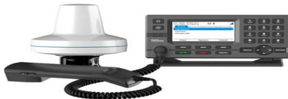
Slika 2. LT-3100 Iridium uređaj

Ovaj uređaj je satelitski i komunikacijski uređaj tvrtke Lars Thrane A/S te je dizajniran za profesionalno tržište, a pri tomu se misli da je namijenjen za ribolov ili duboka mora. Uređaj sam po sebi zadovoljava sve zahtjeve kao i propisane standarde za certifikaciju potrebnu za svjetsku pomorsku satelitsku i komunikacijsku opremu. Koristi se na plovilima kao primarni satelitski i komunikacijski uređaj, a služi za pozivanje posade te kao pomoćni satelitski i komunikacijski proizvod. Također, sustav LT - 3100 Iridium šalje glasovne i SMS podatke za praćenje vozila uz pristupačnu cijenu emitiranja te ga to čini vrlo dobrim uređajem za satelitsku komunikaciju na bilo kojem plovilu. Sam sustav je također jako jednostavan za instalaciju te kao takav ne zahtijeva godišnji servis. Pomoću ugradbenog nosača, instalirana je upravljačka jedinica, a pomoću kutnog nosača se može ugraditi antenska jedinica. 8