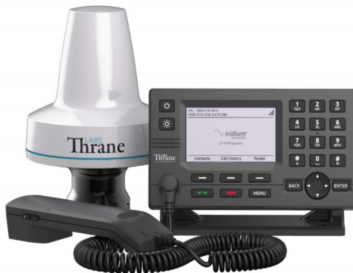
Slika 6. LT-4100 CERTUS 100

Ovaj sustav sastoji se od postolja, slušalice te antenske i kontrolne jedinice. Povezanost upravljačke jedinice i antenske jedinice može se dogoditi korištenjem standardnog koaksijalnog kabela te se njime može postići do 500 metara razmaka između samih jedinica, a to je jako dobro jer se antenske jedinice mogu postaviti na najbolje mjesto sa slobodnim vidnim poljem za satelite. Mreža Iridium osigurava globalnu pokrivenost, a sam sustav LT-4100 ima jako dobre i kvalitetne glasovne i podatkovne mogućnosti. 12