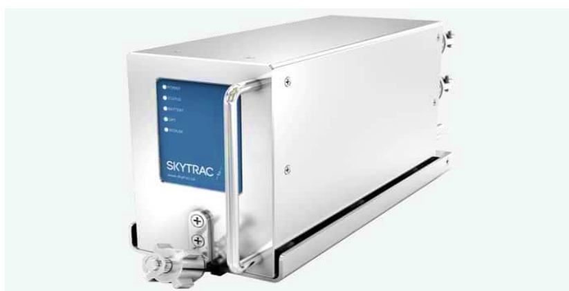
Slika 15. ISAT-200A-08™ primopredajnik

ISAT-200A-08™ je terminal za prikupljanje podataka i satelitsku komunikaciju. Jedna od njegovih mogućnosti je poboljšanje brzine obrade podataka. U usporedbi s uskopojasnim alternativama, postavljen je da omogući sljedeću generaciju stop-to-pole povezanost, elektroničku automatizaciju letačke torbe, ugrađeni Wi-Fi i grafičku vremensku prognozu u stvarnom vremenu.