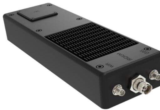
Slika 13. DLS-100 primopredajnik

Skytrac-ov DLS-100 je srednje pojasni primopredajnik te kao takav omogućuje naredbu i kontrolu u stvarnom vremenu, GPS povezivanje za bespilotne zrakoplovne sustave i prijenos telemetrije. Njegove dodatne mogućnosti su: globalna pokrivenost s 99,9 % pouzdanosti u radu, omogućava bezbrižan let u svim vremenskim uvjetima, ima GPS vezu za povećanu funkcionalnost i dokazane performanse.