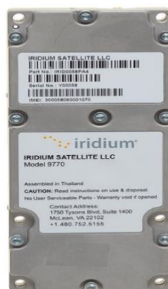
Slika 10. Iridium Certus 9770 modem

Iridium Certus 9770 prenosi IP podatke više od 35 puta brže od starijih modela istog sustava. Jako je malen i mobilan, te u isto vrijeme može podržavati dvije visokokvalitetne glasovne linije. Sve zajedno je povezano pomoću Iridiumove globalne L-pojasne mreže.