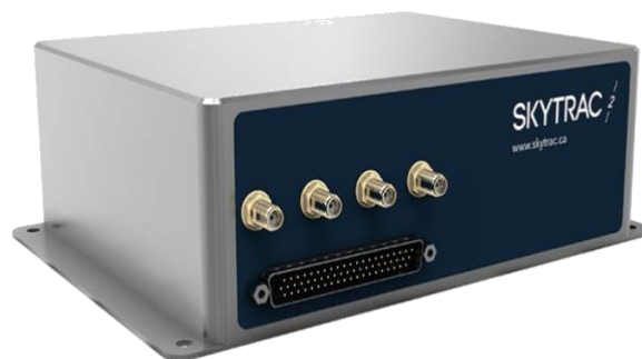
Slika 12. IMS-350™ je SKYTRAC-ov terminal

IMS-350™ je Skytrac-ov vodeći terminal koji pruža podatkovnu vezu, male je snage te ima prilagođene mogućnosti za industrije koje traže pouzdane i provjerene globalne komunikacije. Neke od njegovih dodatnih mogućnosti su: globalna pokrivenost s 99,9 % pouzdanosti u radu, pametno usmjeravanje podataka, ima moćne mogućnosti prikupljanja podataka za povećanu funkcionalnost i dokazane performanse u svim segmentima zrakoplovstva.