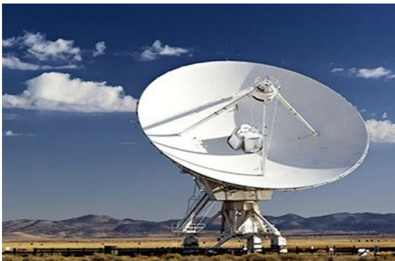
Slika 7. Prikaz VSAT sustava