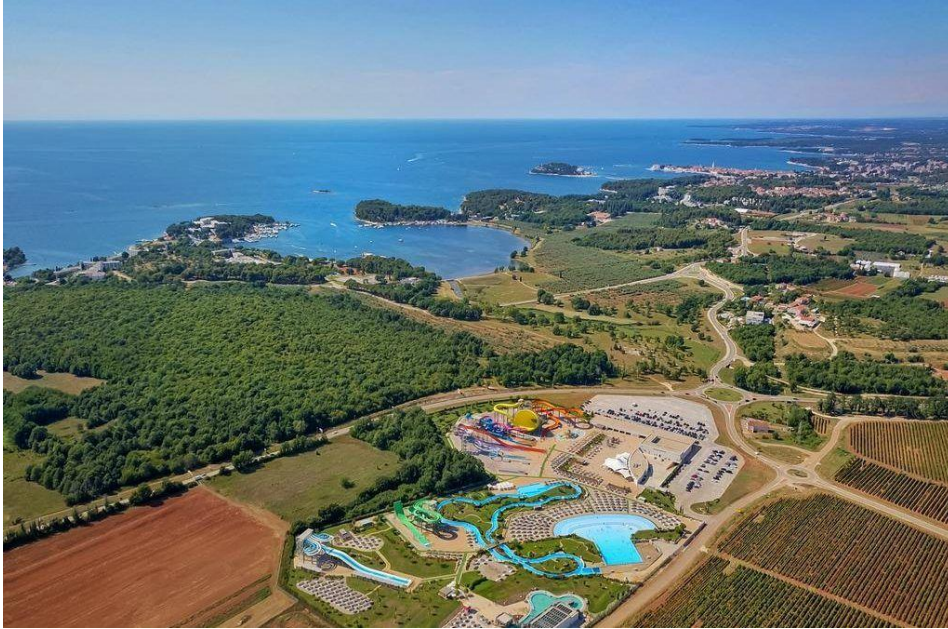
Slika 9. Klaster Poreč