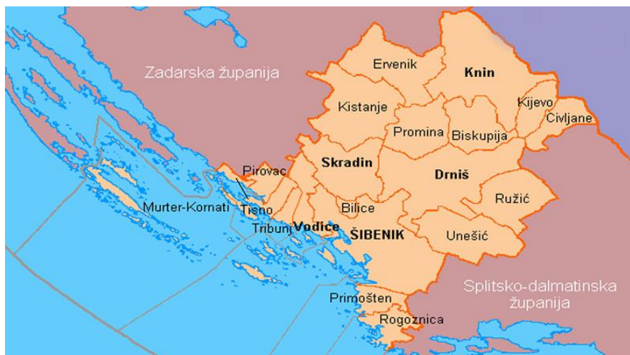
Slika 13. Šibensko-kninska županija