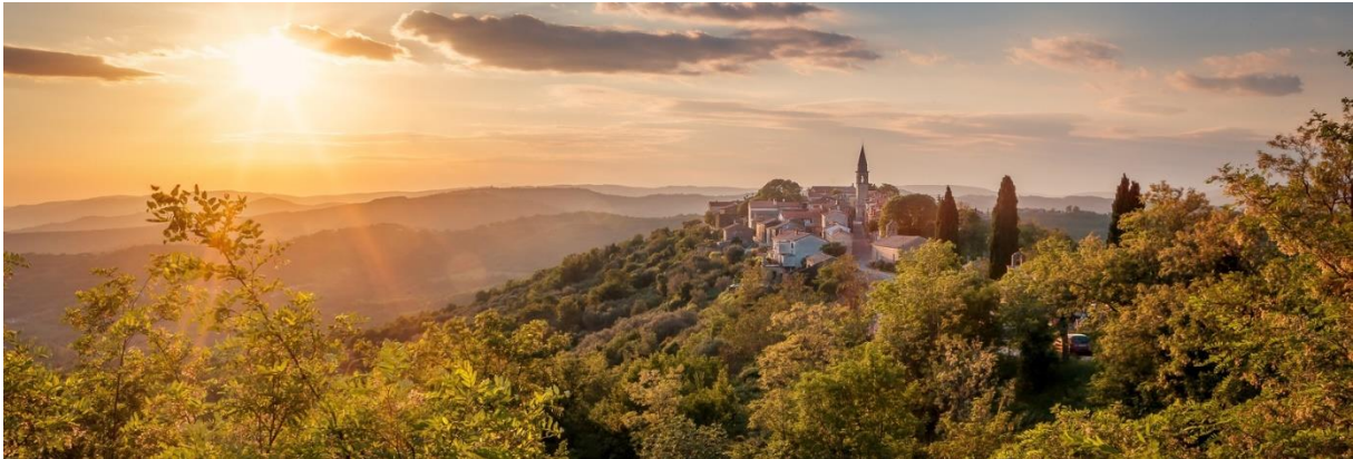
Slika 7. Središnja Istra