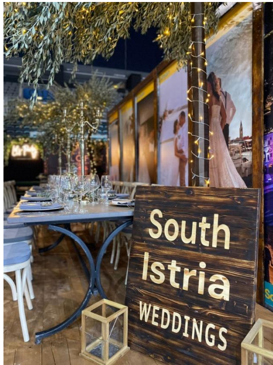
Slika 10. Klaster Južna Istra