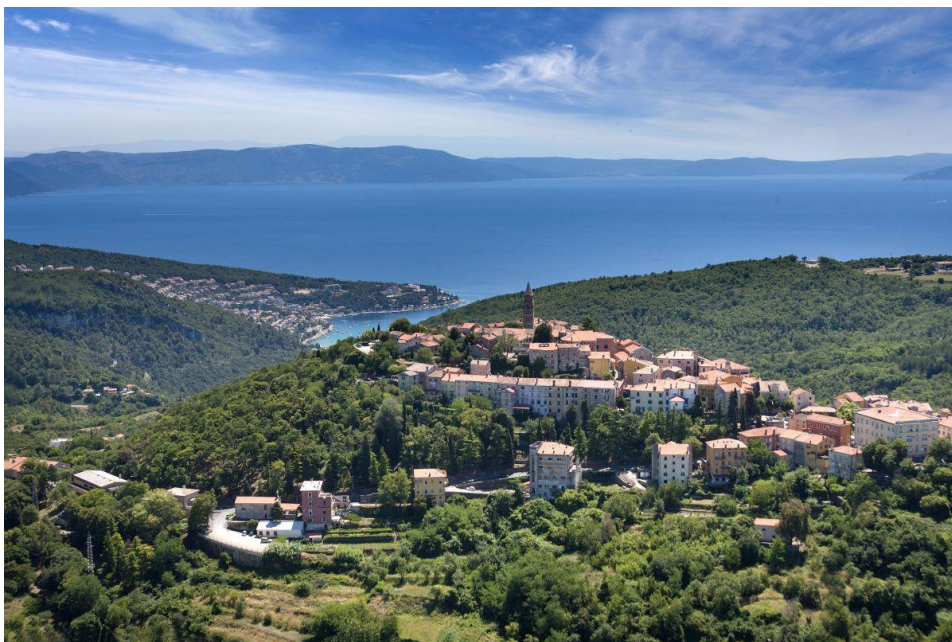
Slika 8. Klaster Labin-Rabac