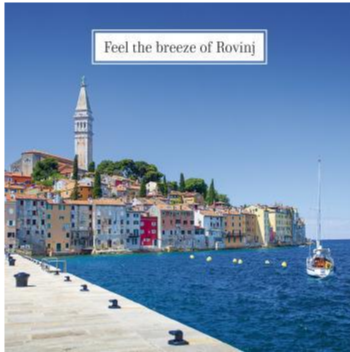
Slika 11. Klaster Rovinj