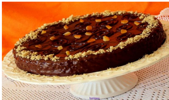
Slika 22. Tradicionalna Šibenska torta

Od slastica se najčešće priprema i poslužuje tradicionalna Šibenska torta koja se sprema od jaja, šećera, naranči i oraha, a na kraju se prelijeva glazurom od čokolade (slika 22.).