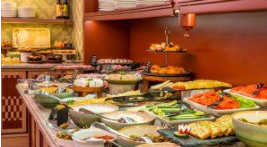
Slika 13. Gastro ponuda hotela Amadria Park Capital

Hotel ima i elegantni restoran Capital koji odlikuje sofisticiranost te okruženje zelenilom. A la carte ručkove prati Coravin vinski sustav za uživanje u vinu prema raspoložuju, a gosti mogu vrijeme provoditi i u susjednom Bar Capitalu (Amadria Park – restoran Capital, 2022).