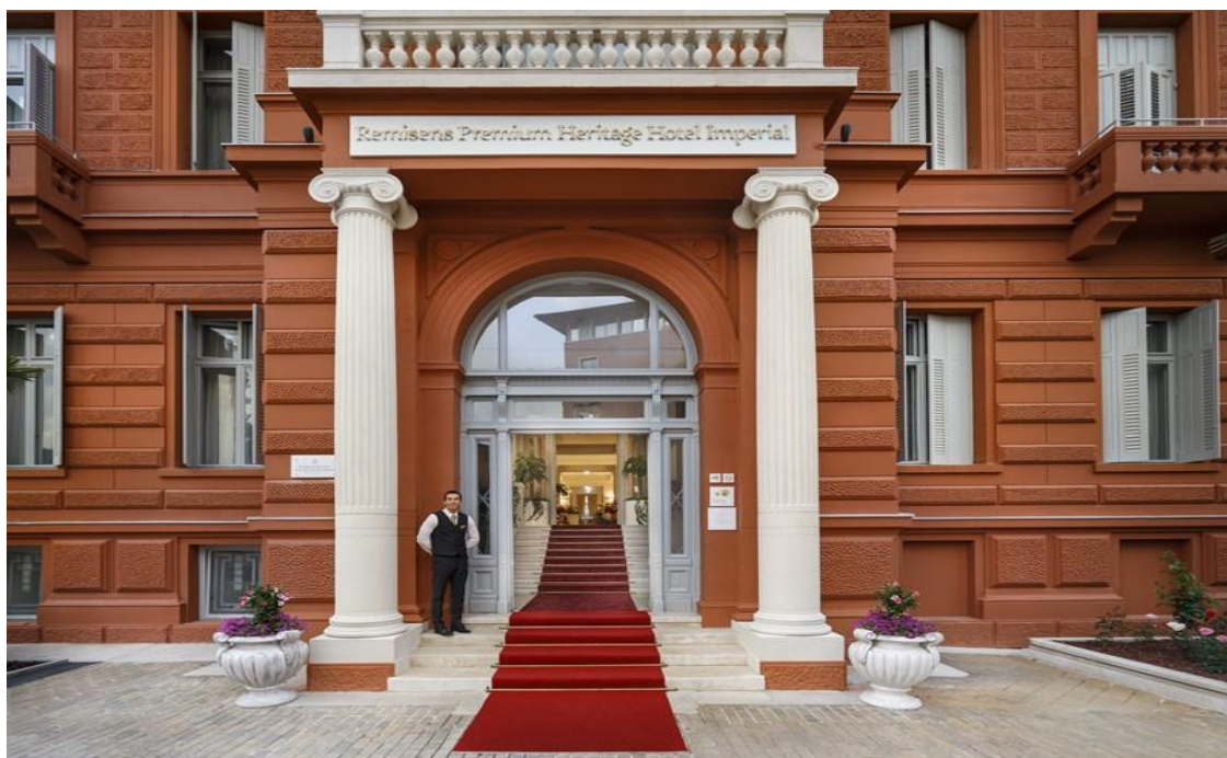
Slika 8. Ulaz u hotel Remisens Premium Heritage Hotel Imperial

Heritage Hotel Imperial izgrađen je 1885. godine u Opatiji i predstavlja drugi hotel na Jadranu, a izgrađen je u secesijskom stilu. Ovaj hotel ima wellness centar u kojemu gosti mogu uživati u kozmetičkim tretmanima i masažama. Za sastanke i domjenke izgrađena je Zlatna dvorana koja ovaj hotel čini posebnim, a blizu hotela je i glavna gradska plaža Slatina. Heritage Hotel Imperial u svojoj ponudi ima opuštajući odmor u središtu grada, a karakterizira ga povijesno naslijeđe koje kreira kombinaciju stvarnosti i fantazije (Heritage Hotel Imperial, 2022).