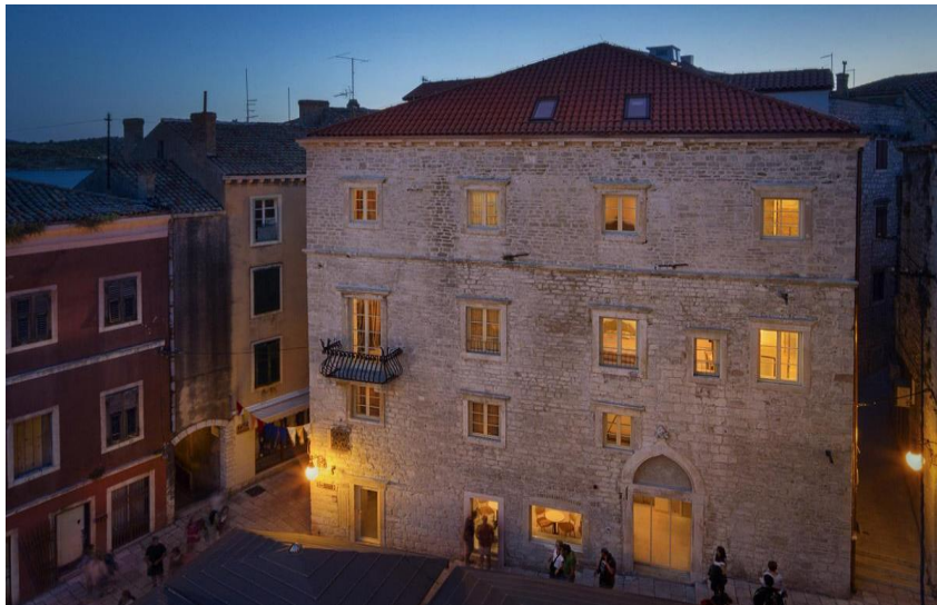
Slika 14. Hotel Life Palace

Hotel Life Palace idealno je polazište za istraživanje grada i okolice, oaza luksuza za bijeg od svakodnevnih briga i stresa, ali i dobar odabir za poslovni boravak. U neposrednoj blizini zgrade nalaze se svi važniji kulturno-povijesni objekti i spomenici, kao što su Katedrala sv. Jakova, Muzej grada Šibenika u Kneževu dvoru, samostan sv. Lovre, tvrđava Sv. Mihovila i mnogi drugi. Na samo nekoliko minuta vožnje od grada nalazi se Nacionalni park Krka, a izlet u Nacionalni park Kornati nezaboravno je iskustvo za svakog posjetitelja srednje Dalmacije (Life Palace – aktivnosti, 2022).