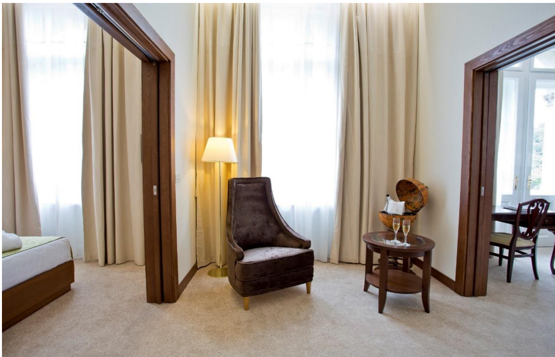
Slika 5. Suite diplomatique Palace Hotela Zagreb

Od soba su u ponudi komforne (jednostavnije uređene) i superior (luksuznije), a od apartmana junior (polu-apartmani), „klasični“ apartmani te suite diplomatique (novouređeni apartman).