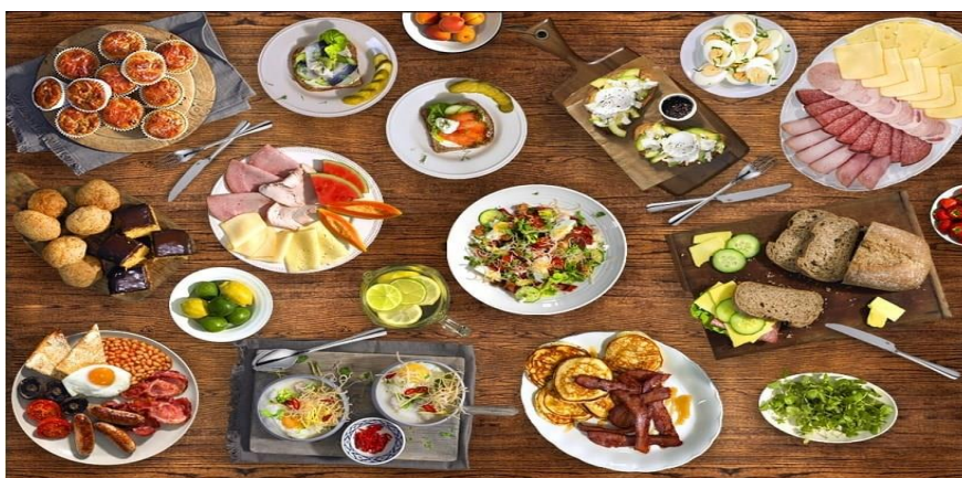
Slika 16. Dio gastro ponude hotela Life Palace

Neka od tipičnih šibenskih jela koja se poslužuju u ovom hotelu su buzare od rakova ili školjaka, brudeti, variva od povrća, rižoti te riblje i mesne juhe, a od tradicionalnih deserta poslužuju se rožata, fritule, kroštule i favete (Life Palace – menu, 2022).