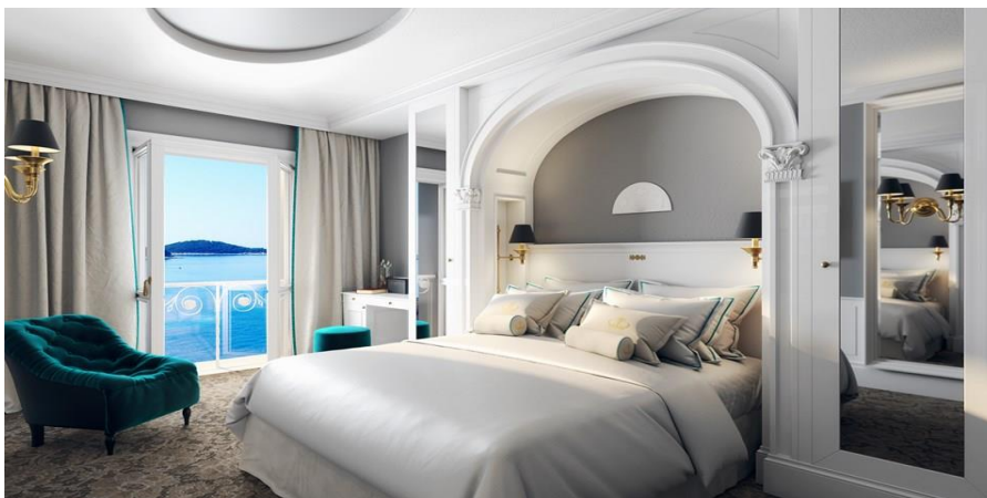
Slika 27. Elisabeth apartman

Hotel raspolaže s 33 sobe (park i premium ) i 12 hotelskih apartmana ( deluxe suite , penthouse apartman, imperial suite , Elisabeth apartman i predsjednički penthouse apartman). Elisabeth apartman (Slika 29.) najveći je apartman u hotelu i smješten je na drugom katu sa središnjim pogledom na gradski trg i luku. Iznimno prostran, ovaj apartman obuhvaća veliki balkon, jedinstven je zbog svog elegantnog dizajna s venecijanskim elementima (Sunčani Hvar, 2022).