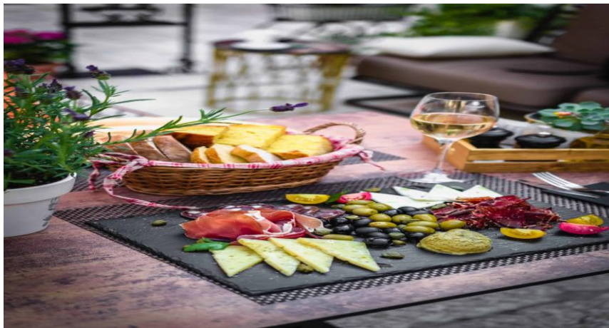
Slika 21. Dio gastro ponude hotela King Krešimir

Gastronomsku ponudu ovoga hotela čine: pečeno meso (govedina, puretina, piletina, svinjetina), tjestenina (na razne načine), riba, tartufi, sir (razne vrste), burgeri, šunka, pršut, rižoto (razne vrste), odresci, morski plodovi, omleti, tost, razne vrste salata i još mnoga druga jela. U ovome se hotelu nude jela mediteranske kuhinje, a pripremaju se od svježeg povrća iz domaćih vrtova i gradskih tržnica, svježe ribe lokalnih ribara, lokalnog mesa i aromatičnih začina te maslinovog ulja iz Dalmacije.