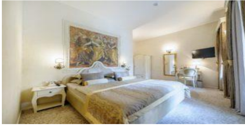
Slika 15. Superior soba hotel Life Palace Šibenik