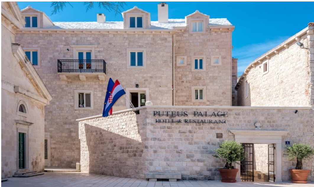
Slika 23. Hotel Puteus Palace

Puteus Palace jest heritage hotel sa sjedištem u Pučišći, na otoku Braču. Ovaj hotel karakteriziraju naslijeđe i elegancija koje je moguće vidjeti u 13 soba i 2 apartmana. Puteus je obnovljena palača iz 1467. godine i, s 550-godišnjom poviješću, jedna je od najstarijih palača na jadranskoj obali, a sada je preuređena u luksuzni hotel s pet zvjezdica (Puteus Palace, 2022).