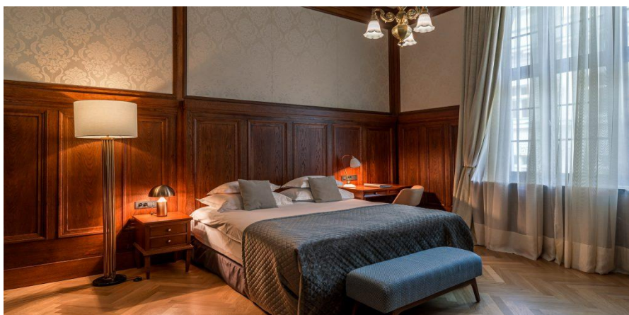
Slika 12. Soba baštine u hotelu Amadria Park Capital

Amadria Park Capital raspolaže sa 72 sobe i 144 kreveta, i to u superior sobama, studio apartmanima i vrlo atraktivnoj sobi baštine. Ova velika, prostrana soba ima bračni krevet, zasebnu kupaonicu i veliku tuš kabinu, a pogled iz nje pruža se na grad Zagreb. Soba sadržava naslijeđe, opremu s modernim dekorom i pri tome daje elegantan, sofisticiran osjeća ( Amadria Park , 2022).