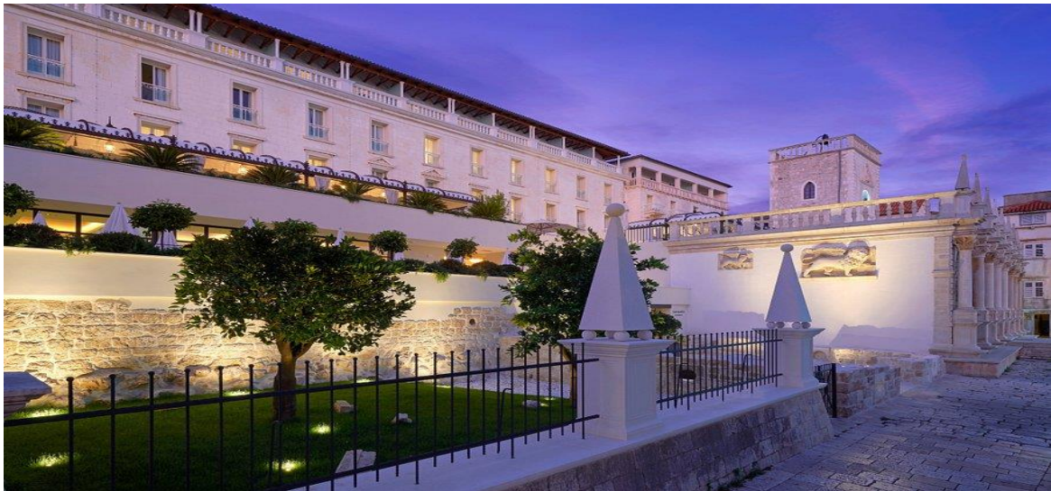
Slika 26. Palace Elisabeth Hvar Heritage Hotel