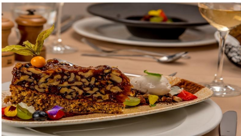
Slika 25. Hrapoćuša

U ovom se restoranu pripremaju i poslužuju mnogi deserti od kojih je svakako važno istaknuti tortu hrapoćušu (Slika 27.) iz bračkoga mjesta Dol koja sadržava orašaste plodove (biskvit), bjelanjke i orahe (nadjev).