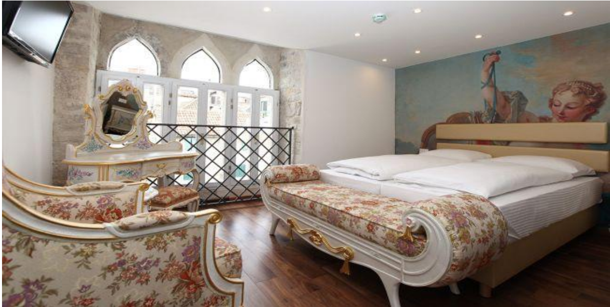
Slika 3. Interijer sobe Diocletian Heritage Hotel

Budući da su ovi hoteli smješteni u staroj građevini velike kulturne i povijesne značajnosti određenoj zemlji, njihova je važnost iznimno velika. Naime, hoteli preuređuju stara izdanja s ciljem njihova očuvanja, ali i privlačenja turista iz raznih dijelova svijeta.