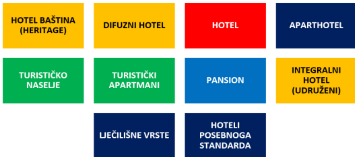
Slika 1. Deset temeljnih vrsta hotela

Postoji mnoštvo različitih podjela hotela, a prikazana je jedna od njih (Slika 1.)