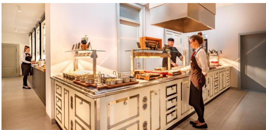
Slika 10. Gastro ponuda hotela Heritage Hotel Imperial

Sljedeći je obrok marena, koja se jede između 10 i 11 sati za koji se poslužuje fritaja s pršutom ili domaće kobasice, a nerijetko i sir i pršut te luk i kruh. Slijedi obed ili obid za vrijeme kojega se poslužuje gusta juha koja se naziva prema svom osnovnom sastojku (maneštra od bobiči, od koromača, od slanica). Također, specifičan je i grah s ječmenom kašom i kiselim kupusom, a svim se jelima dodaje začim imena pešt (mješavina sitno isjeckanog peršina, češnjaka i slanice). Uz ova se jela poslužuje razne salate, a najpoznatije su salata od mahuna (mošnjice na salatu) ili tikvica (cuketi na salatu) (Randić i Rittig-Beljak, 2006).