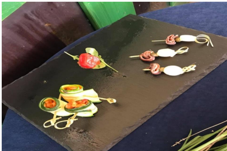
Slika 17. Specijalitet projekta Gastro-note Šibenika

Specijalitet je napravljen od pečenih tikvica sa šalšom i jadranskim kozicama te je začinjen s origanom, bosiljkom, paprom, soli, maslinovim uljem, češnjakom i lukom (Šibenski portal, 2021).