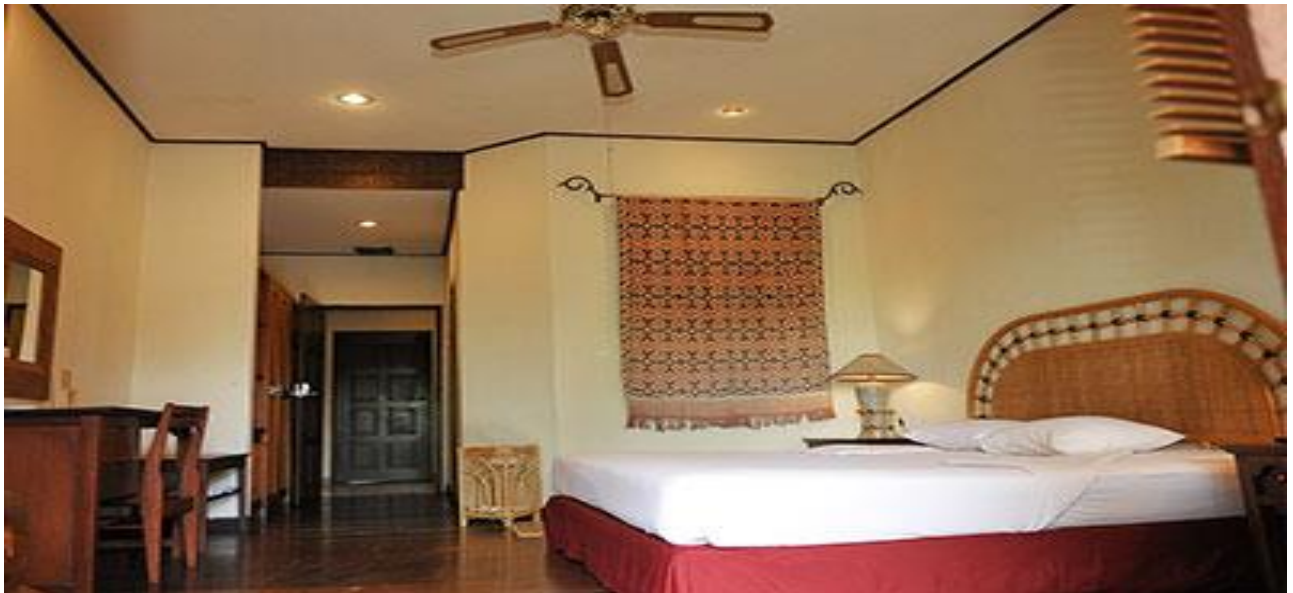
Slika 2. Soba Toraja Heritage Hotela

Smještajne jedinice ovoga hotela mogu biti: sobe, obiteljske sobe i hotelski apartmani (Galičić, 2017).