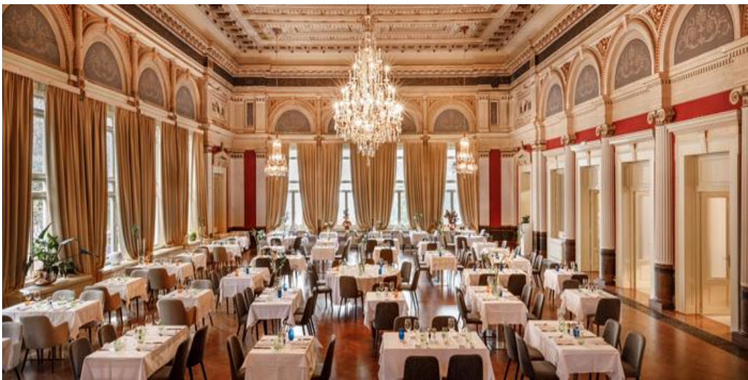
Slika 9. Zlatna dvorana Remisens Premium Heritage Hotel Imperial