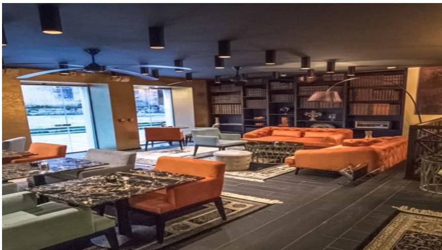
Slika 20. Heritage Hotel King Krešimir

Heritage Hotel King Krešimir smješten je na glavnome gradskome trgu grada Šibenika, u blizini UNESCO-ve katedrale sv. Jakova, a proglašen je najboljim malim hotelom u Hrvatskoj u 2018. godini. Hotel karakteriziraju udobnost i luksuz u 8 soba, i to standardnih, superior i povijesnih, s ukupno 14 kreveta (DLHV, 2022).