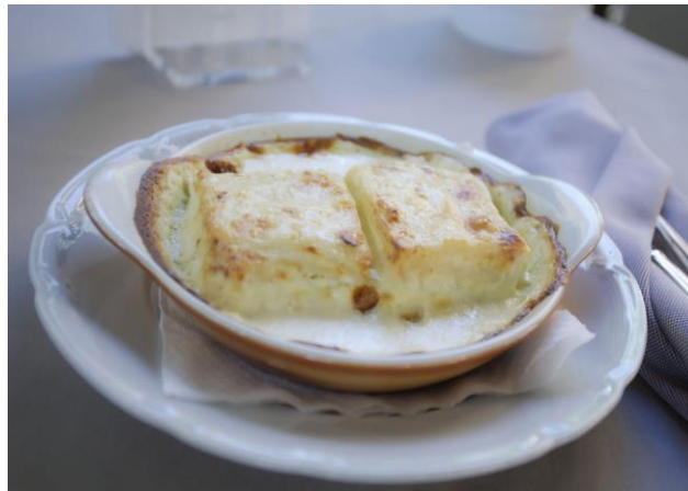
Slika 6. Tradicionalni štrukli