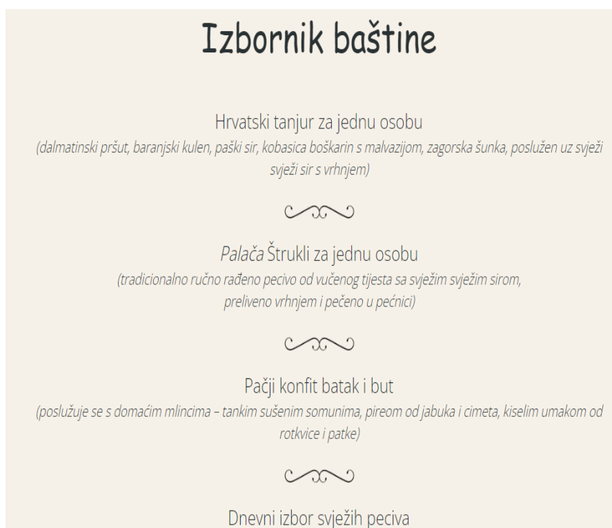
Slika 7. Jelovnik hotela Palace

Slika 7. prikazuje primjer jelovnika za jedan ručak u hotelu Palace.