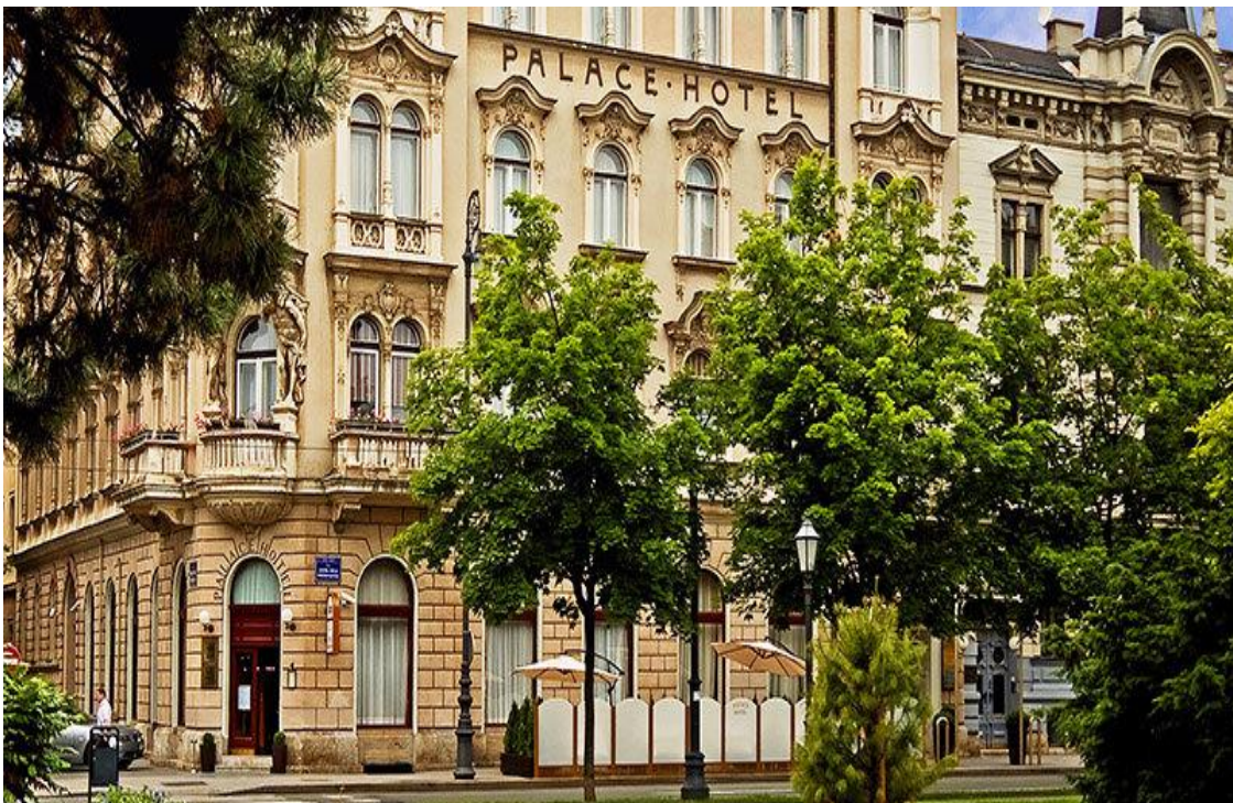
Slika 4. Pročelje Palace Hotela Zagreb

Palace hotel Zagreb smješten je u secesijskoj palači iz 1891. godine, ali s tradicijom gostoprimstva iz 1907. godine. Svatko tko boravi u ovome hotelu može doživjeti autentičan Zagreb koji oduševljava svojom ljepotom, šarmom i posebnosti (Visit Zagreb, 2022).