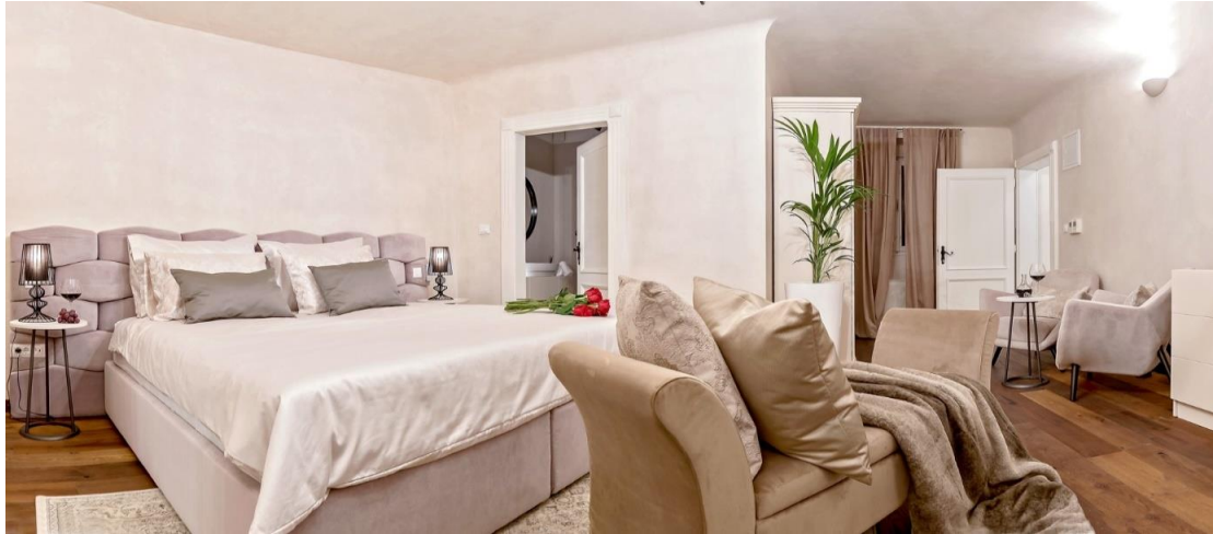
Slika 24. Soba u hotelu Puteus Palace