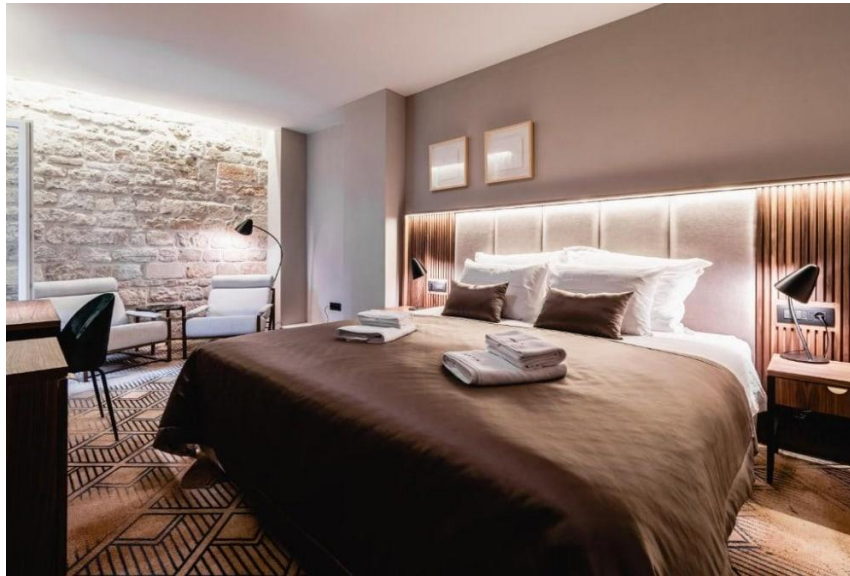
Slika 19. Soba u hotelu Armerun

S obzirom na inspiraciju lokacije (povijest), uređenje soba je u skladu s modernim retro stilom, toplim i prigušenim bojama, ali s naglaskom na prirodnoj teksturi kamena (Journal, 2021).