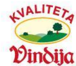
Slika 2. Logo poduzeća Vindija d.d.