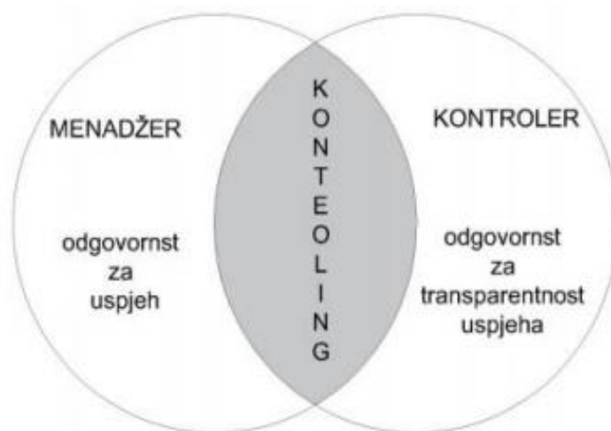
Slika 2. Odnos kontrolera i menadžera

Izvor: Osmanagić Bedenik N.: Kontroling – abeceda poslovnog uspjeha, Školska knjiga, Zagreb. 2007.