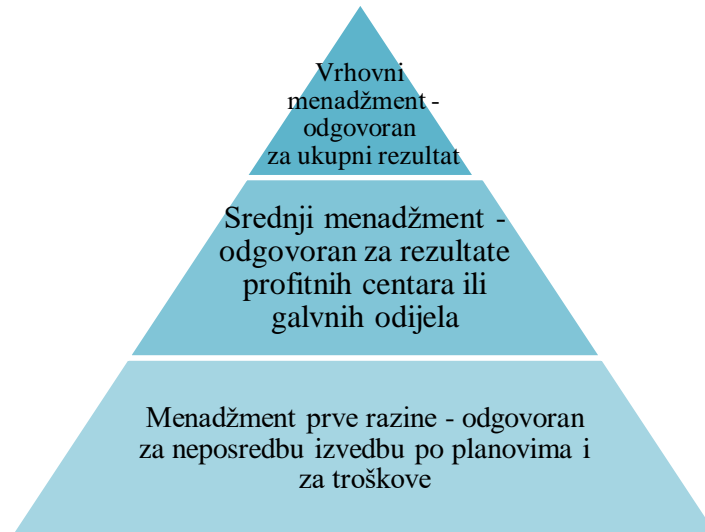
Graf 2. Razine menadžmenta