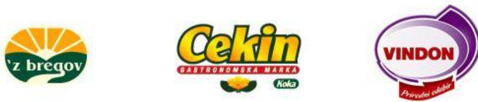
Slika 3. Logo: 'Z bregov, Cekin, Vindon

Izvor: http://www.vindija.hr/O-nama/Mediji/Logotipi.html , pristupljeno: 01.02.2021.