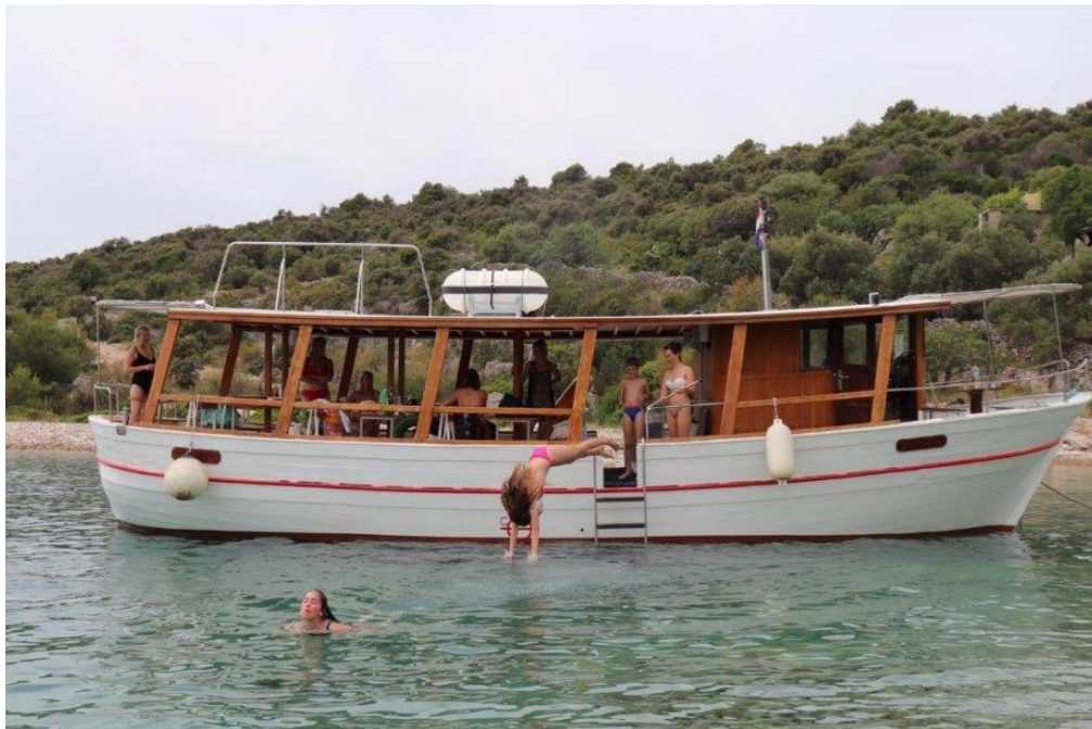
Slika 7 Plovilo za izlete

To je vrsta plovnog objekta koji omogućuje turistima usluge prijevoza za izlete koji započnu ujutro, a završavaju se predvečer. Ova vrsta plovnih objekata ne pruža usluge smještaja, ali može pružati ugostiteljske usluge (hrana, piće...).