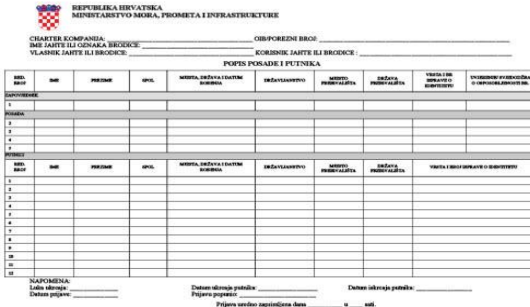
Slika 11 Popis posade (crew lista)

Povratni dokument nakon prijave treba ispisati, te se treba nalaziti na plovilu za vrijeme boravka turista. Osoba koja upravlja plovilom (skiper) dužna je ispis prijave predložiti nadležnim tijelima. Ukoliko ne postoji mogućnost prijave elektronski, pista se ovjerava u nadležnoj lučkoj kapetaniji ili ispostavi lučke kapetanije pa se naknadno unosi u bazu podataka. Podaci iz baze podataka dostupni su charter kompanijama za njihova plovila, a tijelima državne uprave dostupni su podaci za sva plovila svih charter kompanija.