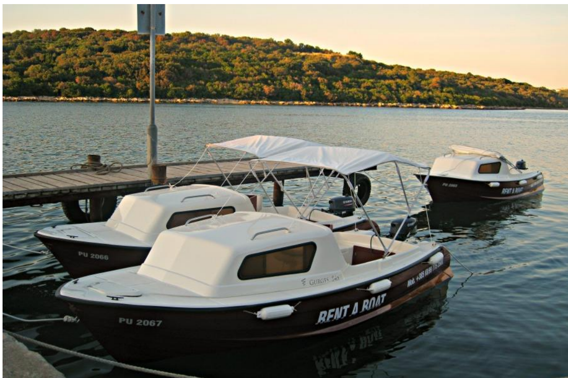
Slika 9 Plovila za najam bez usluga smještaja