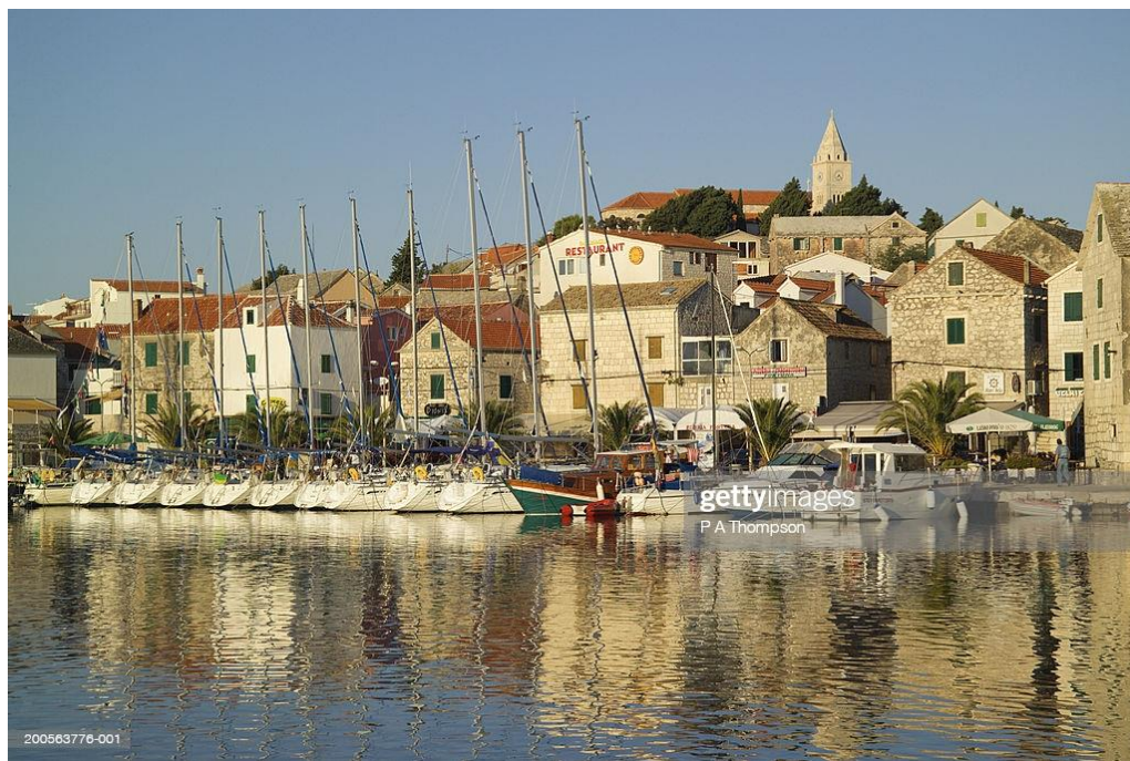
Slika 3 Nautičko sidrište