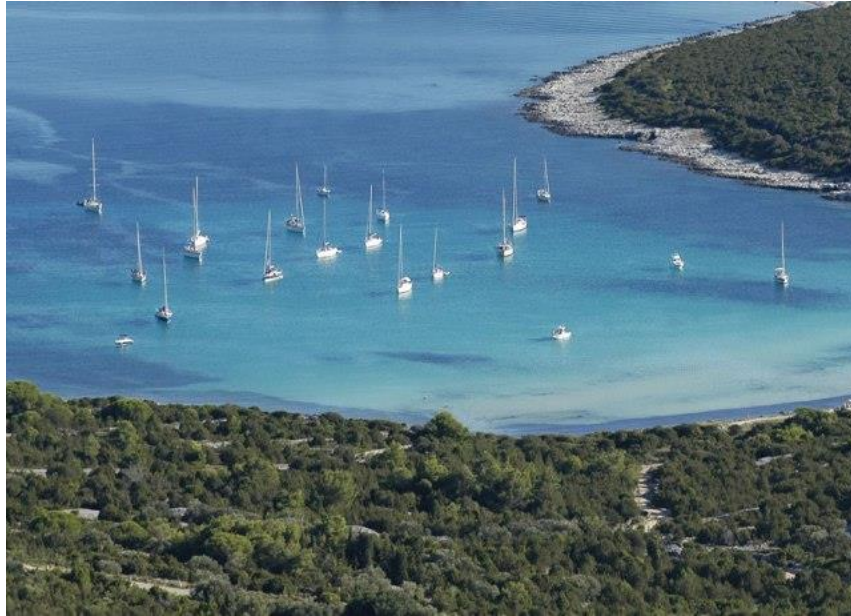
Slika 2: Sidrište, izvor: www.adriaticsailor.com

sidrišta nije dopuštena. Sidrište mora imati prostor koji ispunjava uvjete za sidrenje plovila.