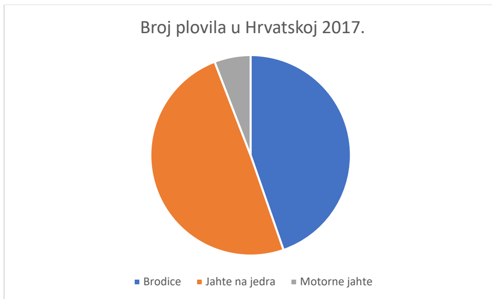
Graf 1: Broj plovila u Hrvatskoj 2017., Izrada autorice prema podacima: http://www.poslovni.hr/hrvatska/hrvatska-flota-od-4378-charter-plovila-najveca-je-na-svijetu-356504

U Hrvatskoj je 2017. plovilo preko 200 tisuća plovila, a morske luke su za rezultat imale ostvarenje prihoda od preko 850 milijuna kuna. Podaci iz 2017. godine pokazuju da charter flota u Hrvatskoj posjeduje 40% od ukupne svjetske charter flote, što Hrvatsku čini jednom od top destinacija za nautički turizam. Prema podacima Ministarstva mora, prometa i infrastrukture u RH je 2019. godine registrirano 2762 charter kompanije od kojih je 930 aktivnih. Hrvatske charter kompanije u svom posjedu imaju više od 1900 brodica, preko 2000 plovila na jedra i preko 200 motornih plovila.