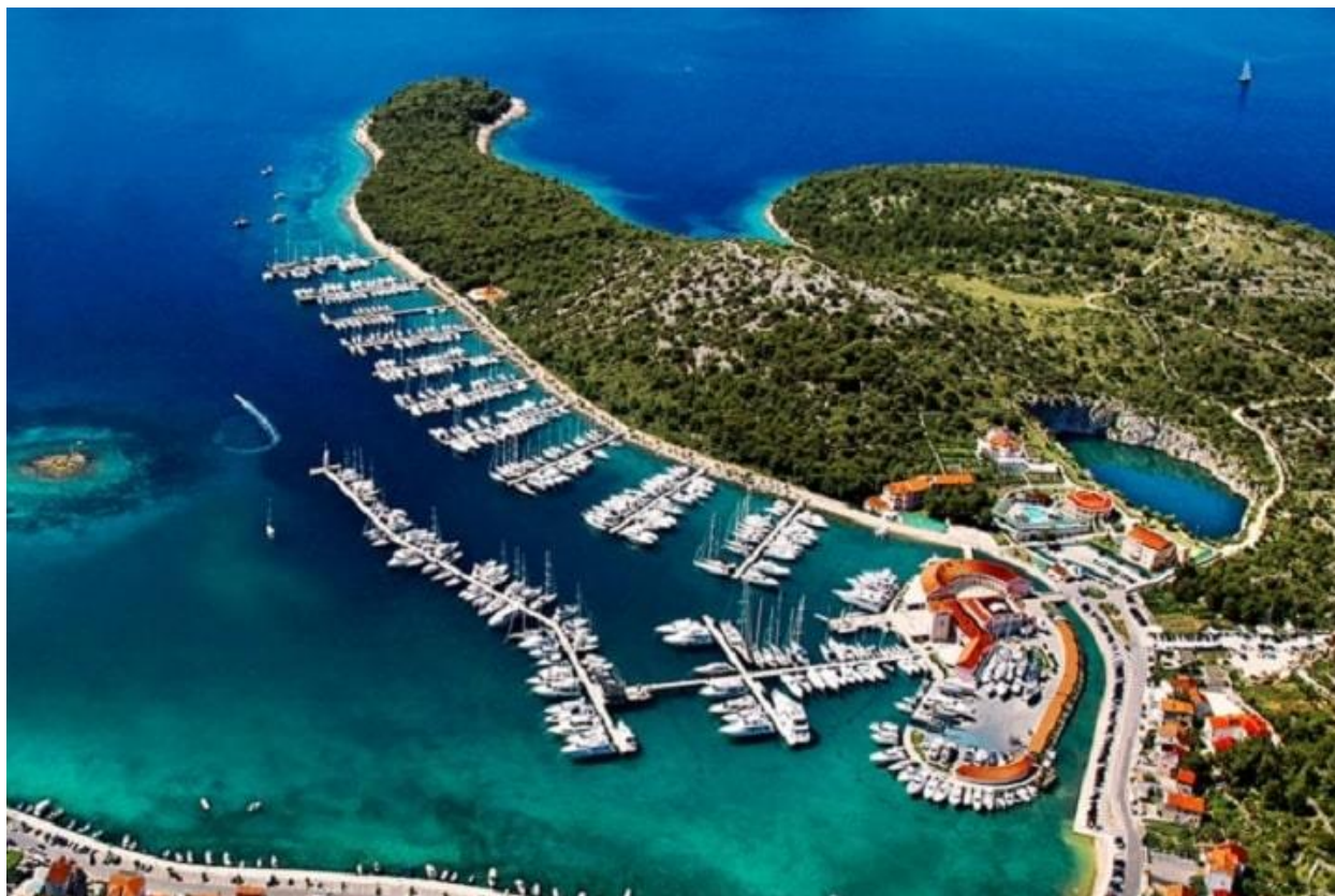
Slika 5 Marina, izvor https://myyachtzone.com/marinas/marina-frapa-rogoznica/