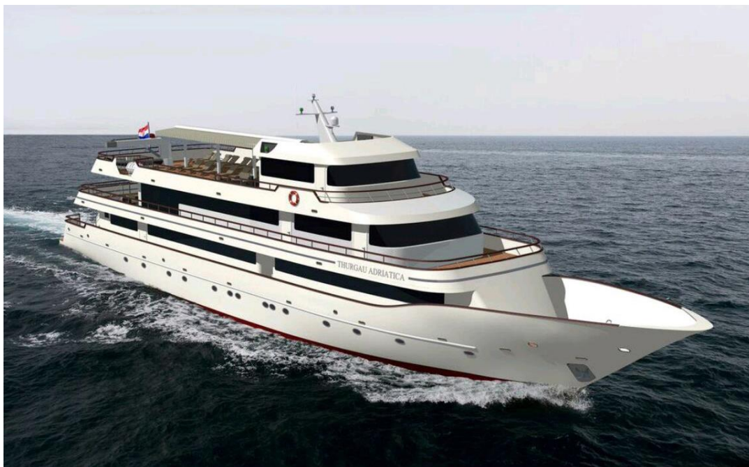
Slika 8 Plovilo za krstarenje