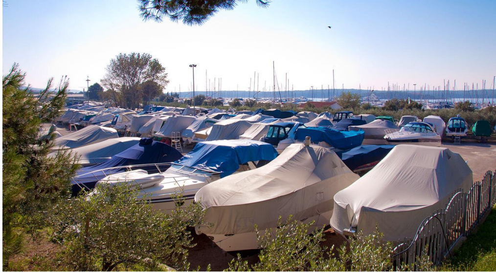
Slika 4 Suha marina, izvor: www.marina-punat.hr/vezovi-za-plovila/suha-marina/50

IV. Marine – vrsta vodenog prostora i obale uređen za pružanje veza i čuvanja plovila, te za boravak nautičara na plovilima ili drugim objektima u marini. Osim ovih usluga, u marinama se mogu pružati usluge servisa i popravka plovila kao i ugostiteljske usluge. Marine predstavljaju područja zaštićena od vjetrova i valova koja ispunjavaju potrebe nautičkog turizma. Osim ovih definicija, marine se mogu definirati i kao luke koje pružaju usluge veza i čuvanje plovila, ali se u njima mogu obavljati održavanje i servis koje rade osobe specijalizirane za tu djelatnost. Pravilniku o razvrstavanju i kategorizaciji luka nautičkog turizma marine se dijele na: