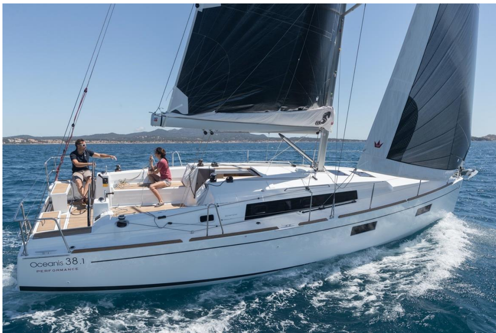
Slika 10 Plovila za najam sa uslugom smještaja

Postupci prilikom najma plovila su sljedeći 5 :