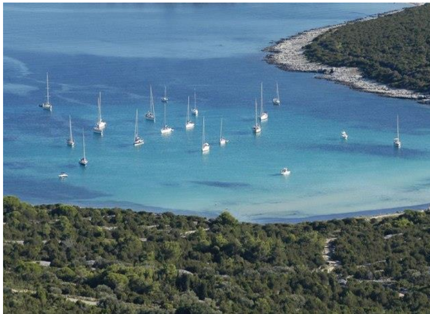
Slika 2: Sidrište, izvor: www.adriaticsailor.com

sidrišta nije dopuštena. Sidrište mora imati prostor koji ispunjava uvjete za sidrenje plovila.