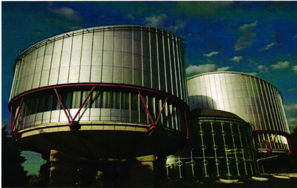
10 Slika 3. Europski sud za ljudska prava