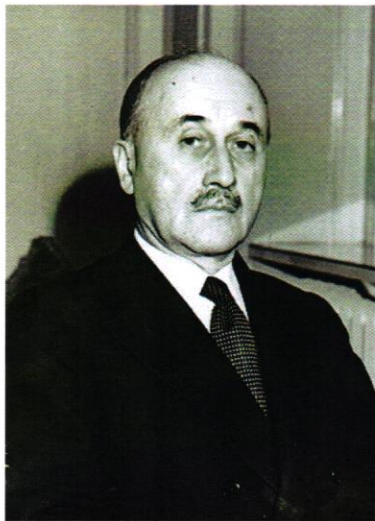
14 Slika 4. Jean Monnet

teoriji međunarodnih odnosa i pravnim statusom članica različitim od statusa, koji su nacionalne države imale i imaju u različitim međunarodnim organizacijama. 12 Izradio je gospodarski plan o ekonomskom oživljavanju i poslijeratnoj modernizaciji francuske industrije. Plan se između ostalog temeljio na tijesnoj suradnji s Njemačkom, prije svega na povezivanju njemačke i francuske industrije ugljena i čelika i njezinim stavljanjem pod upravu jedne nacionalne institucije. Tako je zahvaljujući tom planu integracije SR Njemačka obnovila svoju državnost te je mogla ostvariti svoju punu državnu suverenost. Da bi proces integracije bio uspješan bilo je važno stvaranje nadnacionalnih institucija koje su tijekom vremena preuzimale sve više nadležnosti institucija nacionalne države. Plan o stvaranju nadnacionalnih institucija Jean Monnet je predložio Robertu Schumannu koji ga je podržao te su ga zajednički razradili. Tada je nastao dokument poznat pod nazivom „Schumanova deklaracija” 13 .