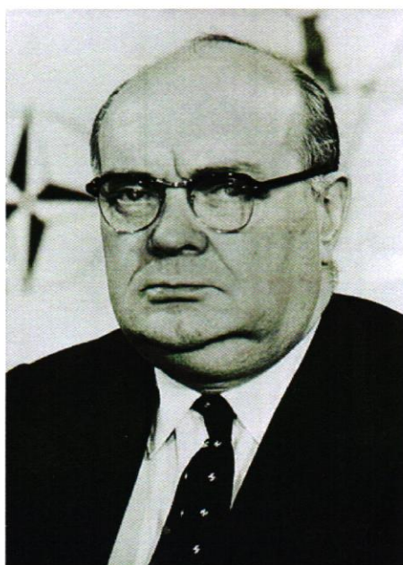
32 Slika 6. Paul-Henry Spaak