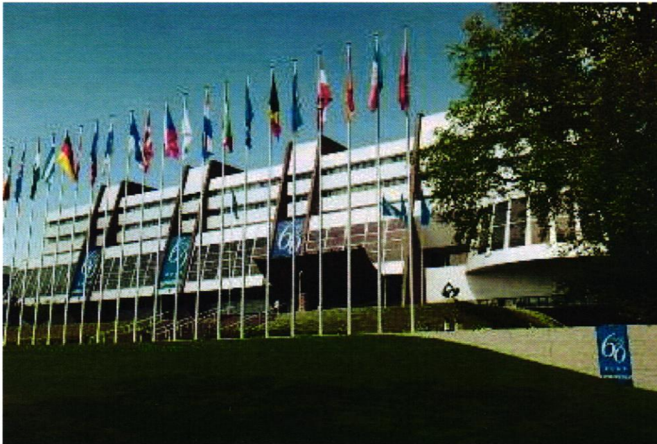
9 Slika 2. Vijeće Europe

podvrgnut mučenju, nečovječnom ili ponižavajućem postupku ili kazni, slobodu od ropstva, pravo na osobnu slobodu, sigurnost i pravičan postupak, slobodu od ex post facto zakona i kazni, pravo na privatan i obiteljski život, slobodu misli, savjesti i vjeroispovijesti, slobodu izražavanja i mirnog okupljanja, pravo na sklapanje braka i zasnivanje obitelji. Radi osiguranja poštivanja obveza koje su države članice preuzele Konvencijom uz Vijeće osnovan je i prvi stalni međunarodni sud pod nazivom Europski sud za ljudska prava.