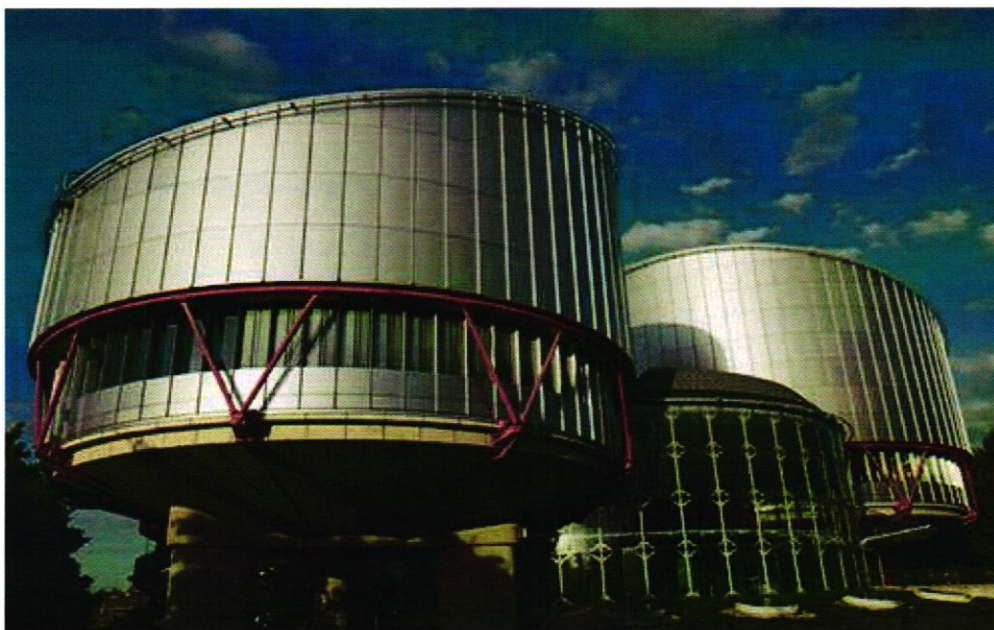
10 Slika 3. Europski sud za ljudska prava