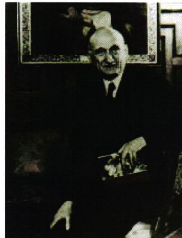
15 Slika 5. Robert Schuman