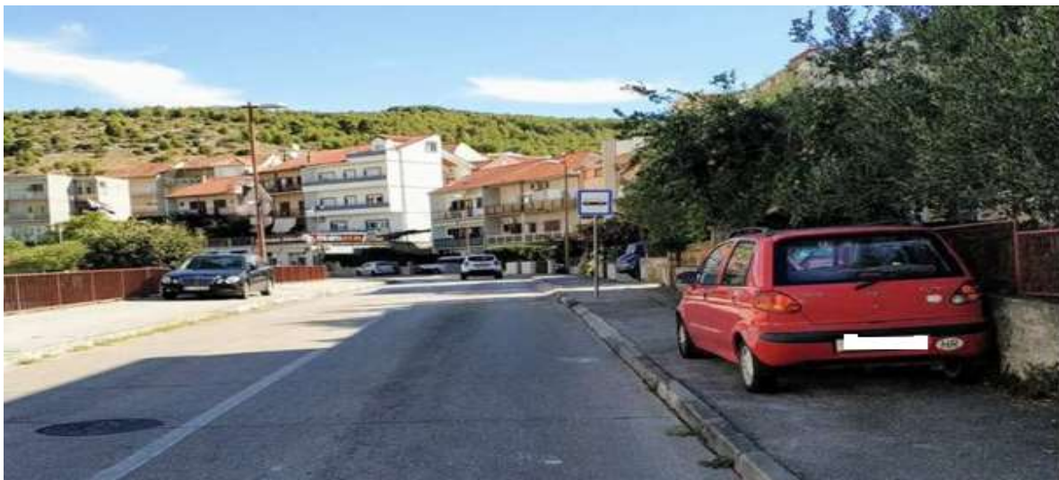
Slika 11. Parkiranje na nogostupu u Šibeniku

Slika 11. prikazuje ulicu iznad Osnovne škole Vidici. Gledajući ovu sliku postavlja se pitanje kako će dijete koje ide u školu (ili iz škole kući) ili, pak, roditelj s dječjim kolicima, proći ovim nogostupom, a da ne izađe na cestu, a odgovor je na ovo pitanje svima jasan.