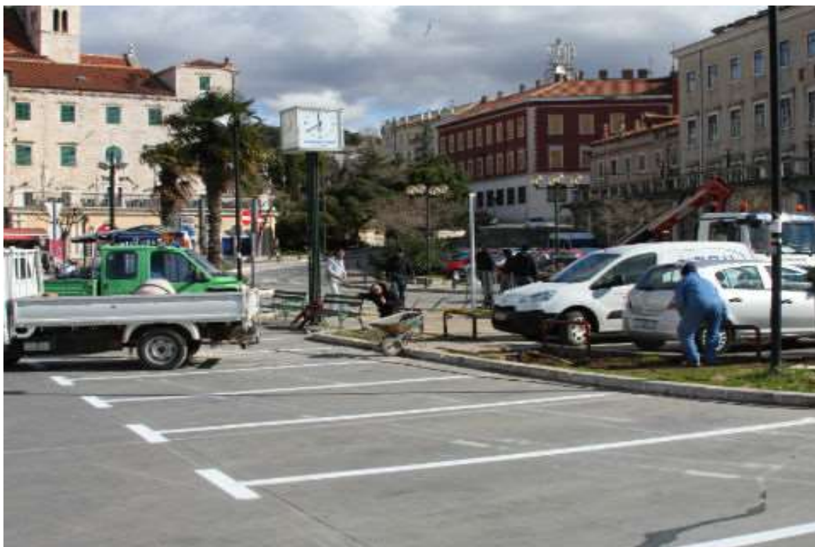
Slika 6. Parkiralište na mulu Krke u Šibeniku

Tablica 1. prikazuje parkirališne zone u gradu Šibeniku kao i cijene parkiranja.