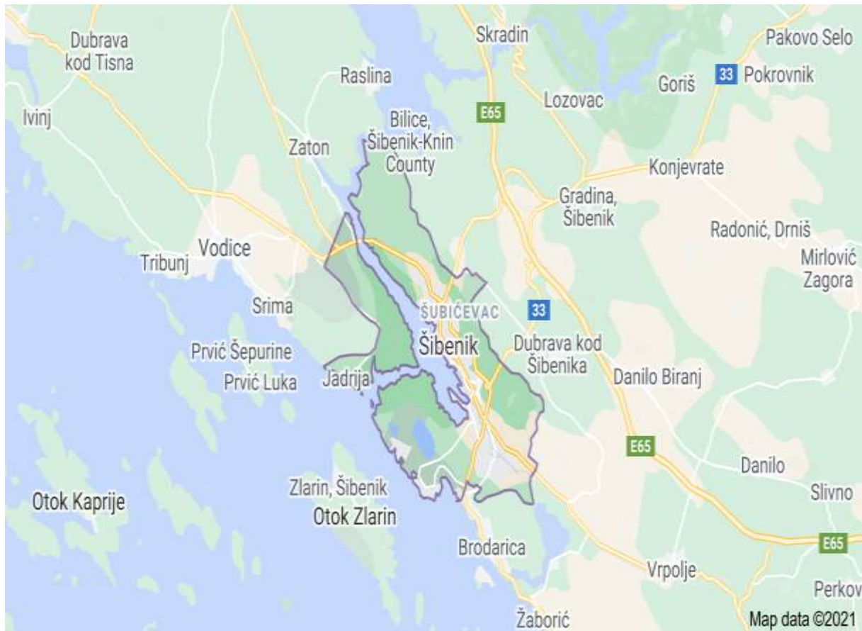
Slika 2. Grad Šibenik na karti Republike Hrvatske

mediteranska klima s vrućim ljetima te suhim i blagim zimama.. Ovaj su grad utemeljili Hrvati prije više od tisuću godina, što ga čini najstarijim hrvatskim samorodnim gradom na Jadranu (NEFRO2020, 2021.).