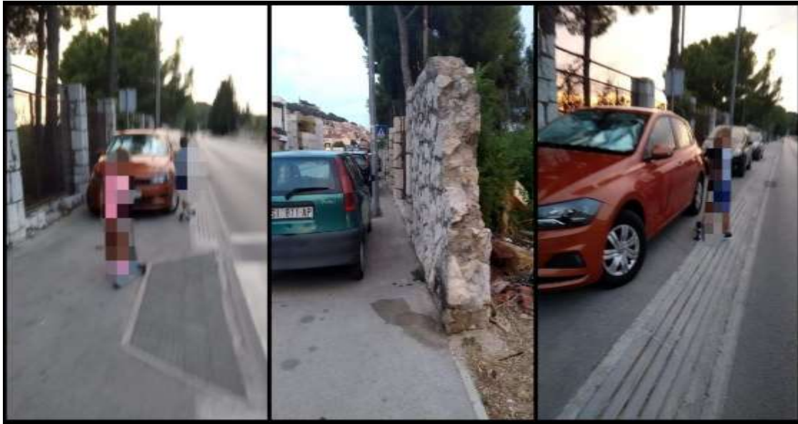
Slika 10. Parkirana vozila na nogostupu u Šibeniku

Slika 11. prikazuje ulicu iznad Osnovne škole Vidici. Gledajući ovu sliku postavlja se pitanje kako će dijete koje ide u školu (ili iz škole kući) ili, pak, roditelj s dječjim kolicima, proći ovim nogostupom, a da ne izađe na cestu, a odgovor je na ovo pitanje svima jasan.