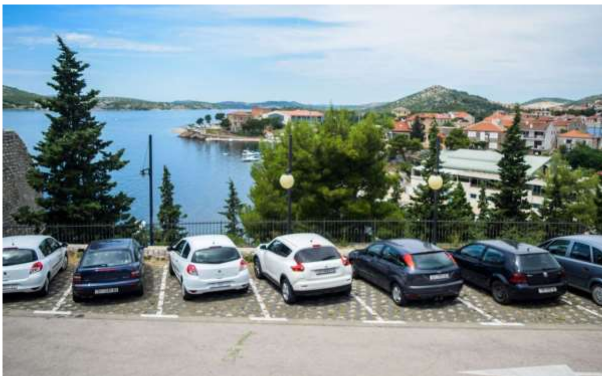
Slika 5. Parkiralište Sv. Nediljica u Šibeniku

Sljedeći veliki projekt Gradskog parkinga d.o.o. Šibenik bio je 2008. godine kada je uređeno sezonsko parkiralište u TEF-u. Naime, ova je lokacija idealna iz razloga što je taj dio grada turistički aktivan, tj. udaljen je samo pet minuta hoda od šibenskog Doca do kojega se može doći kroz uvalu Pekovac koja pruža prekrasan pogled na grad Šibenik. Zatim, u veljači 2015. godine Gradski parking d.o.o. Šibenik otvara parking na tzv. Mulu Krke,(slika 6.), koji ima rampu i kućicu za naplatu parkiranja. Budući da je šibenska riva vrlo posjećena i atraktivna, ovo je parkiralište pun pogodak za grad Šibenik, a ovo parkiralište ima 38 parkirnih mjesta. Osim naplate parkiranja za cestovna vozila, Gradski parking Šibenik je iste te godine preuzeo naplatu privežišta na šibenskoj rivi.