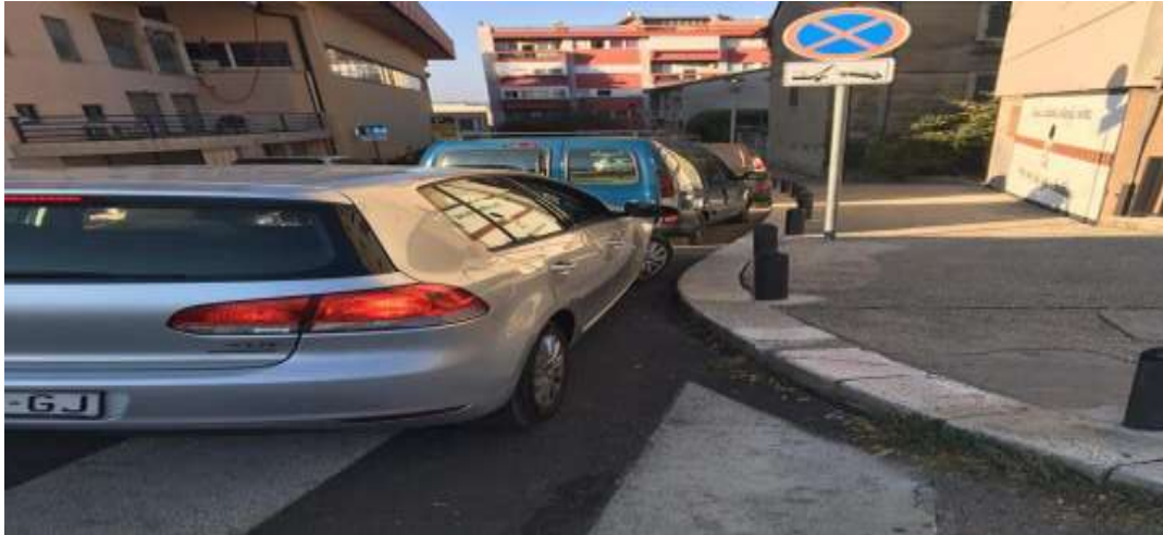
Slika 9. Npropisno parkiranje u Šibeniku, Izvor:

https://www.google.hr/url?sa=i&url=https%3A%2F%2Fsibenik.rocks%2F34%2Fsibenik-grad-koji-ne-misli-na-pjesake&psig=AOvVaw15bpOXgo4KfkqD-ZJDzchX&ust=1615610302624000&source=images&cd=vfe&ved=0CAIQjRxqFwoTCJCl46vwqu8CFQAAAAAdAAAAABAD (11.03.2021.)