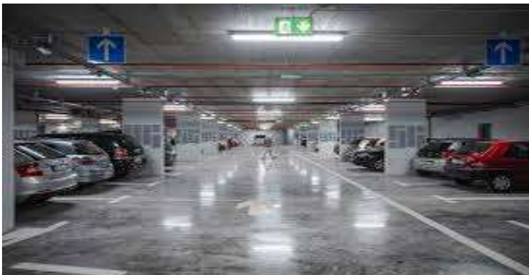
Slika 13. Podzemna garaža Poljana

Nažalost, iako Trg sada služi kao šetalište, a ne više kao parkiralište, a ispod se nalazi i parkiralište, izgleda da ni ova podzemna garaža nije idealno rješenje za problem parkiranja u gradu Šibeniku. Iako se njome dobilo mnogo parkirnih mjesta, prošle se godine javio problem s prokišnjavanjem zbog čega su se vozači svakako „odvukli“ od parkiranja u ovoj garaži.