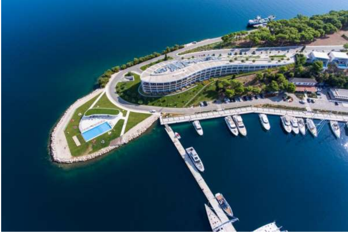
Slika 4. Hotel D-resort Šibenik

Ovaj hotel raspolaže sa 63 luksuzno opremljenih soba, pet deluxe i jednog predsjedničkog apartmana te tri ekskluzivne vile (Hotel D-resort Šibenik, 2021.).