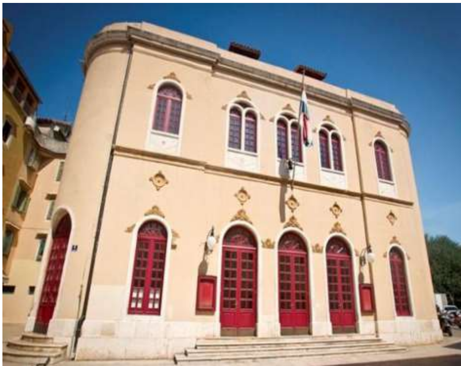
Slika 3. Hrvatsko narodno kazalište u Šibeniku