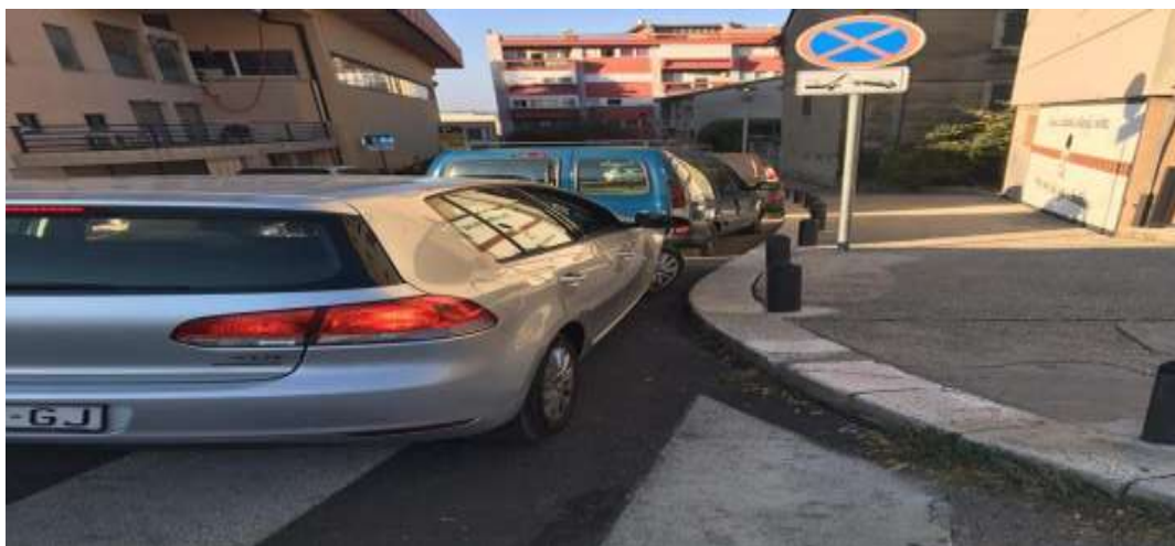
Slika 9. Npropisno parkiranje u Šibeniku, Izvor:

https://www.google.hr/url?sa=i&url=https%3A%2F%2Fsibenik.rocks%2F34%2Fsibenik-grad-koji-ne-misli-na-pjesake&psig=AOvVaw15bpOXgo4KfkqD-ZJDzchX&ust=1615610302624000&source=images&cd=vfe&ved=0CAIQjRxqFwoTCJCl46vwqu8CFQAAAAAdAAAAABAD (11.03.2021.)