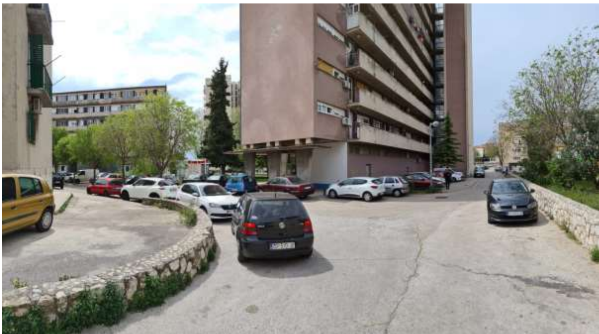
Slika 7. Problem parkiranja u kvartu Baldekin

Dakle, osim svakodnevnih vozila stanara tih zgrada, ovdje svoja vozila ostavljaju i studenti te djelatnici veleučilišta i osnovne škole. Također, ovdje se nalazi i, vrlo posjećeno, dječje igralište te se javlja problem prelaska djece preko ceste. Navedeni se problem javlja jer, od parkiranih vozila, dijete ne može pregledno vidjeti dolazi li koje vozilo, a tako ni vozač ne može vidjeti dijete. Stoga je ova situacija, prvenstveno, vrlo opasna za odvijanje prometa. Osim toga, stanari zgrada često nemaju gdje parkirati svoje vozilo zbog „povremenih“ vozila, a u blizini je i trgovina što znači još veći protok vozila.