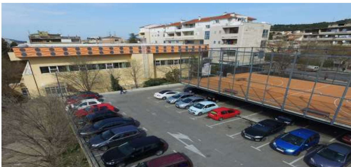
Slika 8. Parkiralište kod dvorane Baldekin

Nedaleko od spomenutog područja, nalazi se i sportska dvorana Baldekin kod koje je prije nekoliko godina izrađeno parkiralište koje je prikazano na prethodnoj slici. Međutim, primijećeno je kako svi vozači traže besplatna parkirališna mjesta što za posljedicu ima da su neka uređena parkirališta koja se naplaćuju poluprazna, ali su zato nogostupi ili dijelovi kolnika na koje se ne smije parkirati puni. Na Slici 9. se može vidjeti ulica koja se nalazi 100-ak metara od prethodno prikazanog parkirališta.