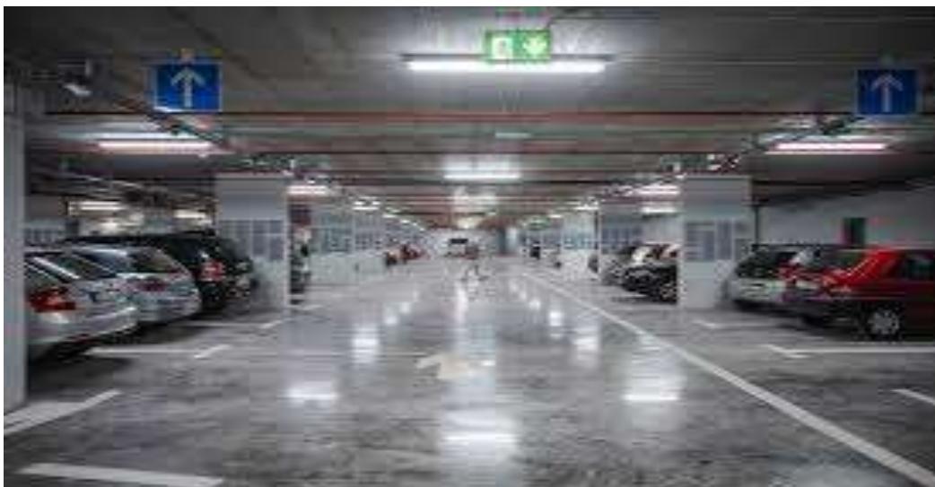
Slika 13. Podzemna garaža Poljana

Nažalost, iako Trg sada služi kao šetalište, a ne više kao parkiralište, a ispod se nalazi i parkiralište, izgleda da ni ova podzemna garaža nije idealno rješenje za problem parkiranja u gradu Šibeniku. Iako se njome dobilo mnogo parkirnih mjesta, prošle se godine javio problem s prokišnjavanjem zbog čega su se vozači svakako „odvukli“ od parkiranja u ovoj garaži.