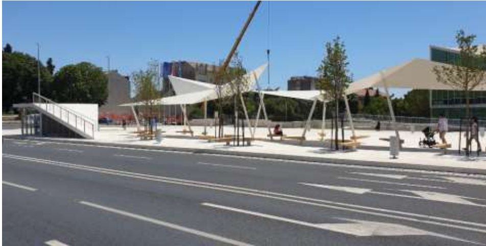
Slika 12. Gradski trg Poljana u Šibeniku