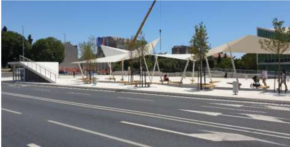
Slika 12. Gradski trg Poljana u Šibeniku