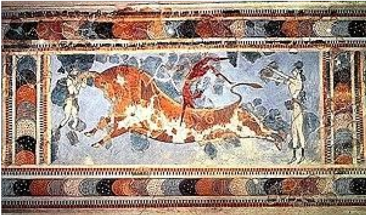
Slika 8. Borbe s bikovima

predmete, kao što su lopte, batovi, štapovi, kugle, ploče, itd. Posebno izgrađeni prostori, kao što su igrališta i borilišta, služili su za održavanje natjecateljskih aktivnosti. Otok Kreta najstarije je nalazište igrališta, odnosno borilišta s gledalištima iz razdoblja između 2600. i 1100. godine pr. Kr. Za kretsku (minojsku) kulturu osobito su karakteristične igre s bikovima (vidi sliku 8. ) (Hrvatska enciklopedija 2020).