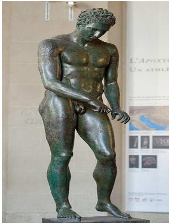
Slika 9. Hrvatski apoksiomen

Odgaj u Ateni razlikovao se od spartanskog odgoja, od kojeg je bio bogatiji i raznovrsniji. Mladež je odgajana u palestru , mjestu namijenjenom tjelesnom odgoju mladića. U 5. st. pr. Kr. dva velika gimnazija postaju središta sportskog odgoja koji se pojavljivao u dva oblika ( gimnastika i agonistika ). Gimnastika je služila za usavršavanje ličnosti te vojni odgoj, dok je agonistika omogućavala postizanje što boljih rezultata. Aktivnosti karakteristične za Stare Grke bile su: trčanje na kraće i duže staze, bacanje diska i koplja, skokovi u dalj s bučicama, hrvanje te boks. Stari Grci uveli su discipline pankratlon (kombinacija boksa i hrvanja) te pentatlon (petboj: trčanje, skakanje, bacanje diska i koplja te hrvanje). Grci su u čast boga Zeusa na Olimpu održavali svečanosti na kojima su se odvijala natjecanja. Dokaz da su Grci voljeli natjecanja brojne su sačuvane skulpture koje prikazuju antičke atlete, kao na primjer Apoksiomen koji je pronađen u moru kraj Lošinja (vidi sliku 9. ) (Hrvatska enciklopedija 2020).