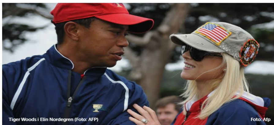
Slika 5: Afera poznatog golfera na naslovnici Dnevnik.hr