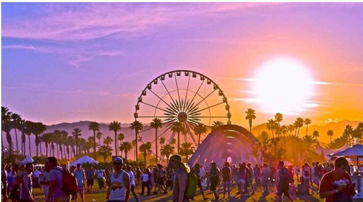
Slika 4: Coachella

Tekstovi psihodeličnog značenja koji se generiraju kroz elektroničku glazbu pokušavaju odvojiti duh od tijela kao kreativni duh koji se javlja iz sodome i gomore čija je svrha uhvatiti duh slobode i pozivati se na umjetnost.