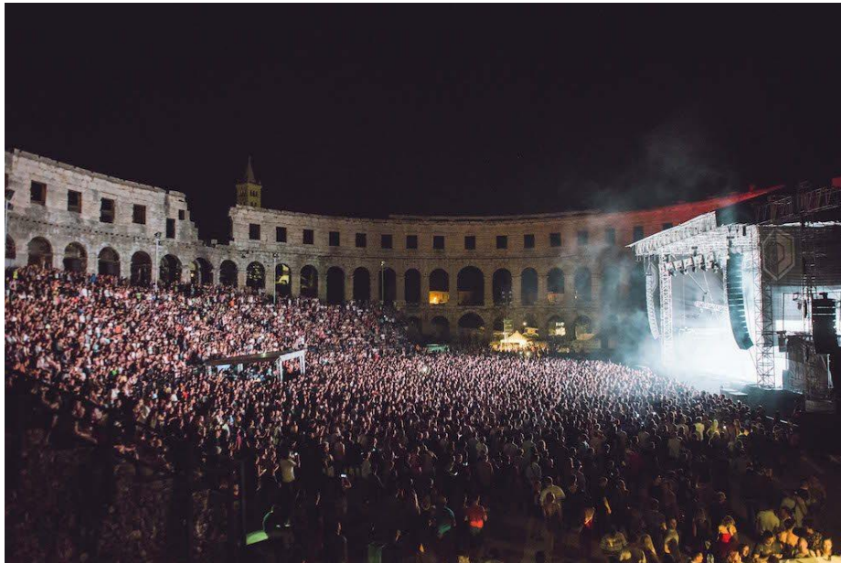
Slika 11. Dimensions

Dimensions festival u svojim pet godina postojanja postao je ultimativni cilj za pronicljive ljubitelje glazbe širom svijeta. Beskompromisan odabir izvođača, divan jadranski ambijent i prijateljski ugođaj temelji su koji čvrsto drže ugled ovog festivala bez premca. Centralna lokacija festivala, 200 godina stara tvrđava Punta Christo, intiman je labirint pozornica i prolaza obogaćenih najboljim svjetskim razglasima u nevjerojatnom okruženju mora i šume, tik uz festivalski kamp Brioni. Uz dnevnu pozornicu na plaži, zabave na brodovima i niz radionica posjetitelji mogu naći balans između dnevne i noćne strane Dimensions festivala. Održava se krajem kolovoza i traje 4 dana. Cijena ulaznice ove godine iznosila je 850 kn što za mnoge posjetitelje ne predstavlja problem zbog velikog broja posjetitelja koji iz godine u godinu raste.