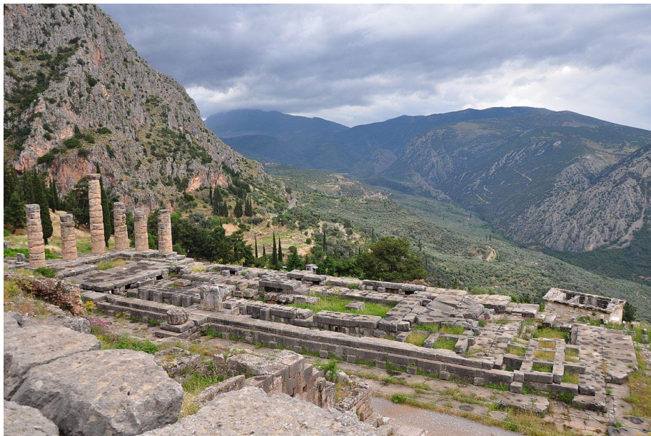
Slika 1: proročište Delfi

Putovanja motivirana zadovoljstvom javljaju se u antičkom dobu, a to su: Olimpijske igre u Grčkoj (776. godine p.n.e.), proročište Delfi, putovanja u Rim, Japan, Kinu.