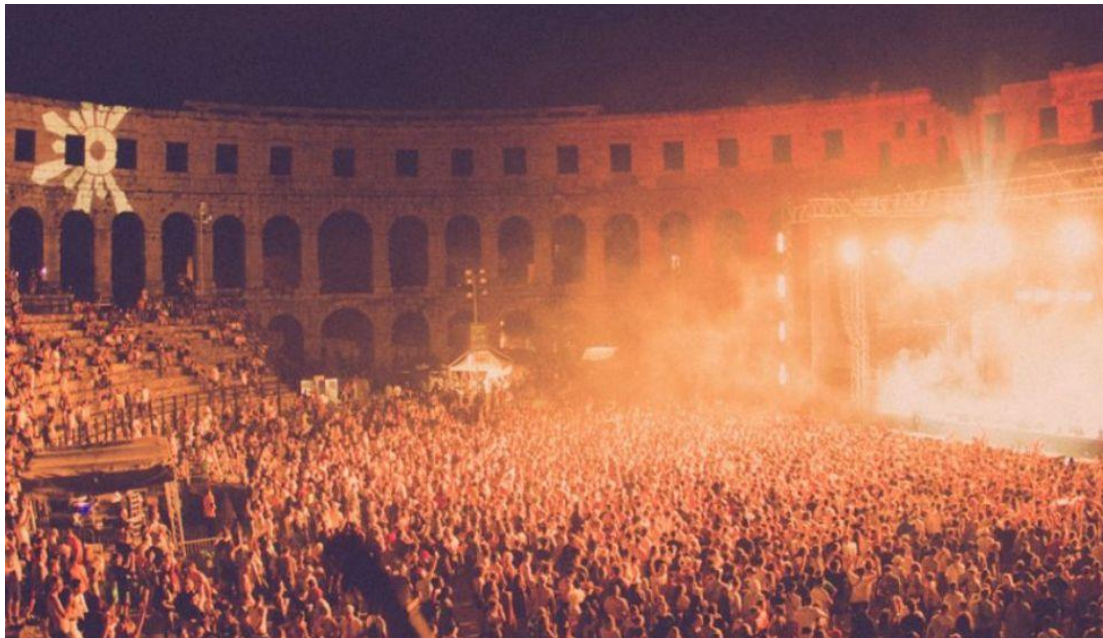
Slika 10. Outlook festival

Outlook festival, jedan je od vodećih svjetskih festivala bass glazbe i sound system kulture, svako ljetno vraća na prekrasnu hrvatsku obalu te dovodi mnogobrojne izvođače koji spadaju u sam vrh dub, reggae, hip-hop, drum'n'bass, garage, dubstep, house i srodne glazbene scene. Festival započinje koncertom u dvije tisuće godina staroj pulskoj Areni, veličanstvenom okolišu u kojem će se u jedinstveno koncertno iskustvo spojiti s ljubavlju očuvana antička arhitektura i vrhunska glazbena produkcija. Već četiri godine zaredom se održava u Štinjanu, krajem kolovoza te traje 4 dana. Najveći broj posjetitelja dolazi iz Engleske od kuda i potječe taj festival. Organizatori su nakon prvog održavanja u Štinjanu uvidjeli pozitivne ocjene od posjetitelja te su odlučili da se festival još neko vrijeme održava u Štinjanu.