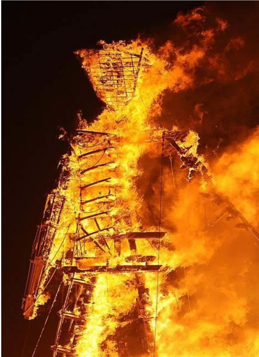
Slika 6: Burning man