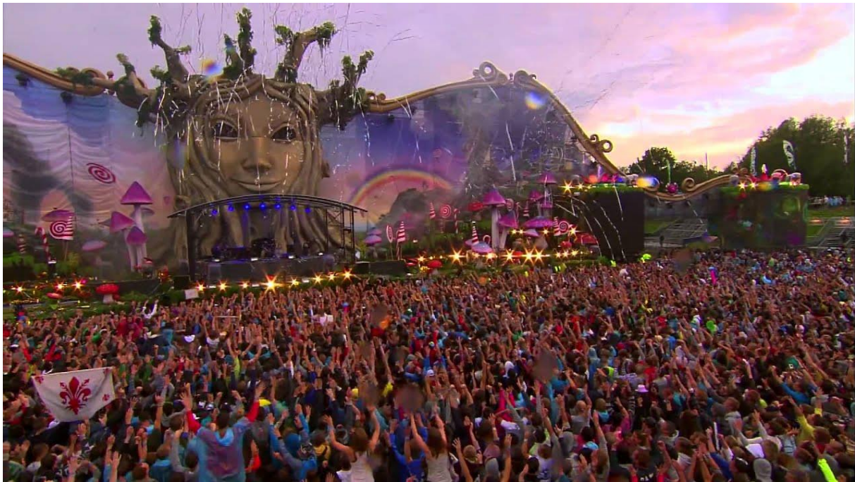
Slika 5: Tomorrowland