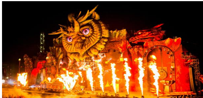
Slika 7: Ultra Europe Split

Ultra Europe festival u Splitu je najveći glazbeni festival i u Hrvatskoj te doni velike prihode i korisiti destinaciji i okolnim gradovima. Jedan takav kulturi proizvod danas je približen masama pa je kultura suočena sa problematikom komodifikacije koja se odvija na svim razinama. Stvaranje popularne elektroničke i komercijalne glazbe koja privlači veliki broj posjetitelja pa sve do visoke cijene ulaznica te konzumiranje dodatnih sadržaja na festivalima kao što su hrana, piće te drugi sadržaji. Takvi festivali nose sa sobom i niz negativnih učinaka kao što je povećanje konzumiranja opijata što vrlo loše utječe i na lokalno stanovništvo. Problematika je i u tome što se takvi festivali održavaju većinom u ljetnom razdoblju. Država bi tu trebala više ulagati u kulturni turizam jer je ona vrlo važan čimbenik poticanja upravo tog kulturnog turizma, iako država ne pronali kulturu kao gospodarsku kategoriju.