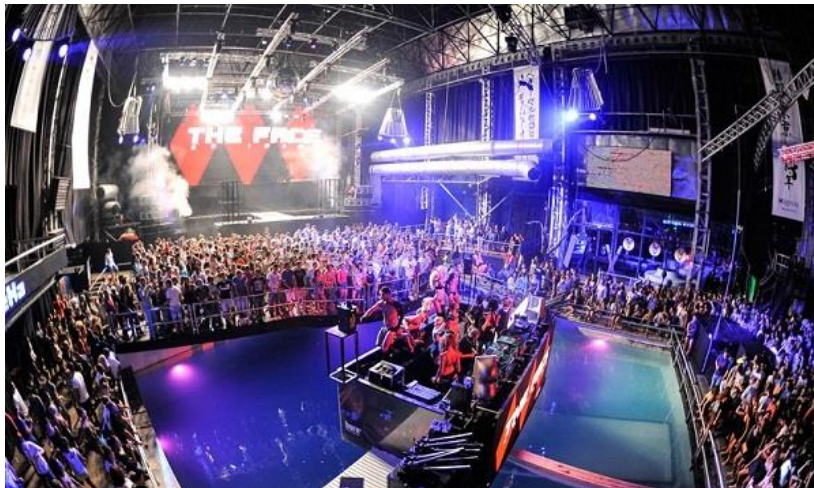
Slika 3: Ibiza festival

“To mjesto posjeduje nešto posebno, 24 satno partijanje, melting plot kultura, dok su istovremeno svi ujedinjeni pod rastućom globalnom religijom house glazbe” (Shrik, 2002).