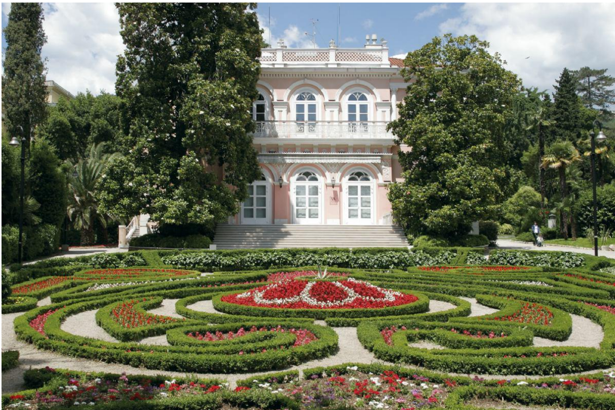
Slika 2: villa Angiolina, Opatija

1884. godine izrađena je villa Angiolina u Opatiji koja se smatra pokretačem intenzivnijeg razvoja turizma u Hrvatskoj, 1889. godine Opatija je proglašena lječilištem te je tako postala popularna zimska destinacija imućnijih gostiju iz Austro-Ugarske, ali i drugih zemalja Europe. Ubrzo su i druge, danas popularne destinacije dobile status primorskih ljetnih odmarališta kao što su Crikvenica, Rab, Lovran, Hvar, Kraljevica i Lošinj.