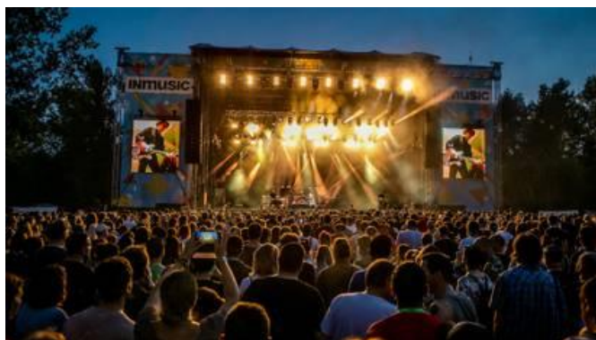
Slika 9. Inmusic festival