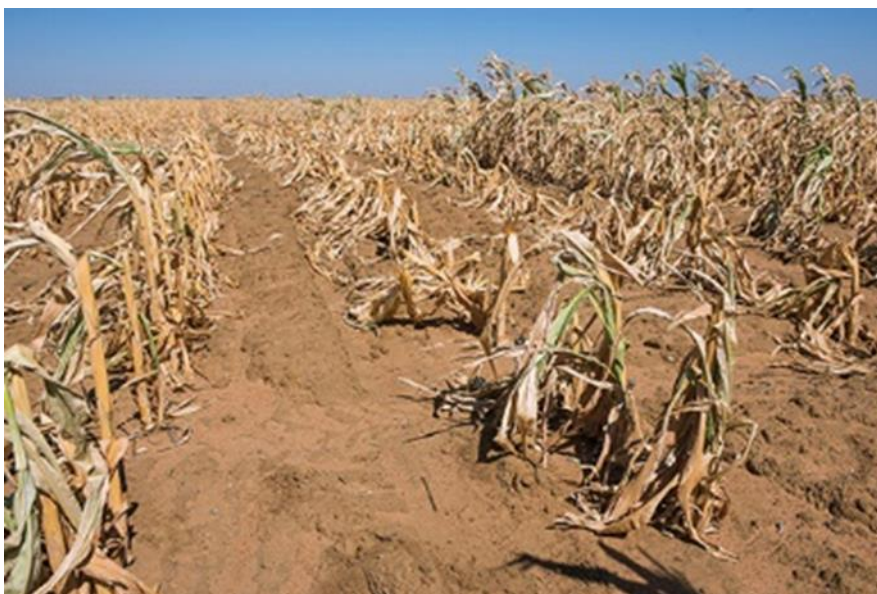
Slika 6: Suša koja je uništila poljoprivredne usjeve