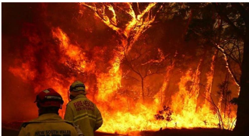
Slika 3: Apokaliptični prizori iz Australije.