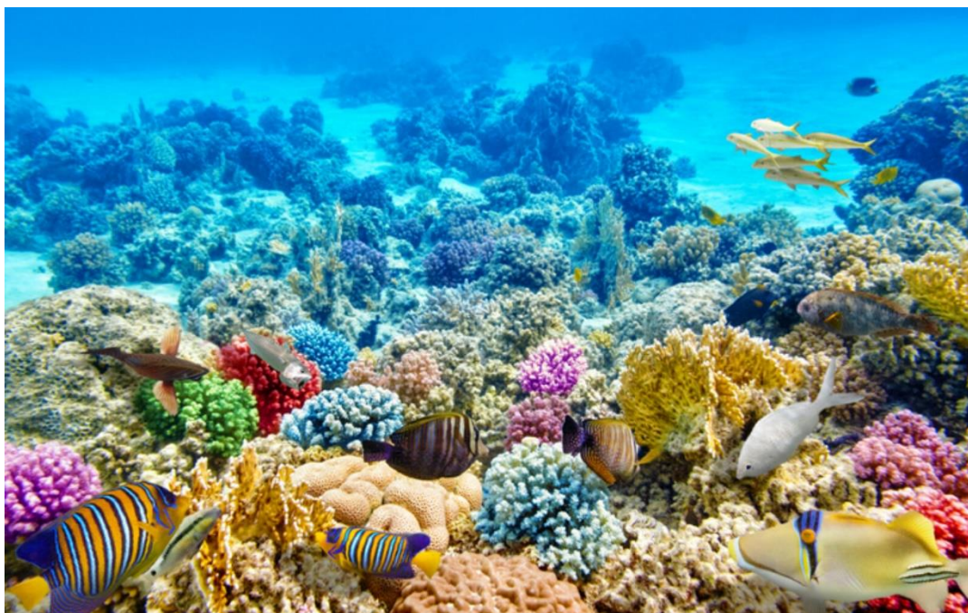
Slika 7: Propadanje koraljnih grebena zbog povišene temperature mora.