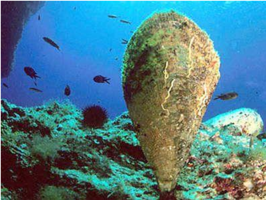
Slika 9: Zaštićena plemenita periska.