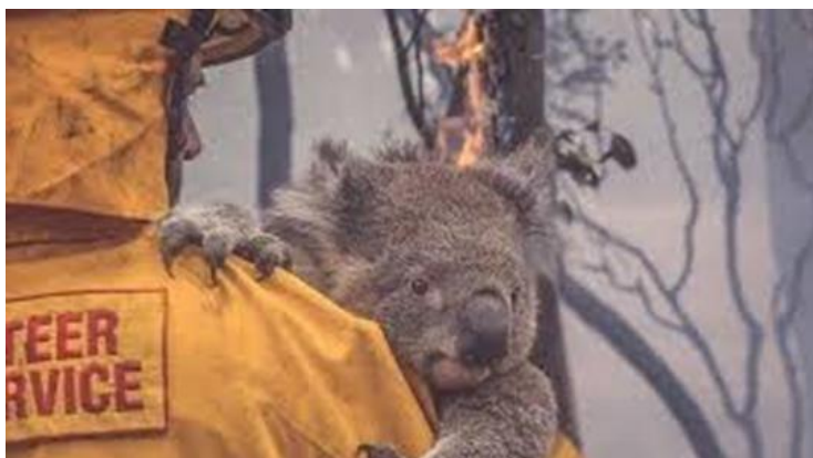
Slika 2: Najugroženija vrsta Australije - koale.