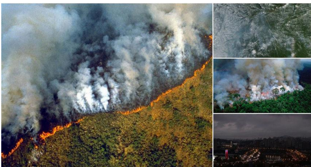
Slika 1. Požari u amazonskoj prašumi koji se vide iz Svemira.