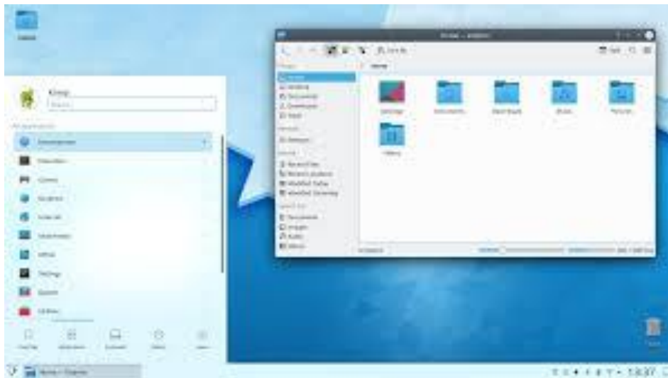
Slika 5: Prikaz KDE Plasma Desktop enviromenta

KDE Plasma Desktop 5 je zadani desktop enviroment na mnogim Linuxovim distribucijama, kao što su Fedora KDE Plasma Desktop Edition , KDE neon , KaOS , Kubuntu , Manjaro KDE Edition , Netrunner , PCLinuxOS , openSUSE i Solus Plasma .