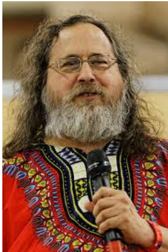
Slika 2: Richard Stallman

Torvaldsovo mišljenje o toj kontroverzi, kada je upitan je li upotreba imena GNU/Linux opravdana: „Well, I think it's justified, but it's justified if you actually make a GNU distribution of Linux ... the same way that I think that " Red Hat Linux " is fine, or " SUSE Linux " or " Debian Linux ", because if you actually make your own distribution of Linux, you get to name the thing, but calling Linux in general "GNU Linux" I think is just ridiculous.“ 60