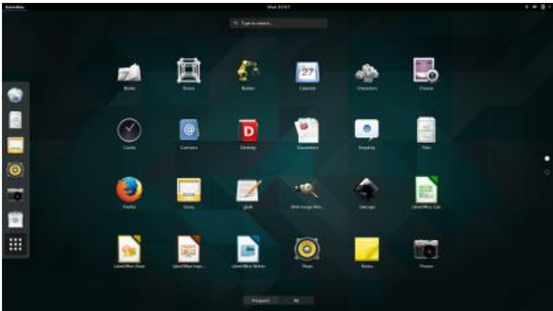
Slika 4: Prikaz GNOME desktop environmenta

Projekt GNOME su pokrenuli 15. kolovoza 1997. Miguel de Icaza i Federico Mena kao projekt izrade besplatnog softwera za Desktop environment i aplikacija za isti. Današnja iteracija GNOME -a, GNOME 3 je zadani desktop environment za mnoge distribucije Linuxa, kao što su: Fedora , Debian , Ubuntu , SUSE Linux Enterprise , Red Hat Enterprise Linux , CentOS , Pop! OS , Oracle Linux , SteamOS , Tails te Endless OS . Također treba naglasiti da je nastavak na GNOME 2 , po imenu MATE , zadani desktop environment na mnogim distribucijama koje ciljaju na manju upotrebu sistemskih resursa.