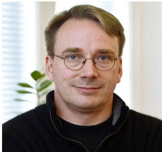
Slika 1: Linus Torvalds

Gotovo svi serveri (aproksimativna brojka u rasponu od 95% do 100% 39 ) web stranica koristi Linux, a čak i Android , mobilni operacijski sustav tvrtke Google, vodeći na polju mobilnih uređaja, koristi Linuxov kernel.