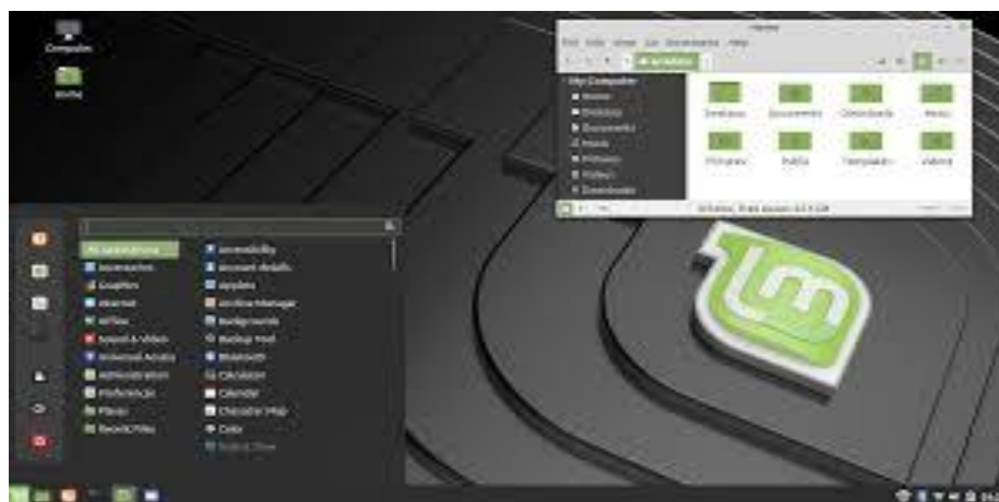
Slika 6: Prikaz Cinnamon desktop environmenta

Od ostalih desktop environmenta valja spomenuti još i XFCE (rješenje za starija računala s obzirom da zahtjeva procesor od samo 300 MHz radnog takta te 192 MB RAM memorije), Unity (sučelje koje je razvijeno od strane tvrtke Canonical, tvorac distribucije Ubuntu , no danas se nalazi jedino na Ubuntu ), LXQt Desktop , Deepin Desktop Environment te Enlightenment Desktop