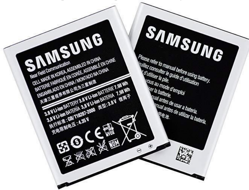
Slika 6. Opasni element prikazan na bateriji od mobitela