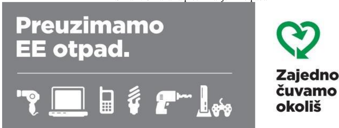
Slika 4. Oznaka za preuzimanje EE otpada