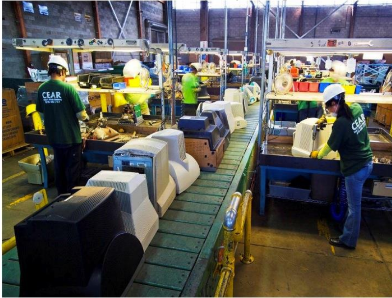
Slika 3. Proces zbrinjavanja EE otpada.