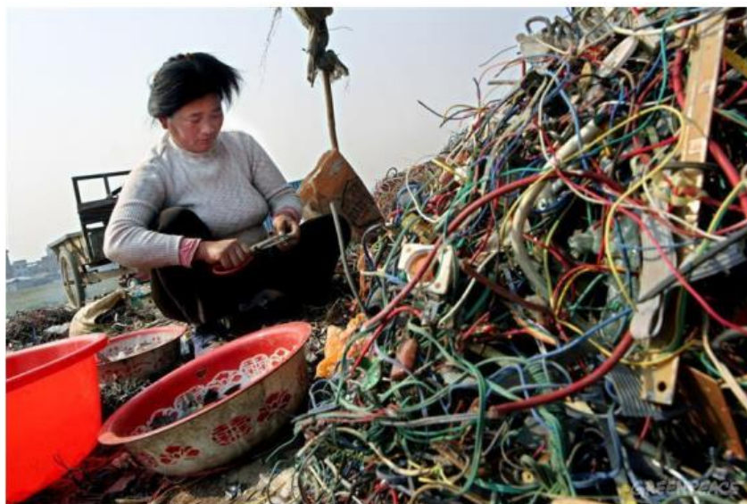
Slika 13. Primjer rastavljanja EE otpada na odlagalištu u gradu Guandongu, Kina