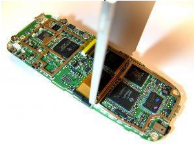
Slika 8. Unutrašnjost mobitela.