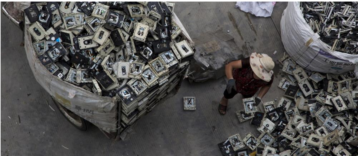
Slika 7. Problem EE otpada.