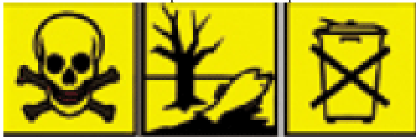
Slika 5. Opasni elementi EE otpada