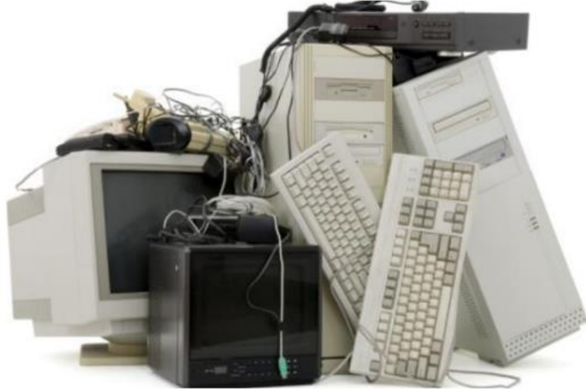
Slika 1. Prikaz EE otpada.