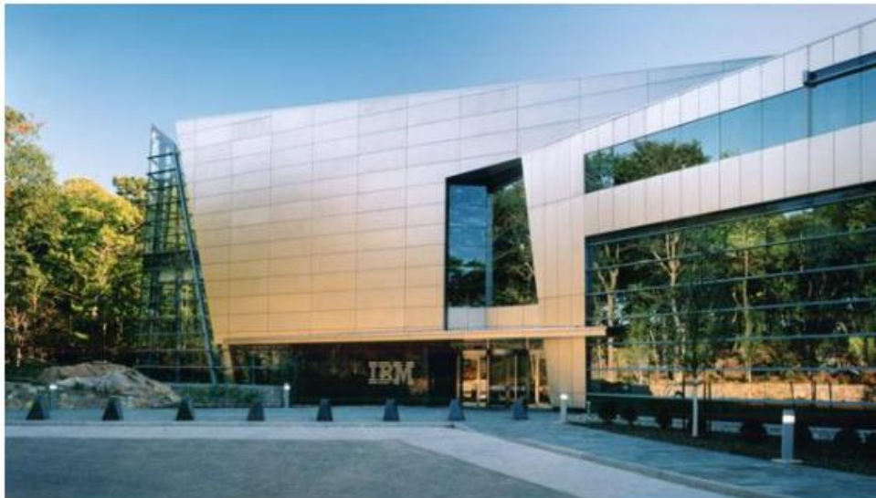
Slika 10. IBM-ova zgrada u New Yorku

Pod obrađenim predmetima vađenih iz EE otpada se broje mikročipovi, odbačene kamere, računala i druga elektronska pomagala. Ta je tvornica 2009. godine sakupila oko 120 tona zlata, 200 tona srebra, 4 tone paladija, jednu tonu platine, 100 kilograma rodija i manje količine rutenija i iridija. IBM, Dell, HP i Gateway su veliki proizvođači računala te na svojim web stranicama nude recikliranje njihovih računala ili originalnih hardvera. U SAD-u znaju organizirati turneje sakupljanja računala pa se u velikim gradovima prikupi i oporabi oko desetak tisuća računala, a EPA nudi besplatnu reciklažu, uz male troškove prijevoza.