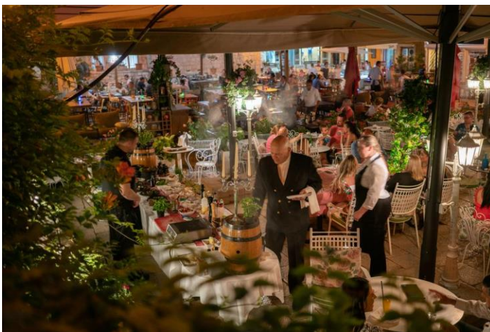
Slika 5. Restoran hotela Life Palace