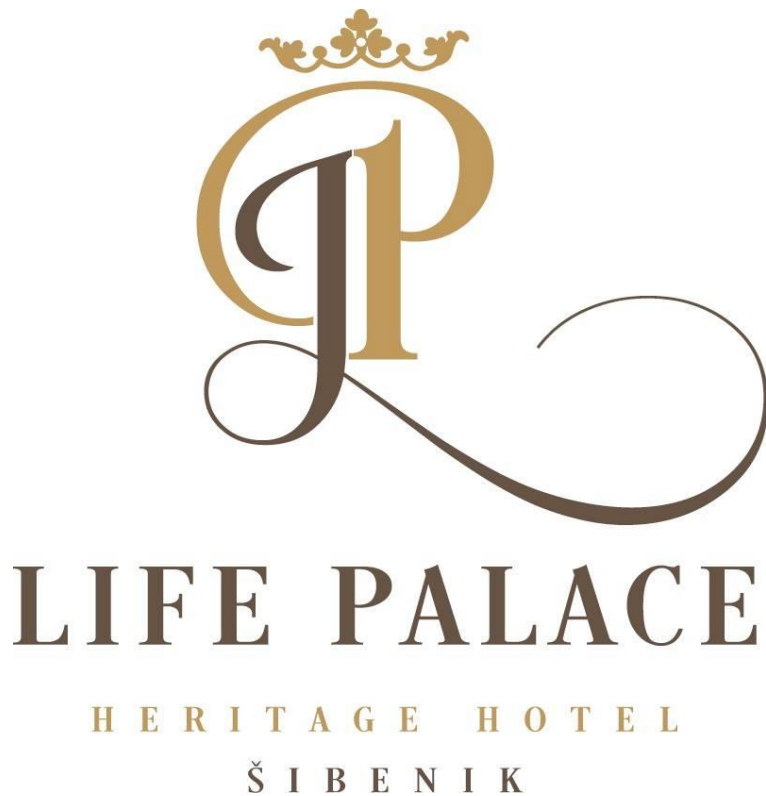
Slika 7. Zaštitni znak hotela Life Palace Šibenik