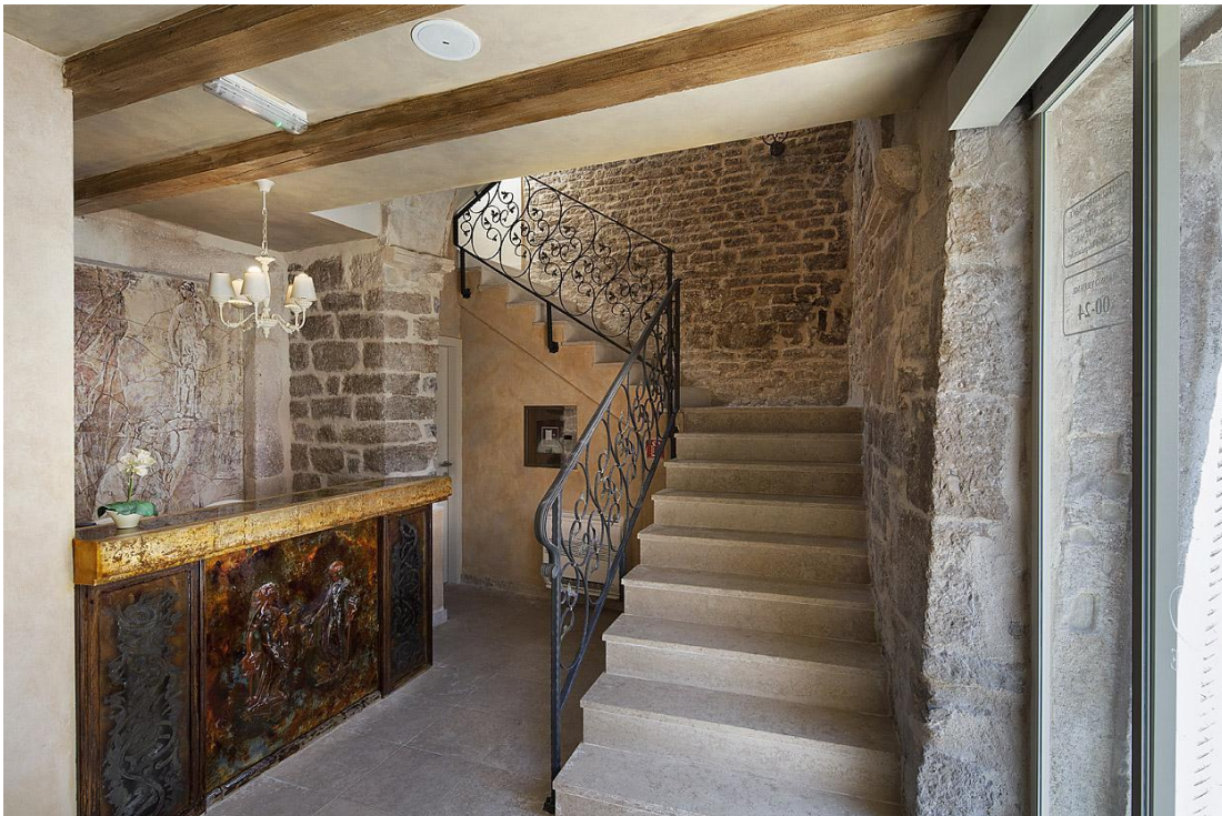
Slika 6. Recepcija hotela