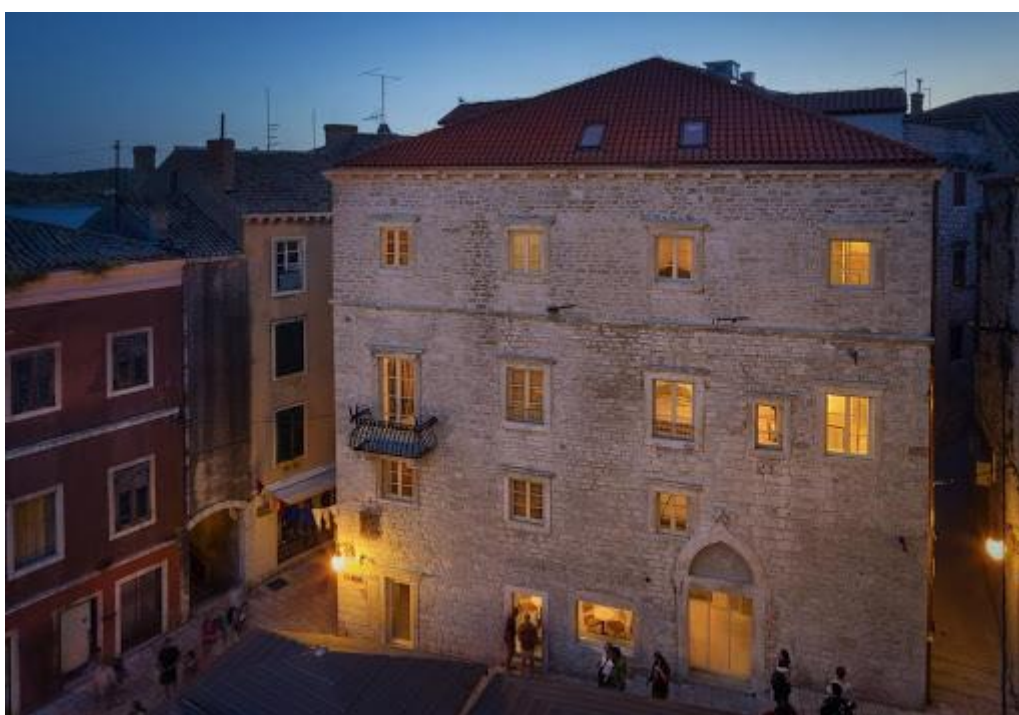
Slika 3. Hotel Life Palace Šibenik