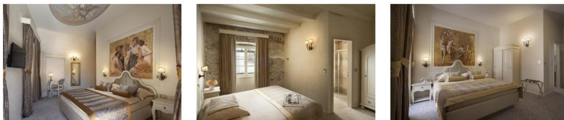
Slika 4. Sobe hotela Life Palace Šibenik