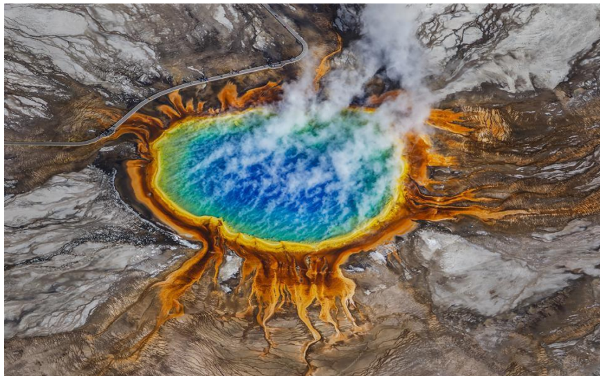
Slika 4. Yellowstone, SAD.