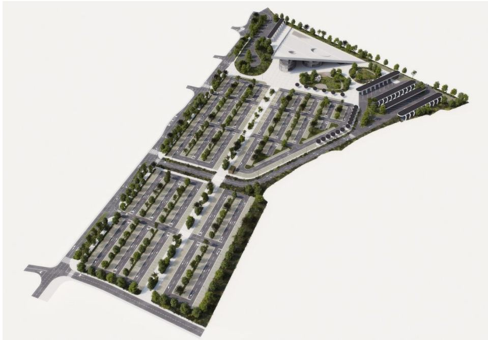
Slika 3. Plan izgradnje Lozovca