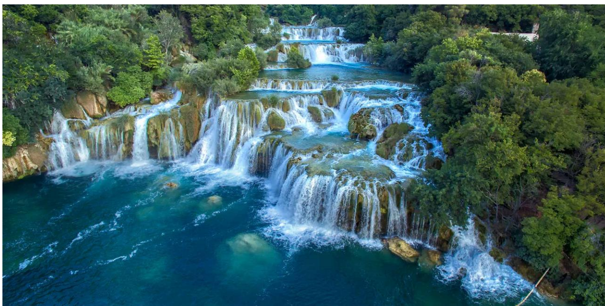
Slika 2. Nacionalni park Krka, Skradinski Buk.