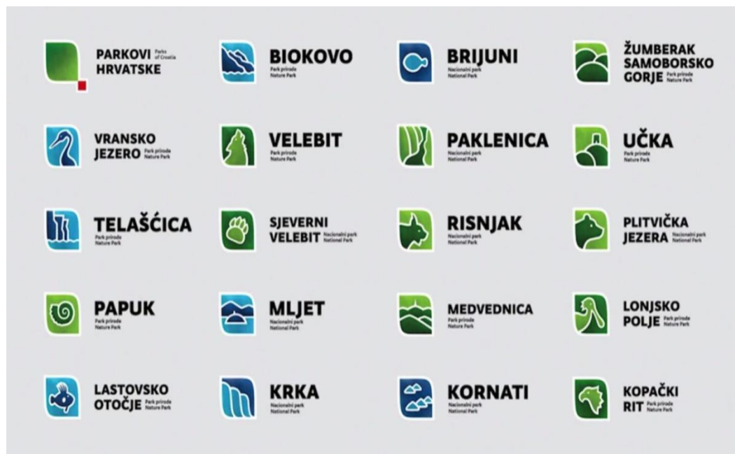
Slika 5. Shematski prikaz logo parkovi prirode i nacionalni parkovi u Hrvatskoj.