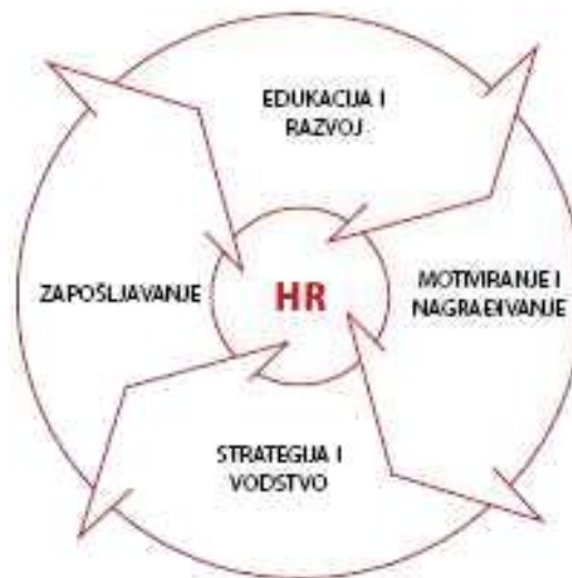
Slika 1. Upravljanje ljudskim resursima