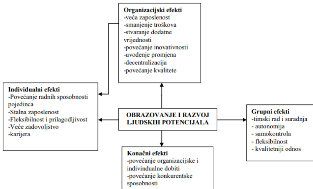
Slika 1. Utjecaj obrazovanja i razvoja ljudskih potencijala na ukupne učinke organizacije