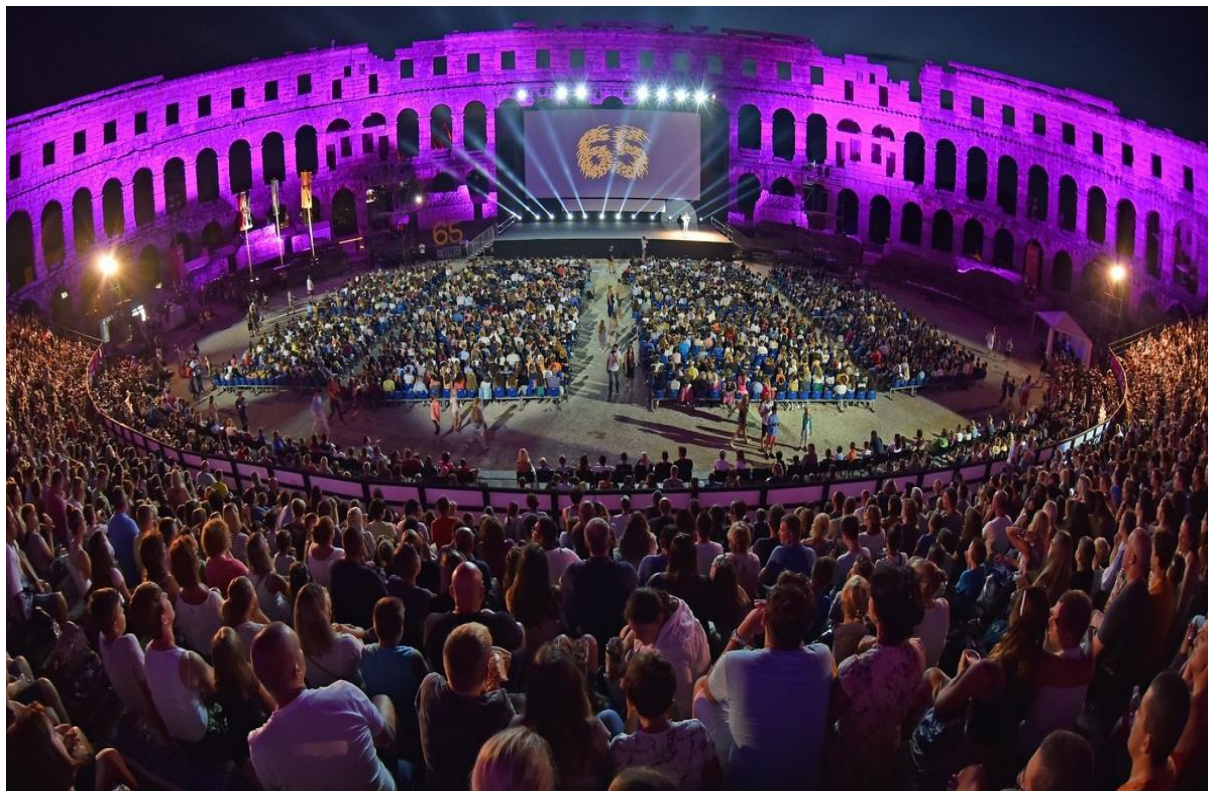
Slika 7. Pulski filmski festival