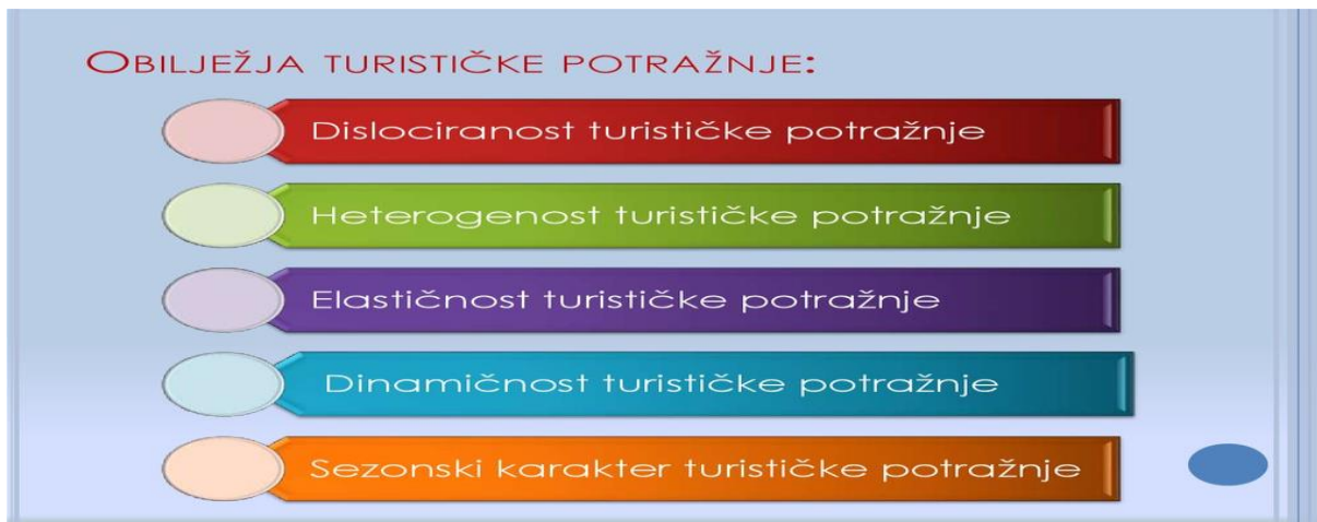
Slika 4. Obilježja turističke potražnje