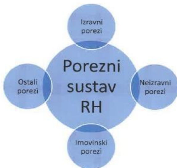
Slika 3. Porezni sustav RH