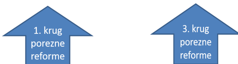
Slika 5. Porezne stope i porezni razredi