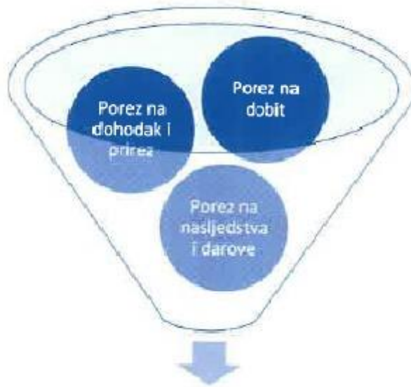
Slika 4. Elementi poreznog sustava Republike Hrvatske