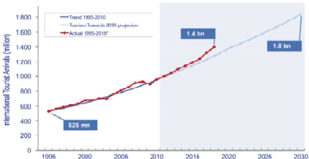
Slika 2 Aktualni trendovi u odnosu na plan TurismForecast 2030 za cijeli svijet

Svjetska turistička organizacija (UNWTO) izdala je plan „TurismForecast 2030” s ciljem promicanja održivog razvoja odnosno očuvanja prirodnih dobara, zapošljavanja stanovništva, većih prilika za mlade ljude, kvalitetnog obrazovanja, očuvanja okoliša itd. Prema tom planu broj dolazaka 2030. godine trebao je iznositi oko 1,8 milijarde ljudi, no vidimo da je broj dolazaka u 2018. godini već došao do 1,4 milijarde ljudi, što nam govori da se broj dolazaka sve više povećava. Razlog je mnogo kvalitetnih sadržaja koje određena odredišta nude te činjenica da je ljudima sve više u cilju putovati i koristiti odmora za upoznavanje odredišta u kojima još nisu bili.