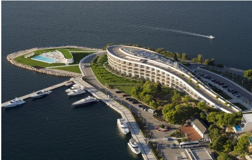
Slika 5 D-resort Šibenik