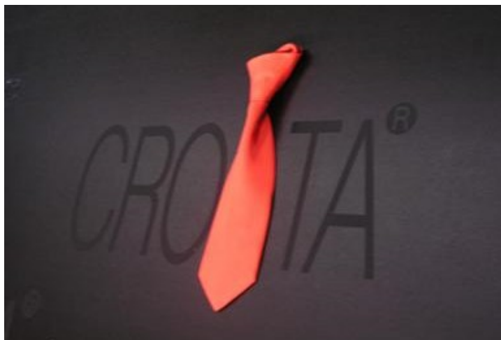
Slika 9. kravata kao hrvatski svjetski poznati registrirani proizvod od tvrtke Potomac.

http://www.cromoda.com/croata-i-froddo-odnedavno-u-shopping-cityju-westgate