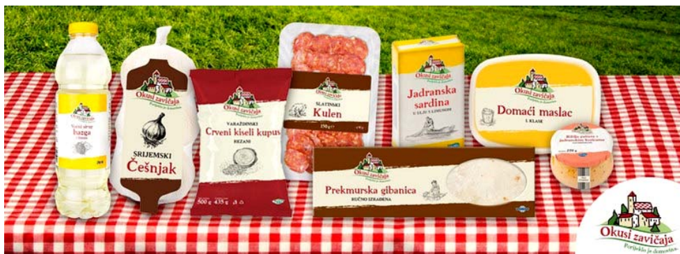
Slika 8. neki proizvodi u Lidlovoj trgovini iz asortimana Okusi zavičaja

Riječ je o marki koja je u lidlovom asortimanu od 2013. godine koja sadrži više od 70 proizvoda domaćih proizvođača. Linija Okusi zavičaja obuhvaća suhomesnate, riblje i mliječne proizvode, kruh i tjesteninu, voće i povrće, med i ulje prepoznatljive ambalaže i logotipa, koji simbolizira povezanost s