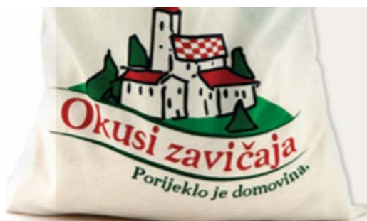
Slika 7. logo Lidlove marke Okusi zavičaja

http://www.poslovni.hr/media/cache/31/83/3183350bf446c4e220bf51c3f6217a15.jpg